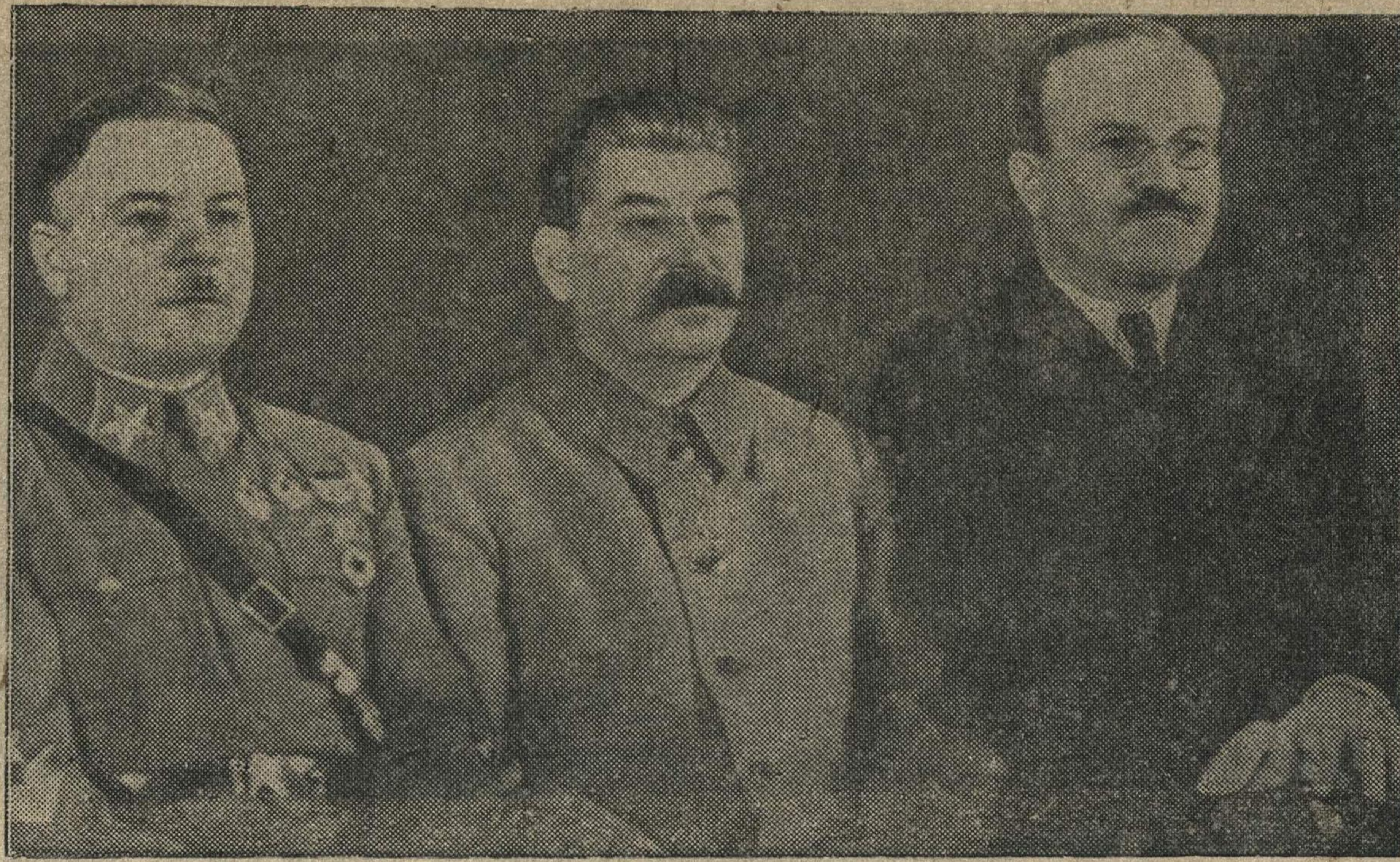
Товарищи К. Е. Ворошилов, И. В. Сталин, В. М. Молотов.

НАША кореволлюционная литература, в лице ее лучших представителей усердно искала путей лучшего служения народу. Но надо сказать, что даже великие русские писатели, поскольку они не выходили из сферы буржуазного общества и его мировоззрения, не видели путей, обеспечивающих победу народа над угнетателями, не видели и людей, борющихся за эти пути.