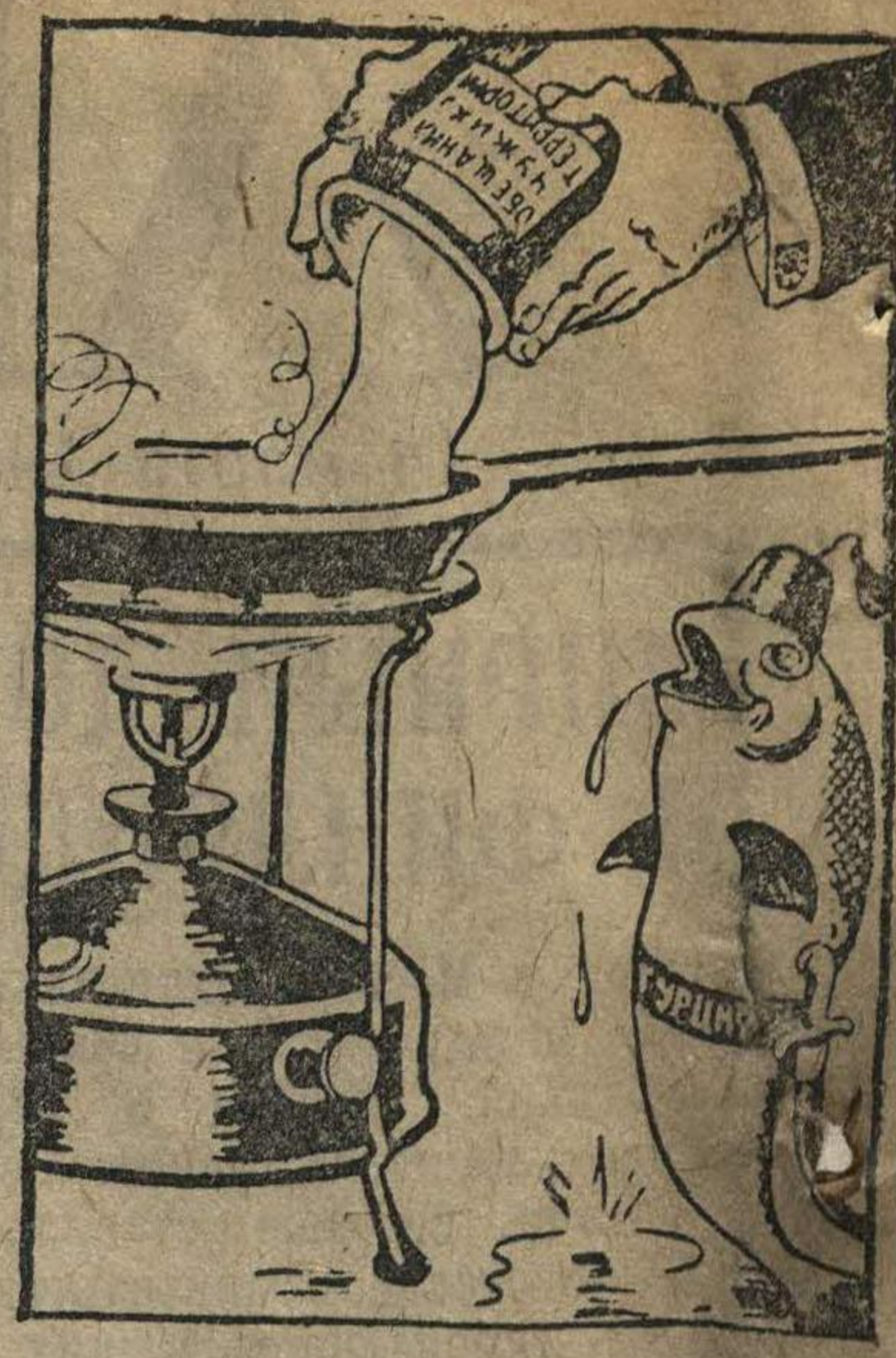
Карась, который хочет быть жареным в масле. Рис. В. Перош. (ТАСС).

Отметив, что целью врагов Германии является ее расчленение, Гитлер заявил, что в ответ на это Германия будет бороться «за наибольшее единство, чем это было когда-либо в истории». Гитлер вновь подчеркнул готовность Германии вести навязанную ей Англией и Францией войну до победного конца. «В этот знаменательный день», — сказал он, — мы все должны дать торжественную клятву, что навязанная великой Германской империи капиталистическими властями Франции и Англии война должна стать величайшей в германской истории победой над врагами».