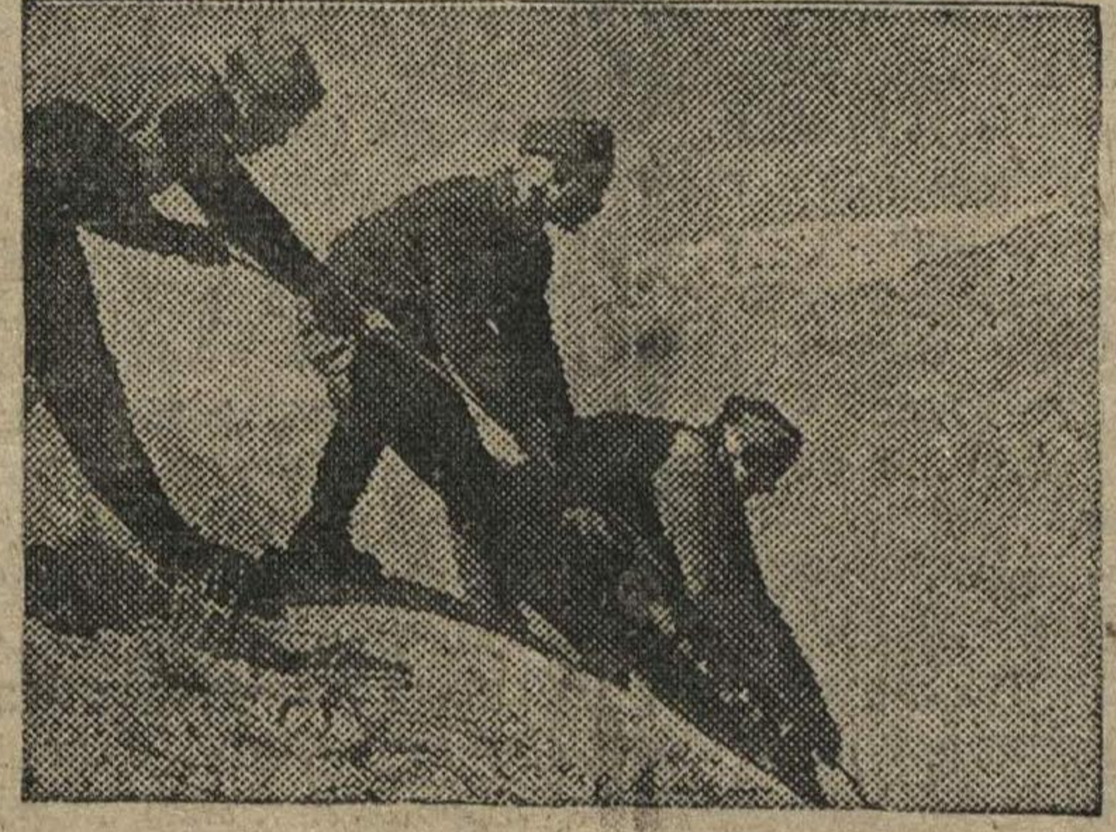
Альпинисты-пограничники Н-ского погранотряда в горах Памира.