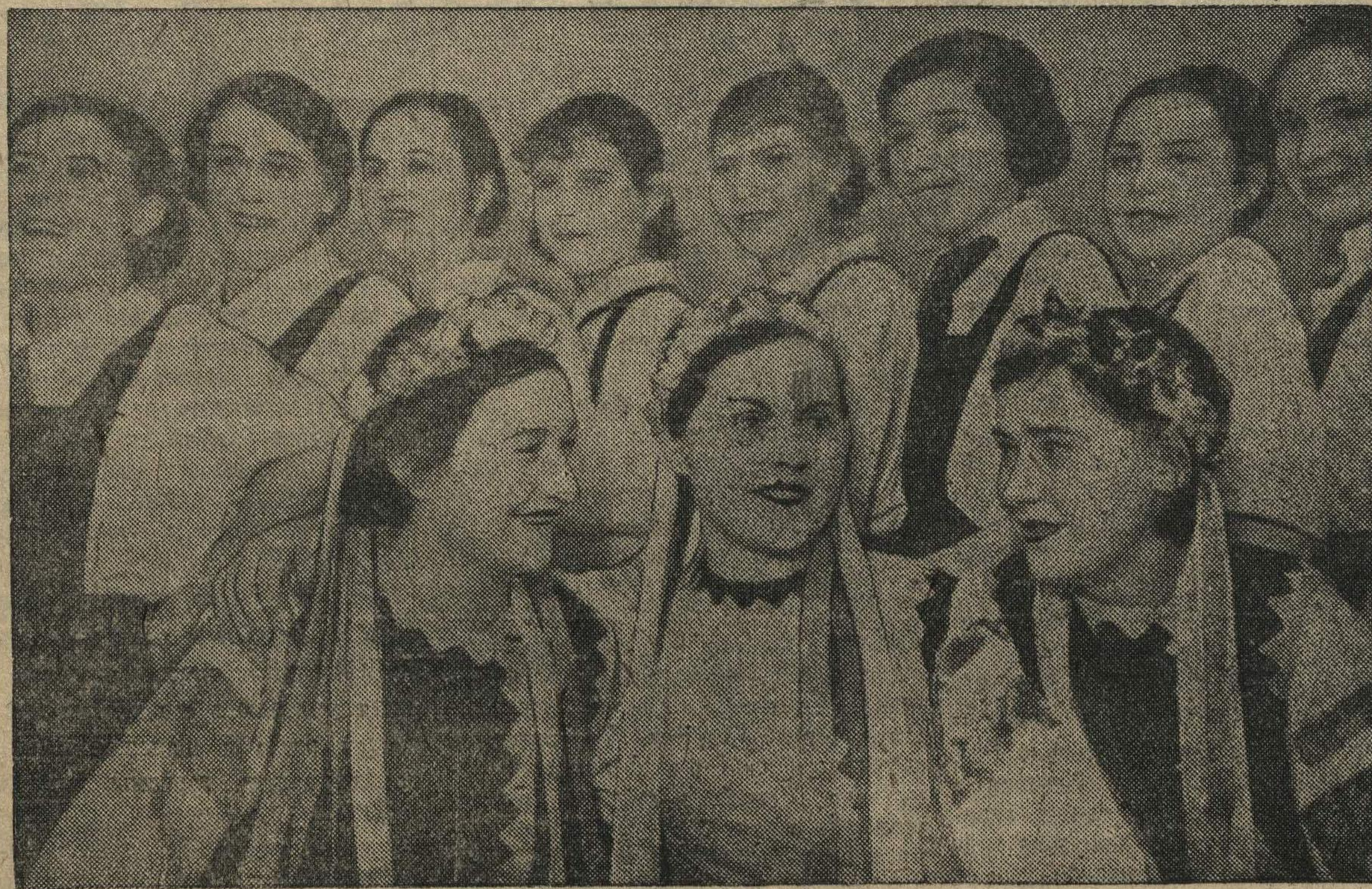
Группа участниц ансамбля песни и пляски Балахнинского бумкэбината.

ТОКИО, 10 марта (ТАСС). Все газеты сообщают о новых назначениях в японской армии. Гейд-лейтенант Окамүра назначен членом высшего военного совета, генерал-лейтенант Камүмура — командующим обороной западного сектора Японии, генерал-лейтенант Ивасүмура — командующим обороной центрального сектора Японии, генерал-лейтенант Коүмура — начальником штаба главного инспектора военного обучения.