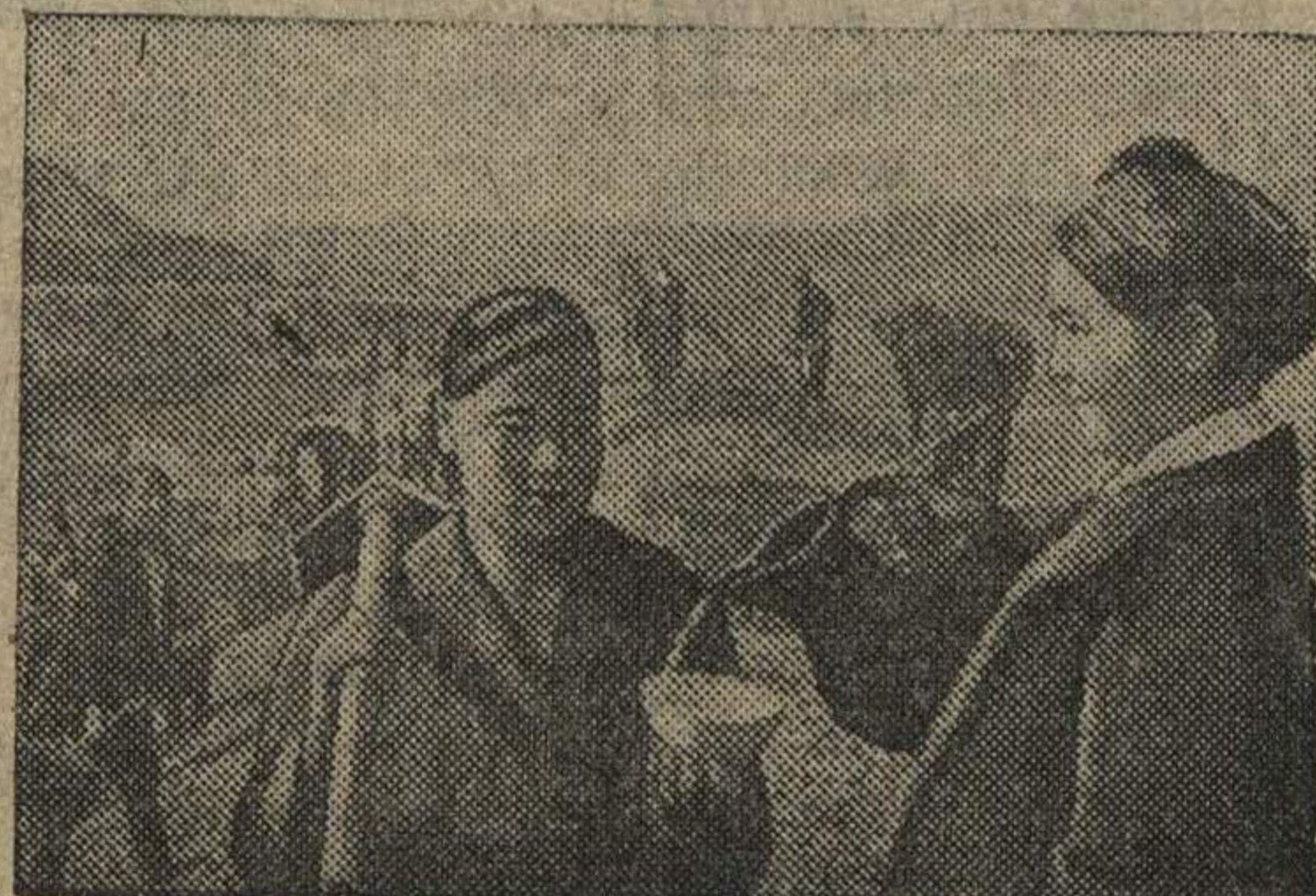
На строительстве Южного Ферганского канала.

КРАСНОЯРСК. В горных предместьях Красноярска 12—18 марта проходили всеююзные соревнования на личном первенство по горнолыжному спорту. Соревнования показали высокое мастерство советских горнолыжников. Достигнуты выдающиеся спортивные результаты. Установлены новые рекорды.