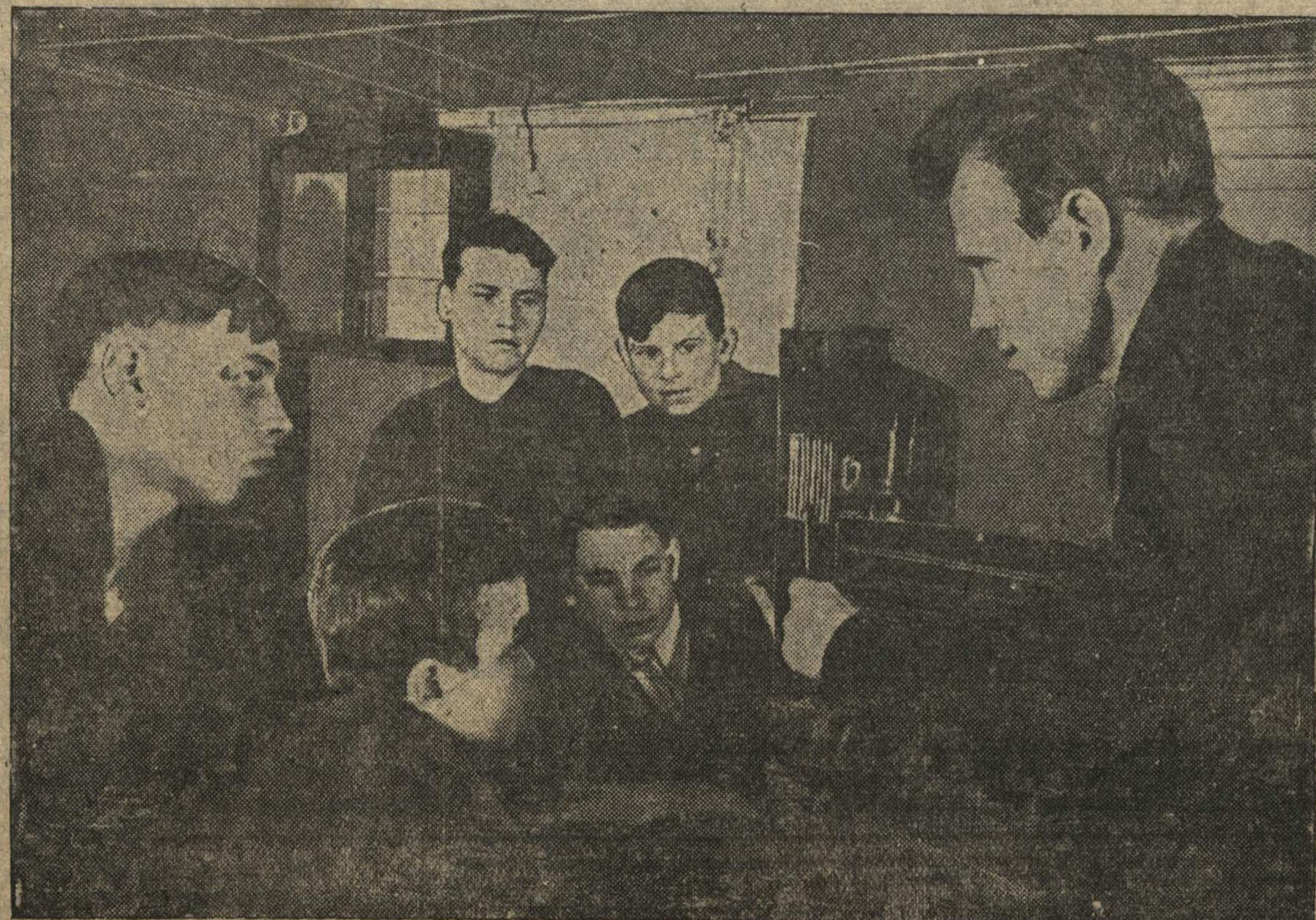
Подготовка кадров к навигации 1940 года на заводе имени Карла Маркса. На снимке: занятие на курсах ночгаров.

Уже приступили к очистке пруда на Интернациональной улице. В течение трех выходных дней здесь отработало 990 человек.