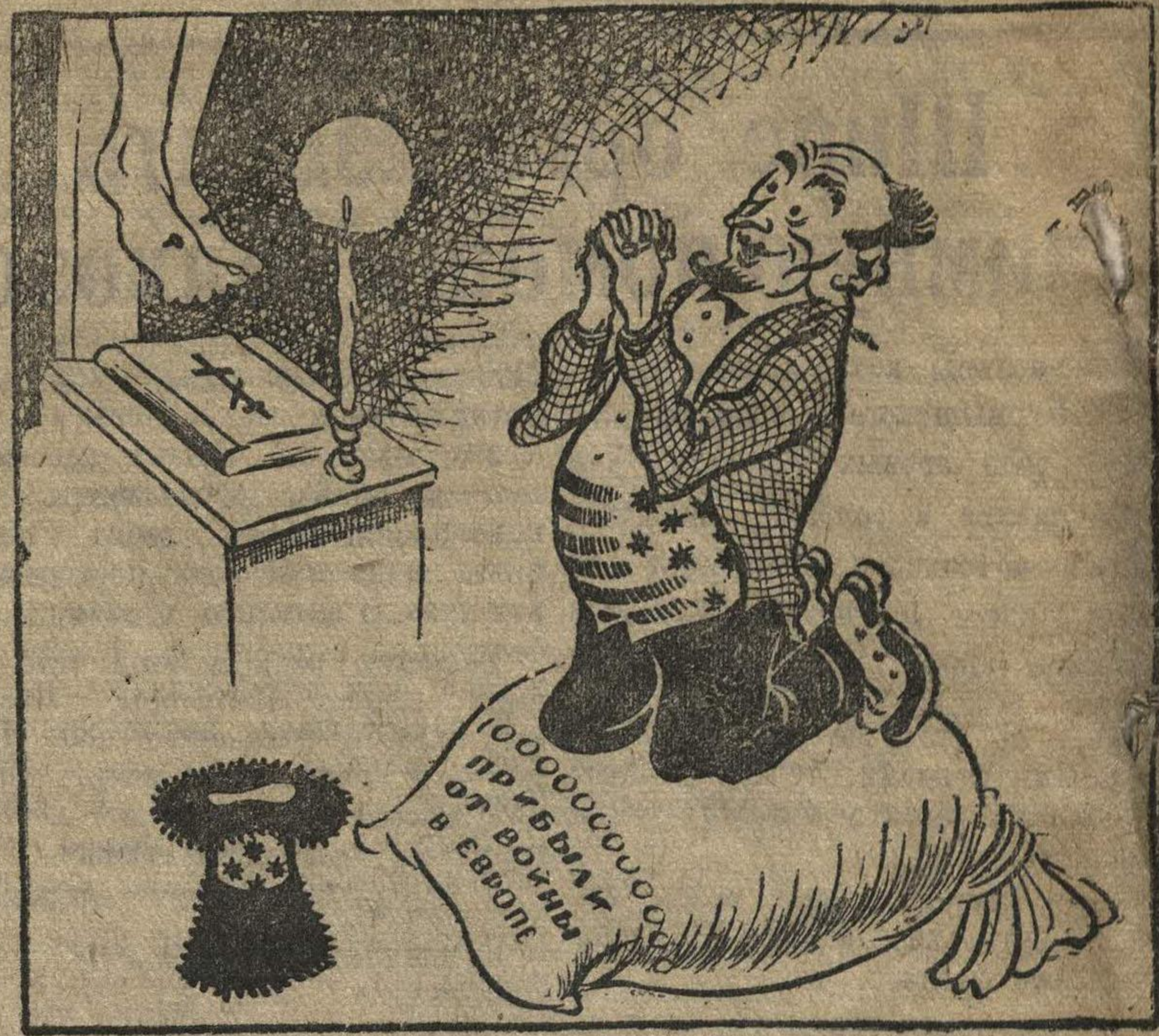
— Господи, услыши молитвы наши, не дай заглухнуть войне в Европе.