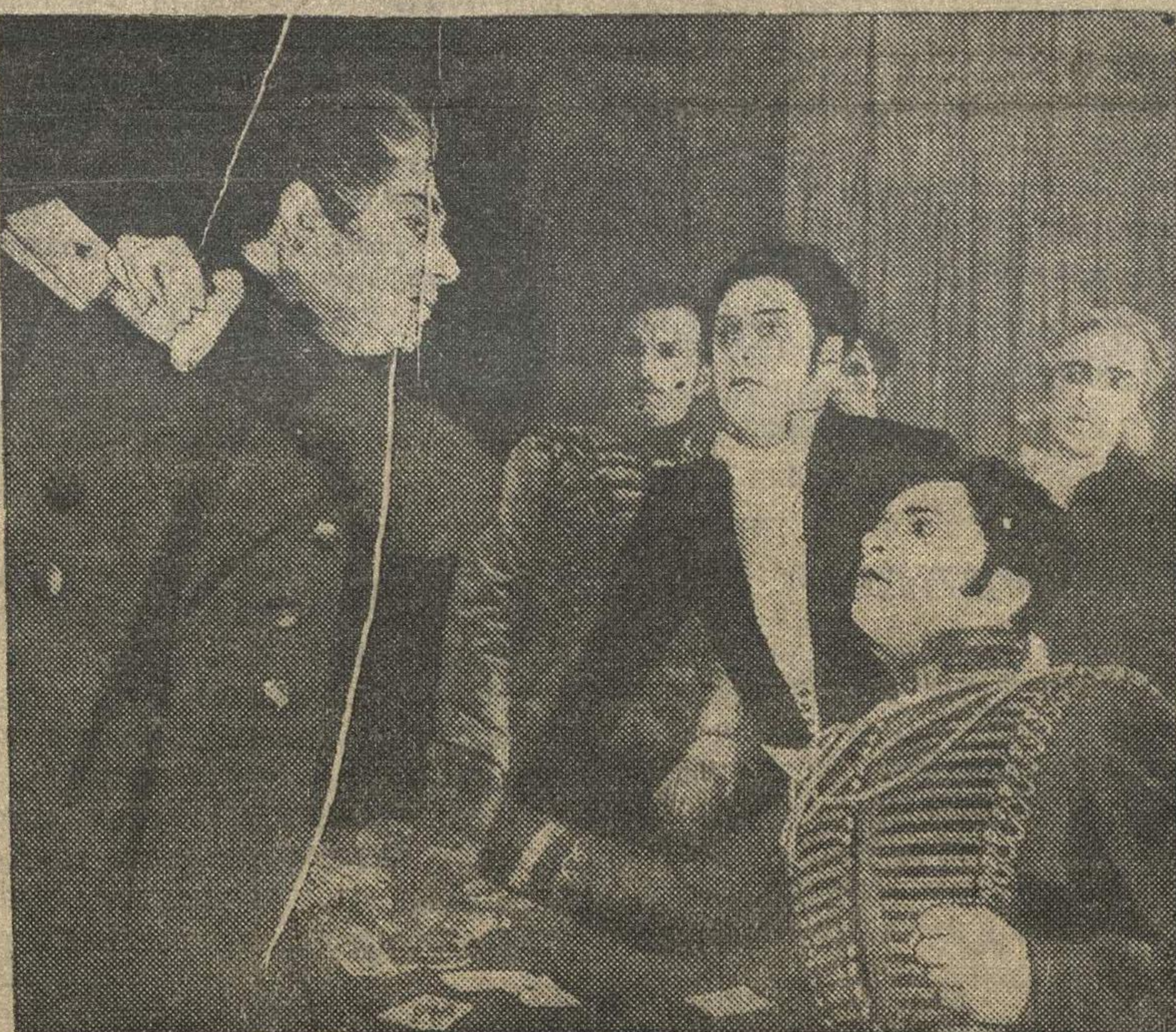
«Маскарад» Ю. М. Лермонтова в областном театре драмы. На снимке: сцена в игорном доме.

Сейчас в колхозах района работает более 60 агротехников—мастеров стахановских урожаев.