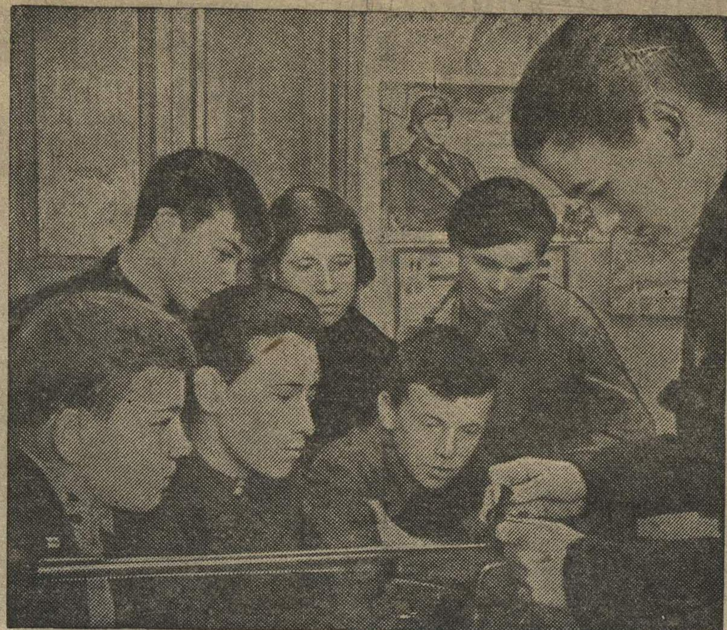
В военном кабинете школы № 1 г. Горького. На снимке: активисты стрелкового кружка изучают винтовку.