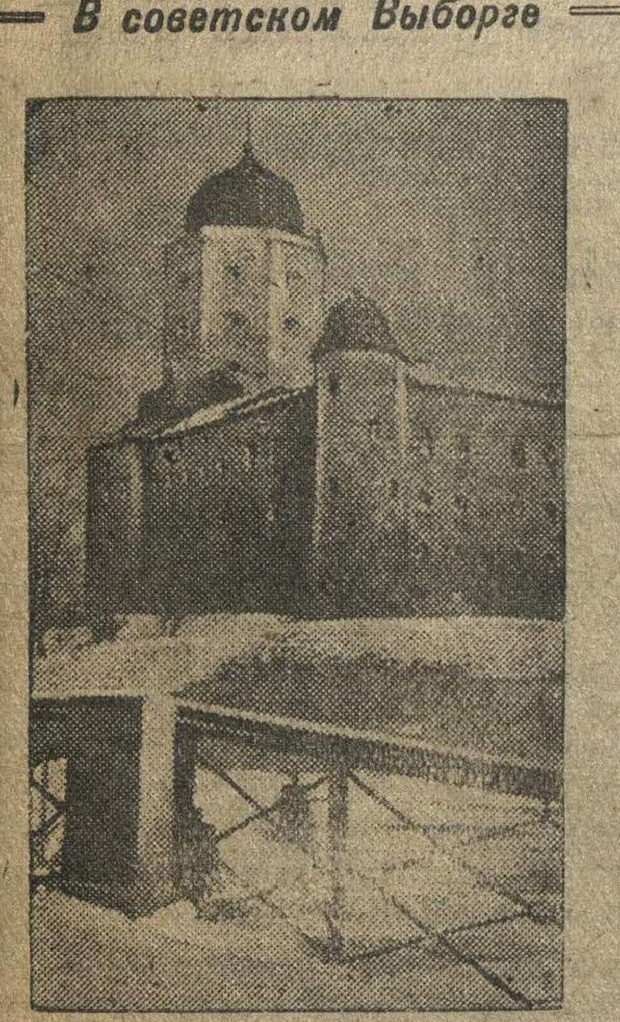
На снимке: Выборгская крепость.