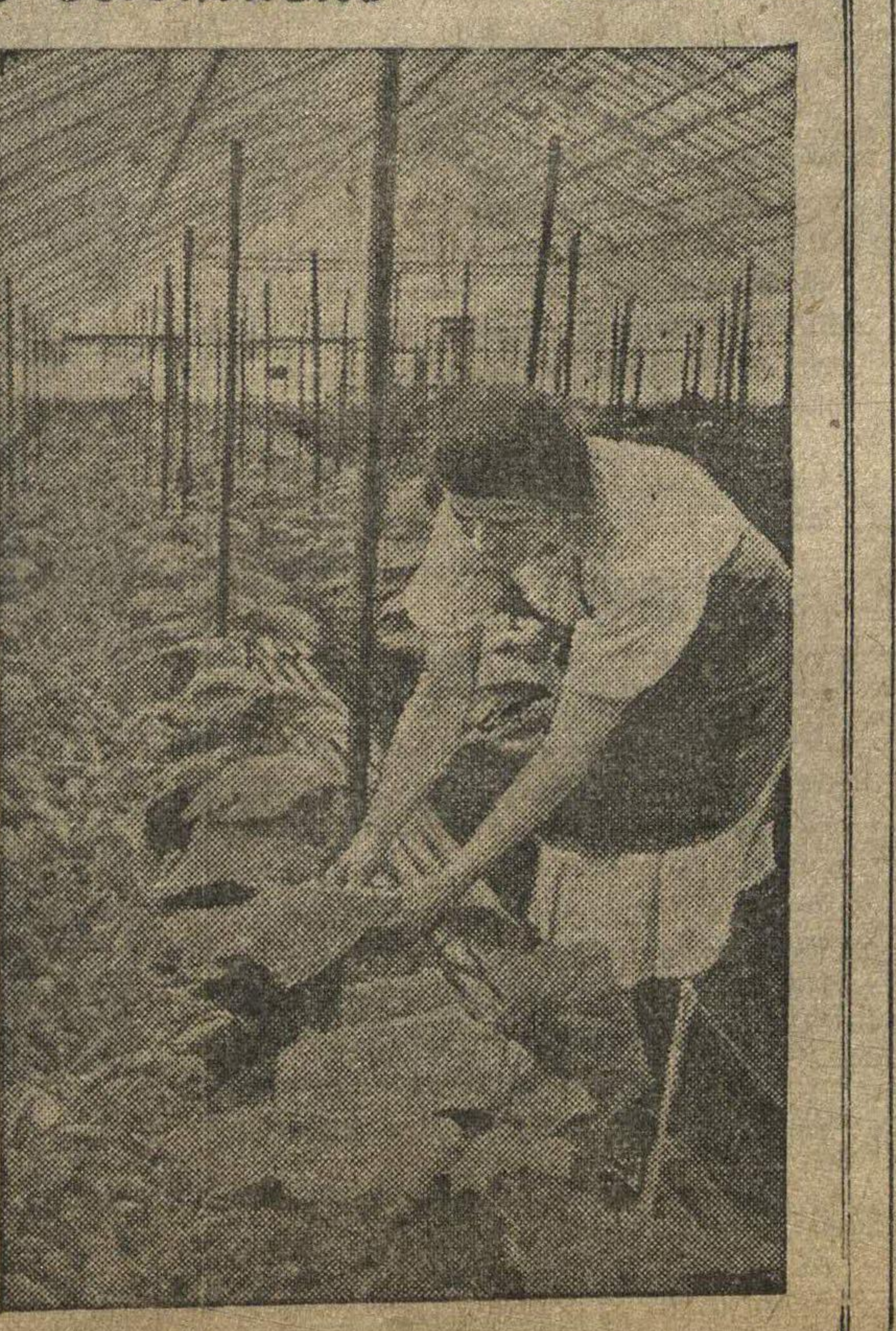
На снимках: слева — главный павильон выставки — укутанные тропические растения, зимовавшие в грунте. Справа — в овощной теплице.

2700 районов, 133 600 колхозов, 4.500 МТС, 1.300 совхозов, свыше 230 тысяч бригад, 500 тысяч звеньев, свыше полумиллиона передовиков сельского хозяйства по-прежнему далеко еще не полным данным соревнуются в этом году за право участия на Всесоюзной сельскохозяйственной выставке. К началу марта поступило уже больше 410.000 заявлений о желании участвовать на выставке. Приток заявлений все нарастает. Красноярский край представляет для широчайшего показа по зерновым культурам всю Хакасскую автономную область. Украина выдвигает для участия на выставке все 2500 колхозов Полтавской области, которые добились выдающихся достижений по свиноводству. Много интересного покажет и павильон «Механизация». 17 заводов Главсельмаша летят сейчас для этого павильона 213 экспонатных машин, из которых 73 являются прототипами. Всесоюзный колхозный университет-выставка будет в текущем году еще более интересной и разнообразной, она еще ярче продемонстрирует победы нашей пашни в строительстве новой колхозной деревни.