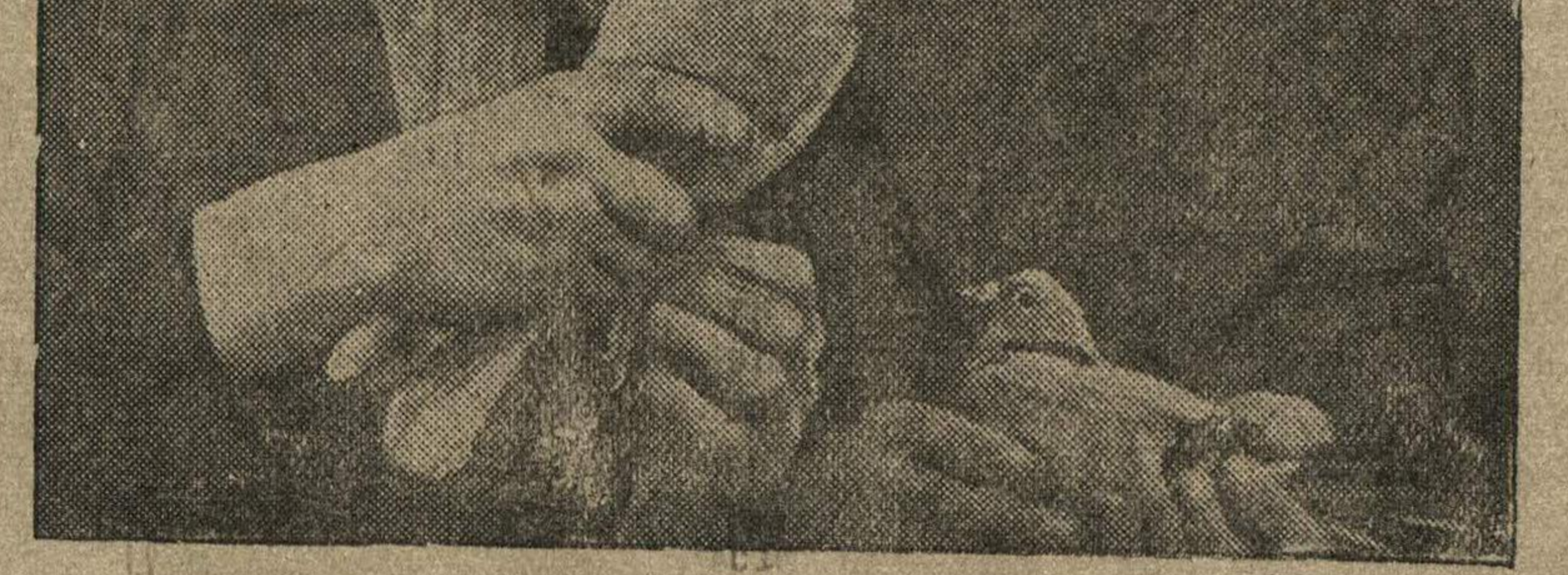
Юные голубоводы школы № 102 Боря Соболев и Митя Грязнов. На снимке: Боря Соболев прикрепляет голубеграмму.