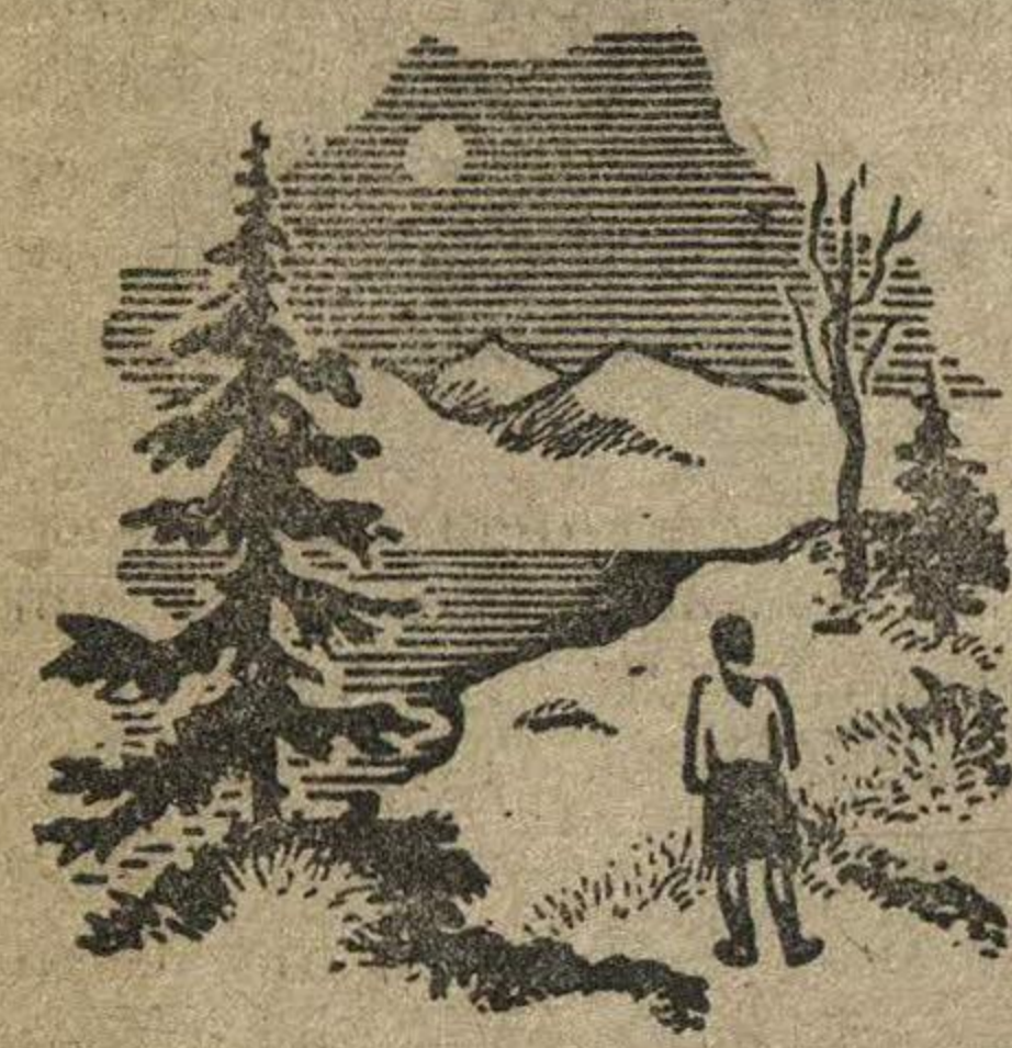
Иллюстрация И. В. Бакса (1939)

Р. ФРАЕРМАН ДИКАЯ СОБАКА ДИНО. КАМ ПОВЕСТЬ О ПЕРВОЙ ЛЮБВИ