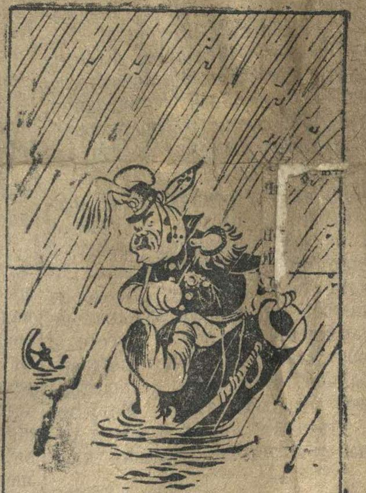
В Китае для японских захватчиков стоит пасмурная погода.

СТОКГОЛЬМ, 28 апреля (ТАСС). Вчера в Лунде начался процесс по делу о взрыве в помещении коммунистической газеты «Норрбюфламман». Процесс вызвал огромный интерес со стороны рабочего населения. На суде выяснилось, что взрыв был подготовлен под руководством редактора консервативной газеты «Норрботтенсуенден» Хелленстрема. В частности, в помещении редакции этой газеты были изготовлены бомбы, которые затем были положены под типографские машины. Сразу после взрыва весь дом был охвачен пламенем. Выяснилось также, что четверо обвиняемых, совершивших поджог, были вооружены. Все обвиняемые признались, что они знали о том, что в подожгаемом доме находились люди. Все они признали свою виновность, кроме бывшего начальником полиции Халлеберга, который обвиняется не только в составлении плана поджога, но и в ряде других уголовных преступлений. Его просьба об освобождении из-под ареста была отклонена.