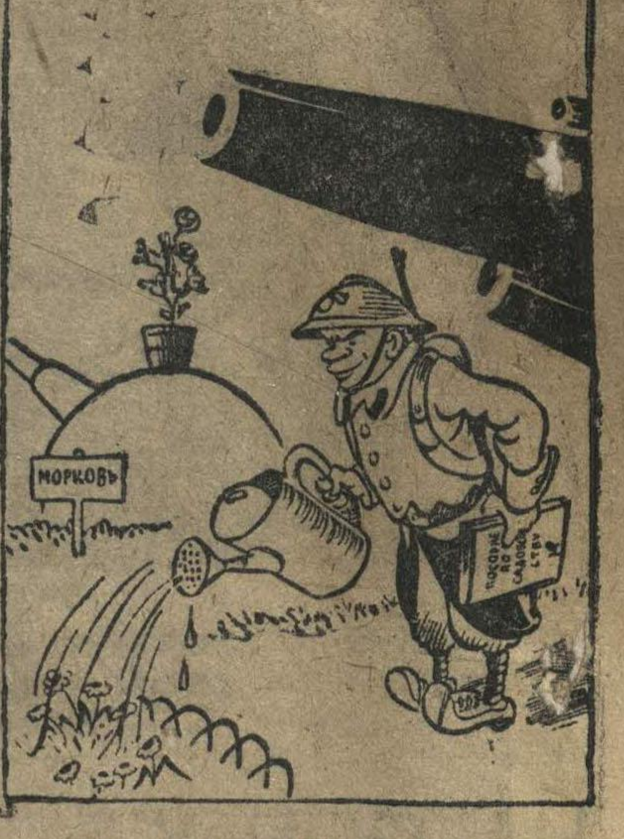
На линии Мажино появились первые цветочки, злобно вращенные английскими Томми (так называют английские солдаты).

БЕРЛИН, 28 апреля. (ТАСС). Германское информационное бюро сообщает, что в районе южнее и восточнее Ломбоса германская авиация бомбардировала и обстреливала из пулеметов лежащее в колонии провинция. Везантность нападения заставила неприятеля врасплох, и он понес серьезные потери. Германские части взяли большое число пленных. В Корсе уничтожен склад с боеприпасами. В районе Ставангера захвачено 267 пулеметов, свыше 10 тыс. винтовок с несколькими миллионами патронов, много гранатометов и другого военного снаряжения. Германские войска, продвигаясь из Осло в северном и северо-западном направлении, захватили новые территории.