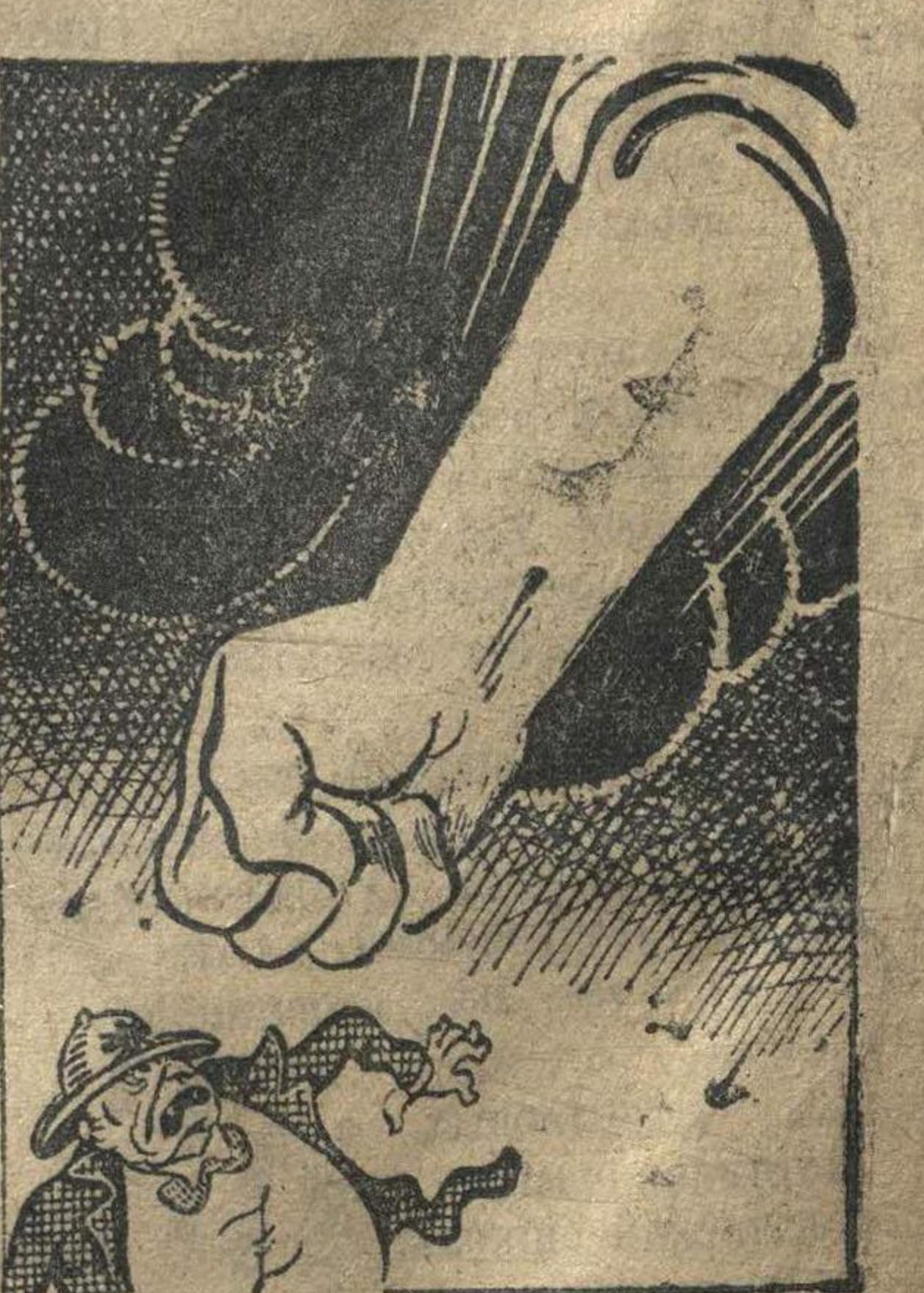
В Индии надвигается гроза против английских империалистов.