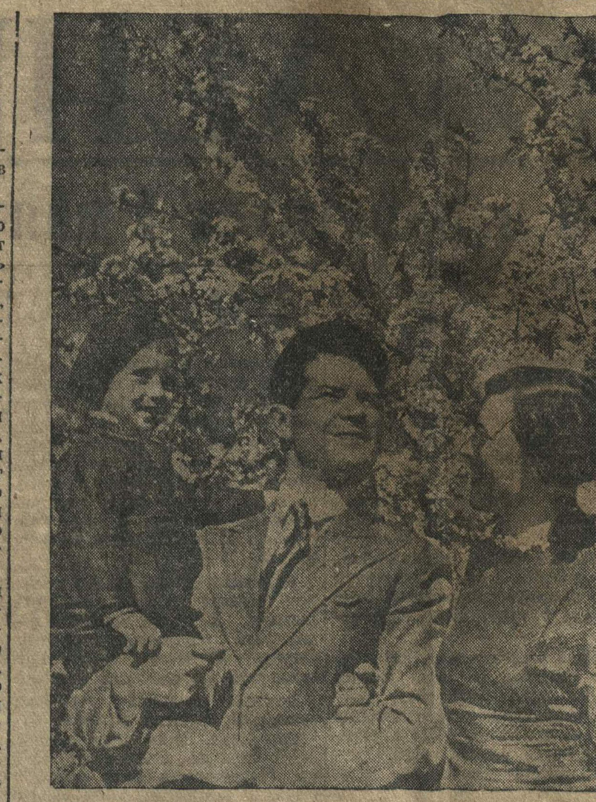
Над страной весенний ветер веет...

Народный Комиссар Военно-Морского Флота Союза ССР Флагман Флота 2 ранга КУЗНЕЦОВ.