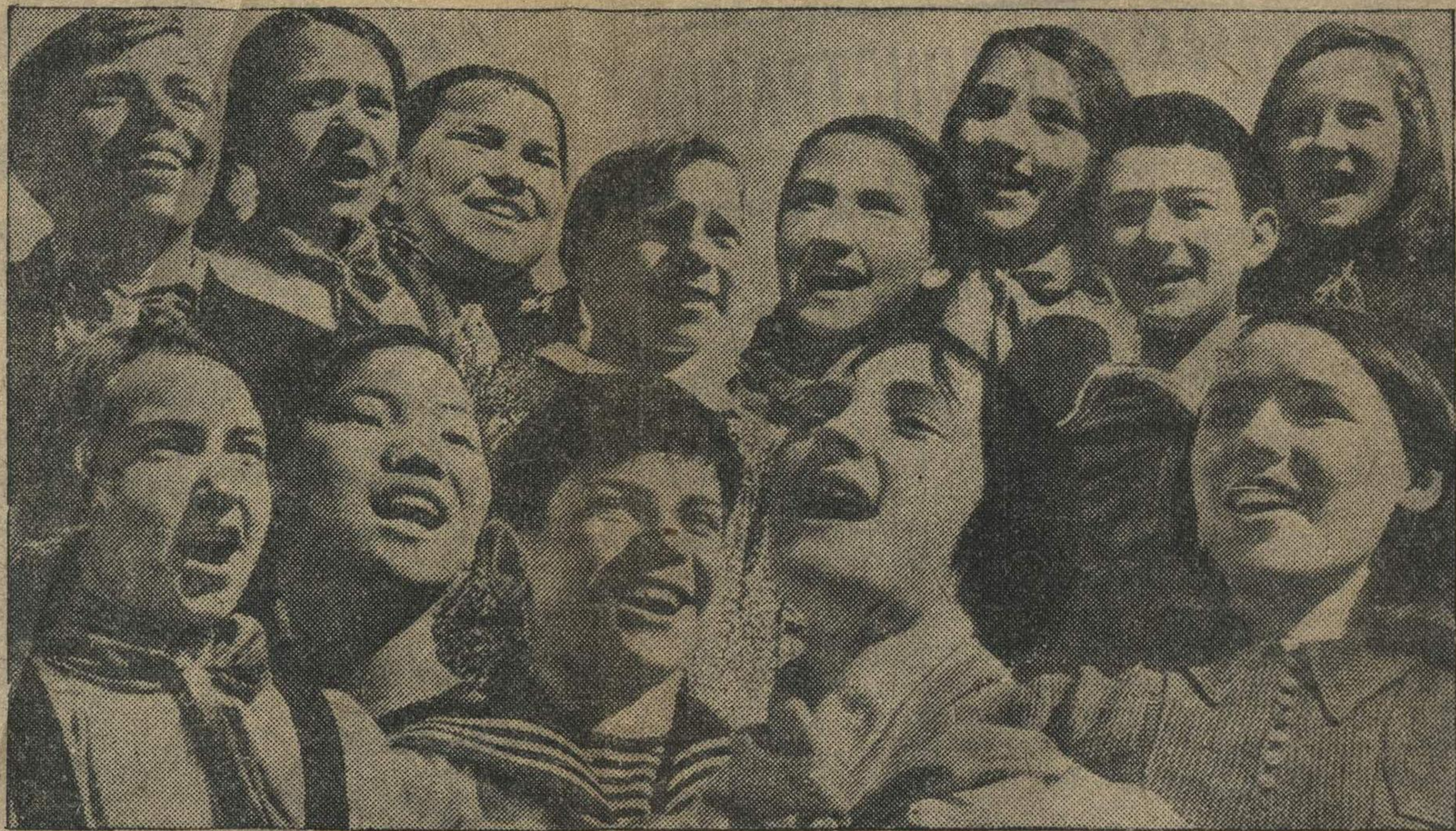
Широкa страна моя родная, много в ней лесов, полей и рек! Я другoй такой страны не знаю, где так волею дышит человек.