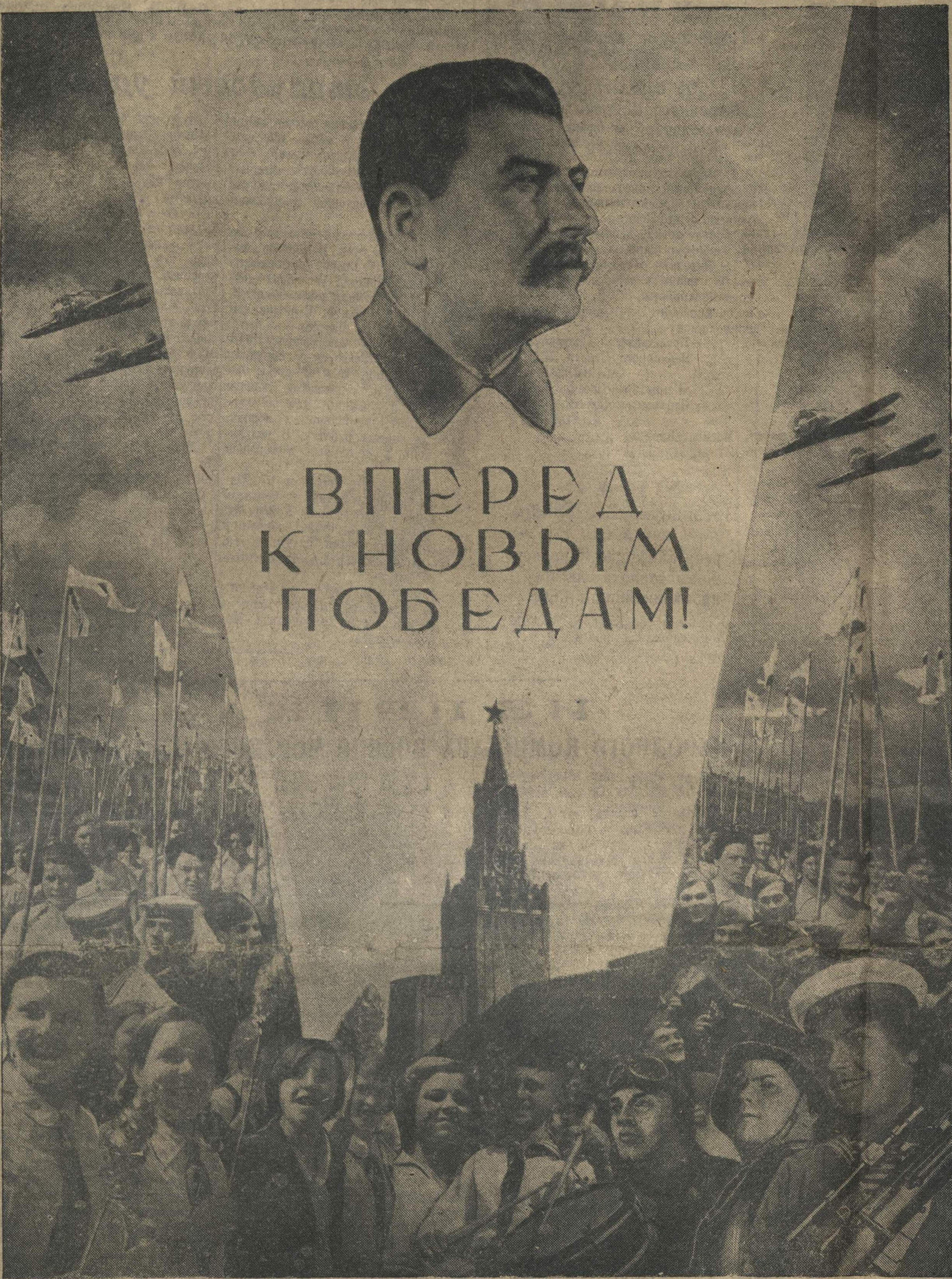
Монтаж Н. ГОЛОВИНА.

Да здравствует великое, непобедимое знамя Маркса — Энгельса — Ленина — Сталина! Да здравствует Ленинград!