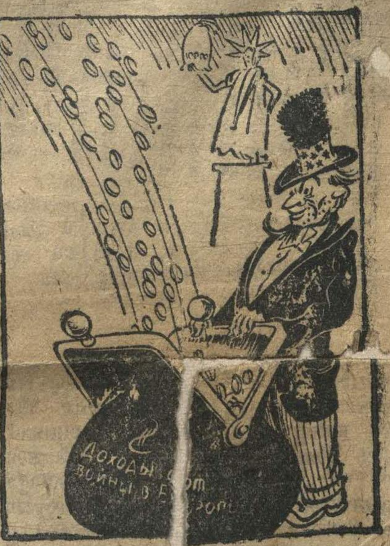
И, наконец, несмотря на весну, американские банкиры уне понижают богатый урожай.