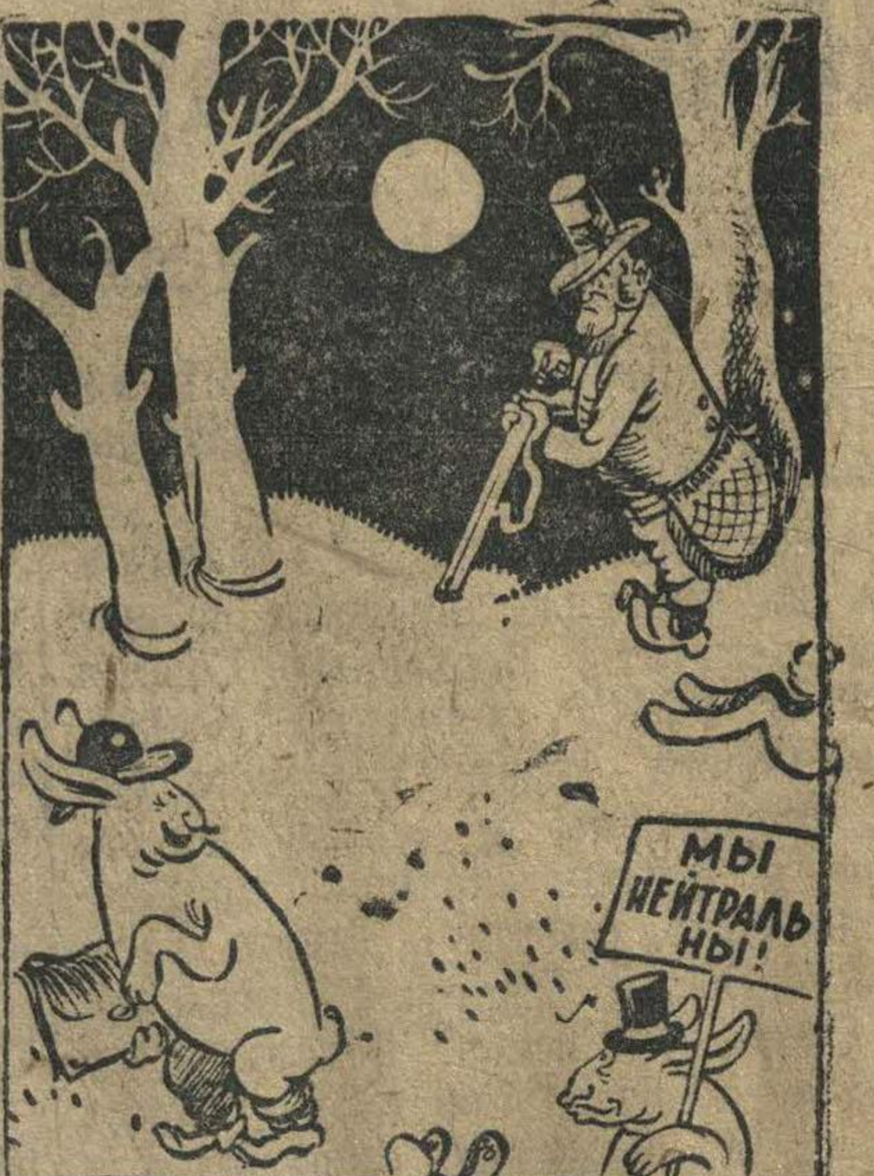
В Европе английские дипломаты начали весеннюю охоту за малыми нейтральными державами.

БЕРЛИН, 28 апреля. (ТАСС). Германское информационное бюро сообщает, что в районе южнее и восточнее Ломбоса германская авиация бомбардировала и обстреливала из пулеметов лежащее в колонии провинция. Везантность нападения заставила неприятеля врасплох, и он понес серьезные потери. Германские части взяли большое число пленных. В Корсе уничтожен склад с боеприпасами. В районе Ставангера захвачено 267 пулеметов, свыше 10 тыс. винтовок с несколькими миллионами патронов, много гранатометов и другого военного снаряжения. Германские войска, продвигаясь из Осло в северном и северо-западном направлении, захватили новые территории.