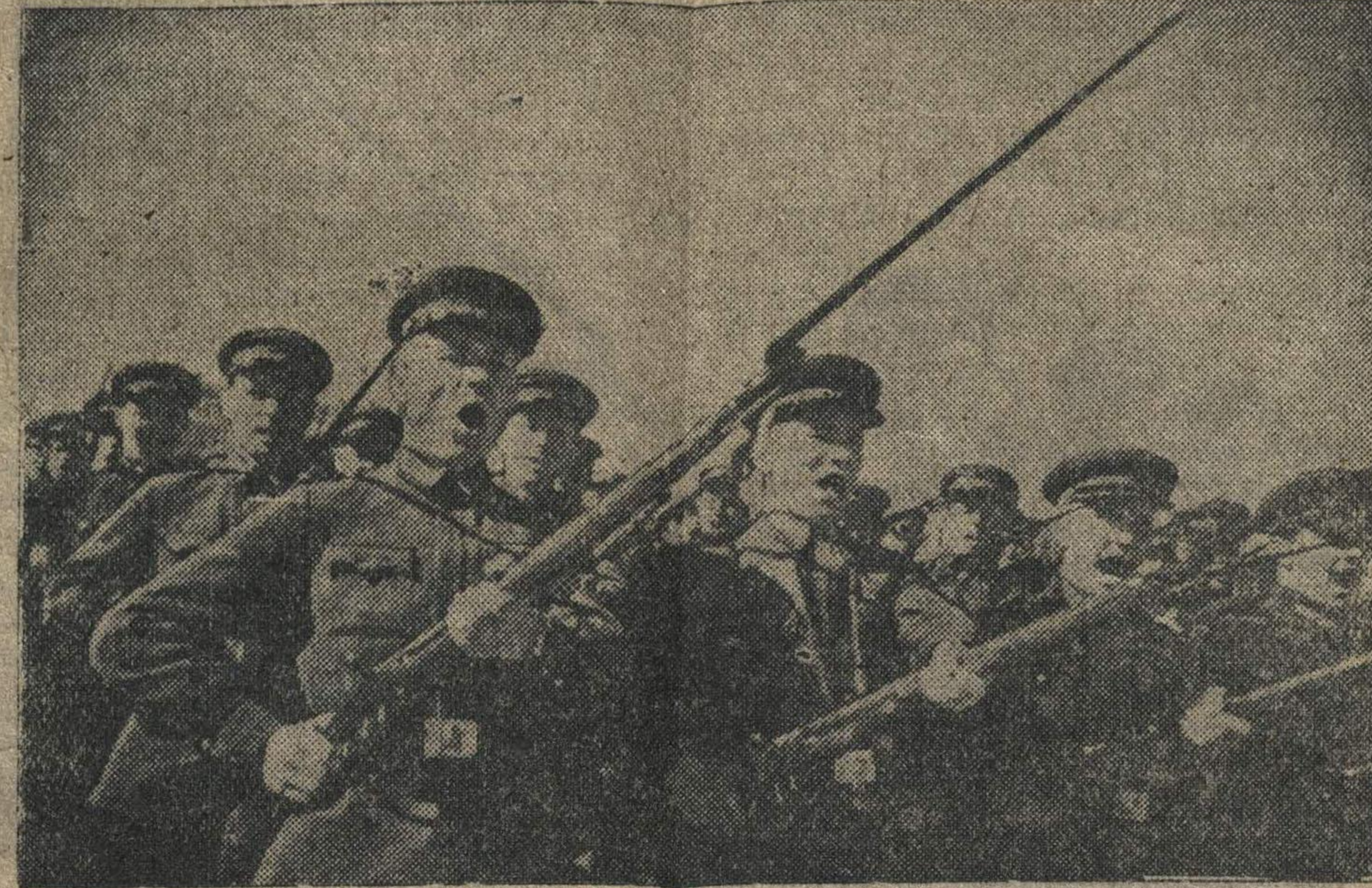
На первомайской демонстрации трудящихся г. Горького. На снимках: слева — слушательницы школы инструкторов физкультуры ВЦСПС проходят мимо трибуны, в центре — с песнями и плясками идут трудящиеся Куйбышевского района. Справа — курсанты военно-политического училища им. Фрунзе на военном параде.