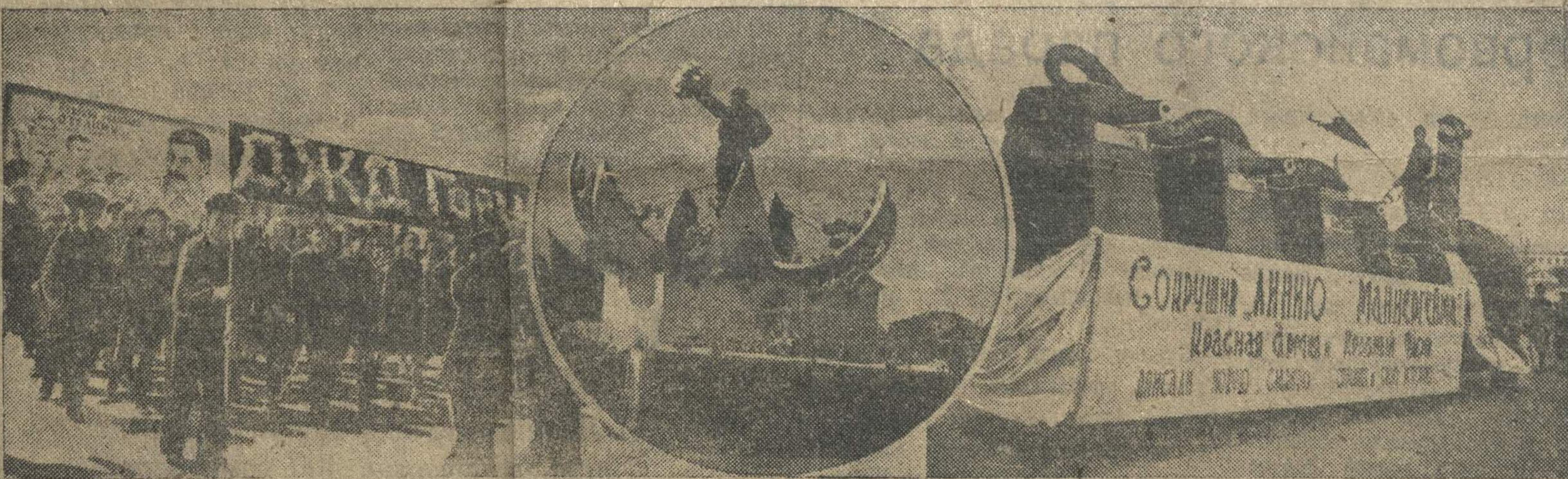
На первомайской демонстрации трудящихся г. Горького. Слева — юные железнодорожники на демонстрации. В центре — оформленные колонны Заречного пиццоторга. Справа — один из плакатов, отображающий силу и мощь нашей доблестной Красной армии.

ЛОНДОН. 3 мая. (ТАСС). Как передает английское правительство, решено отозвать свои войска из района Намоса. Посадка войск на суда уже началась.