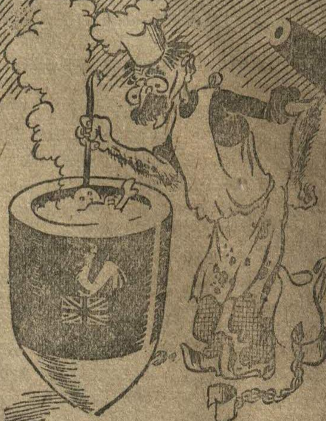
Рис. Н. Головина.

На первое читателям подадут с избытком пилюлю для желудка стриптичи из II Интернационала шовинистическую похлебку.