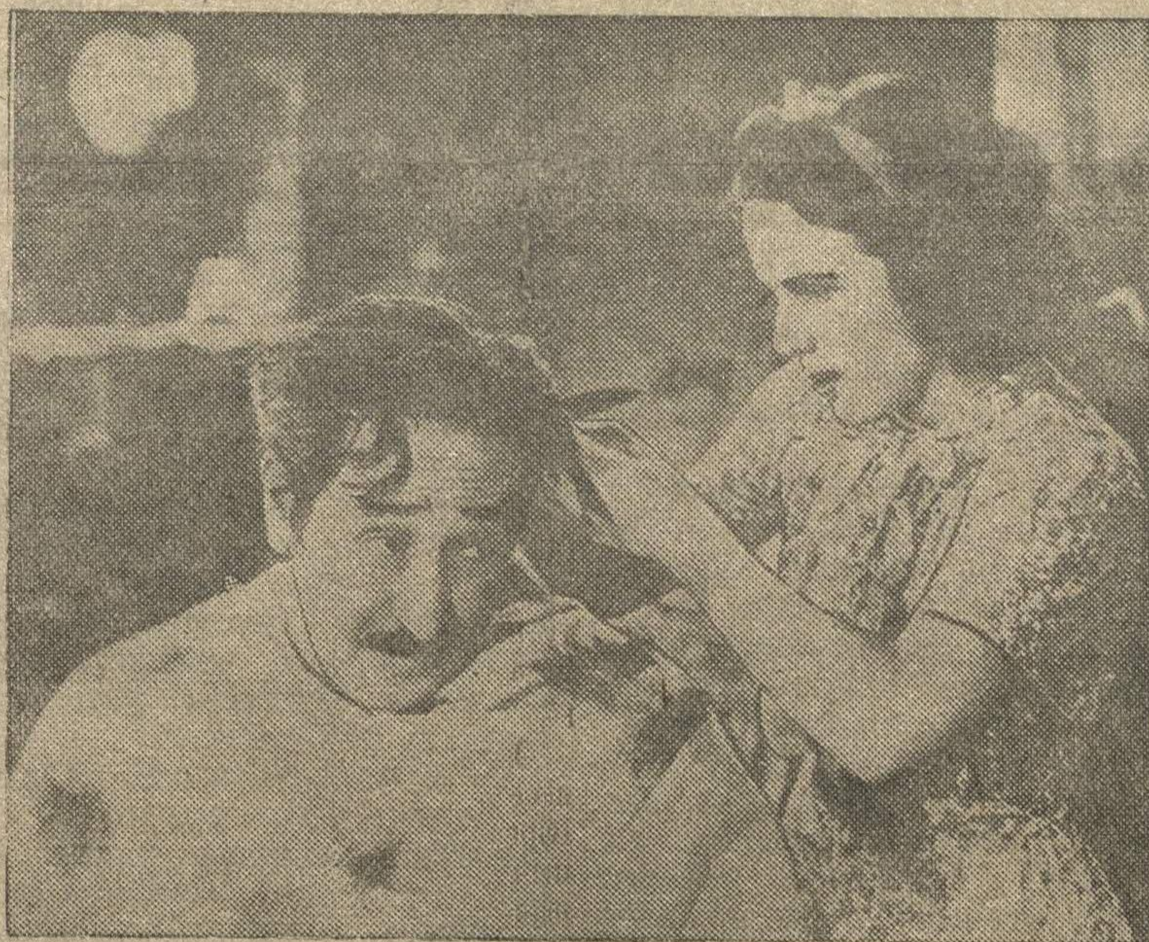
На зрнках кинотеатров гор. Горького идет новый американский художественный фильм «Сто мужчин и одна девушка». На снимке: кадр из фильма. Отец и дочь — артисты Динна Дурбин и Адольф Менну.

КАНДАЛАКША, 1 мая. (ТАСС). 30-го апреля закончено строительство железной дороги Кандалакша—Куолоярви протяжением 160 километров. Куолоярви отныне соединен с Мурманской железной дорогой.