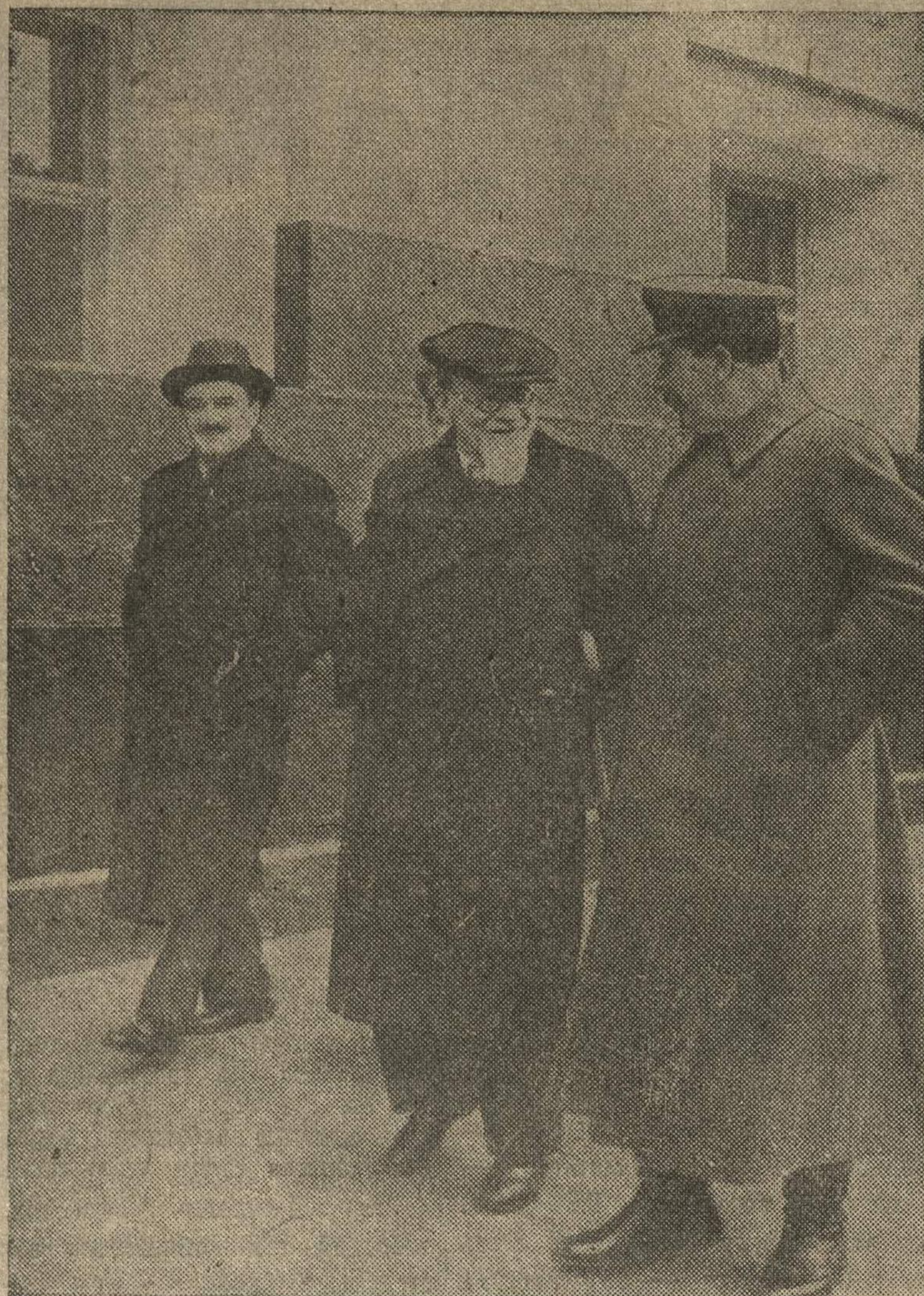
ПРАЗДНОВАНИЕ 1 МАЯ В МОСКВЕ.

Товарищи И. В. Сталин, М. И. Калинин и А. И. Микоян направляются из Кремля на Красную площадь.