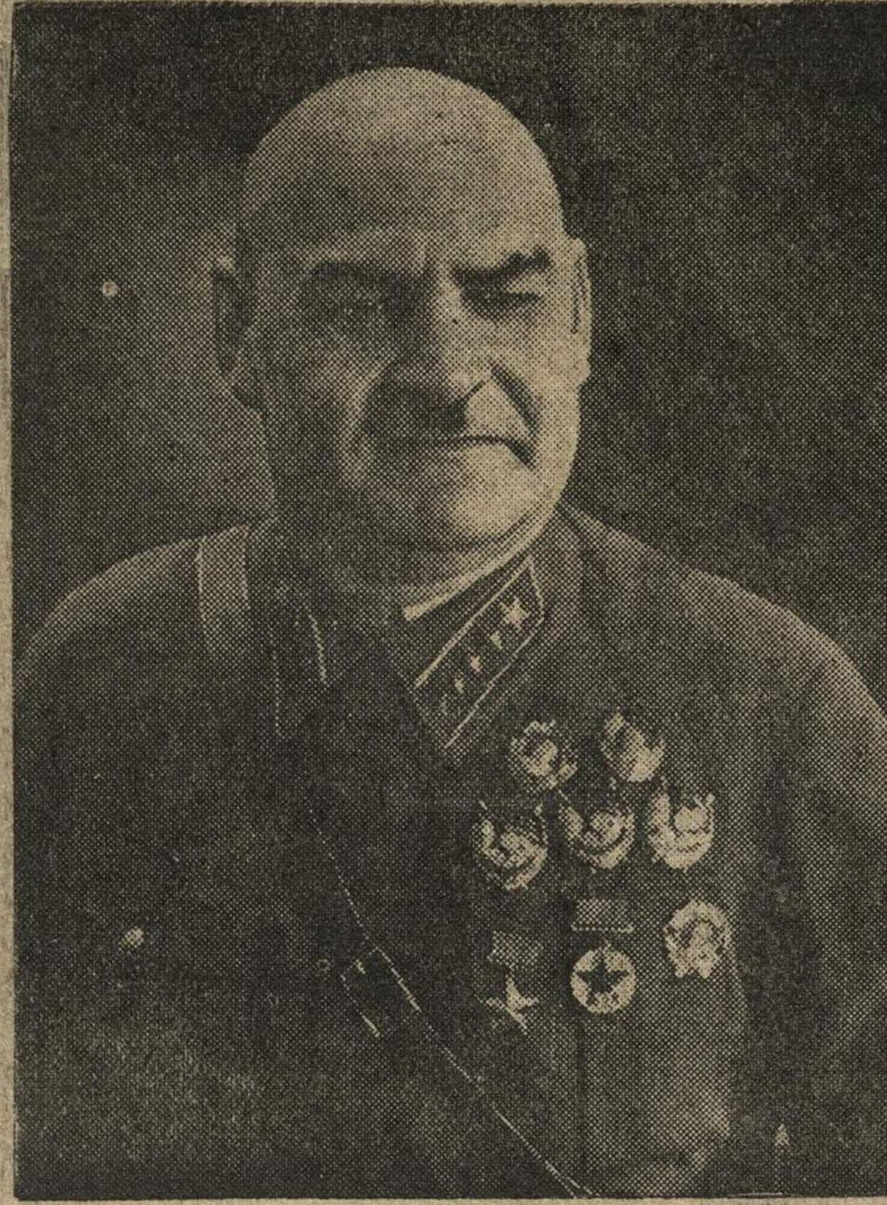
Заместитель Народного Комиссара Оборона СССР Маршал Советского Союза Г. И. Кулик.