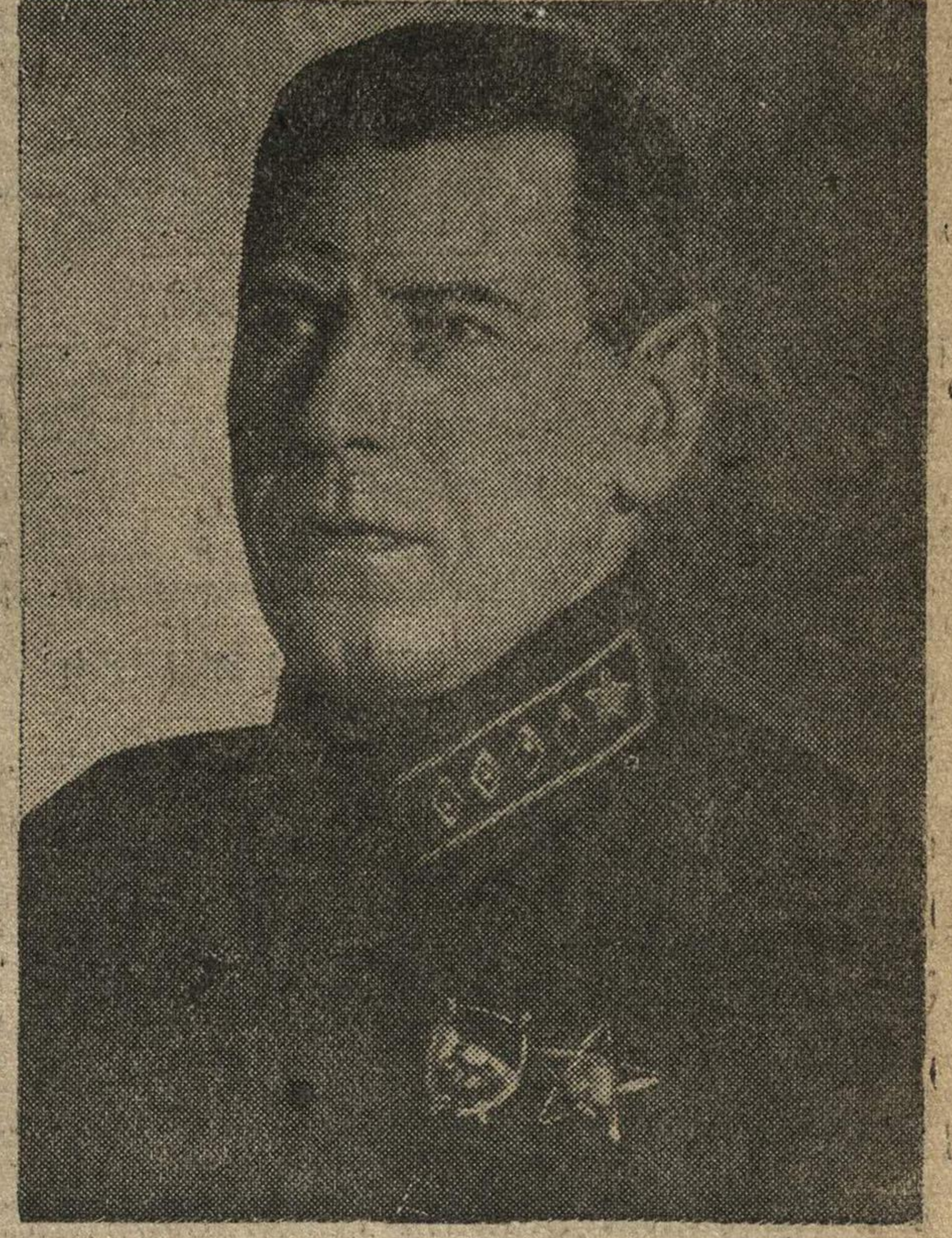
Начальник Генерального Штаба Маршал Советского Союза Б. М. Шапошников.