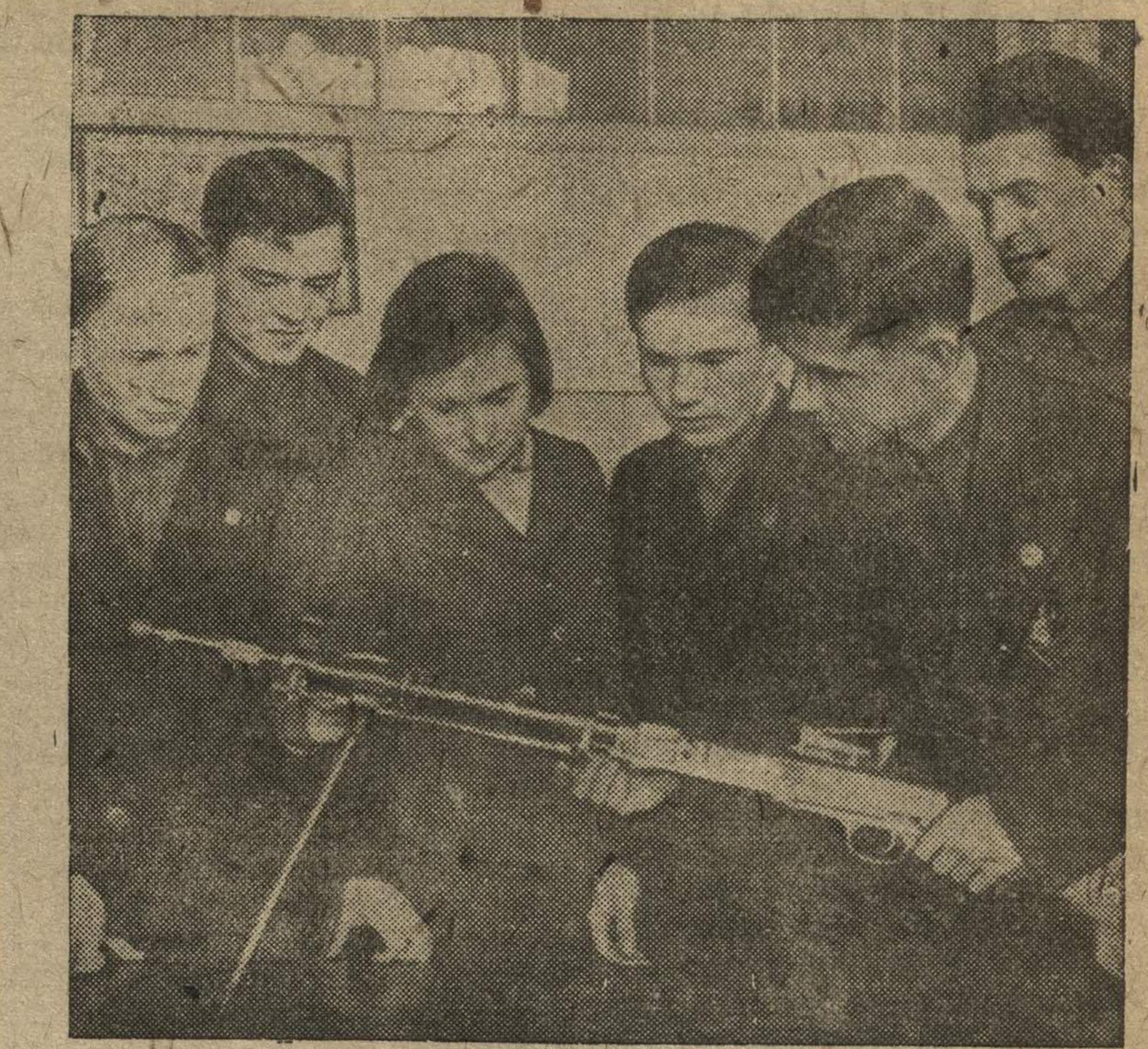
Московский институт химического машиностроения занимает одно из первых мест по оборонной работе. 1900 человек из институтского коллектива имеют значки ПВХО первой ступени, 280 — значки ПВХО второй ступени, 530 человек — воршилозные стрелки. Десятки студентов овладели искусством снайперской стрельбы. На снимке: группа студентов — активистов оборонной работы. Игнатенко. (Фотохлеще ТАСС).

Совет института утвердил кандидатами на получение Сталинских стипендий следующих товарищей: