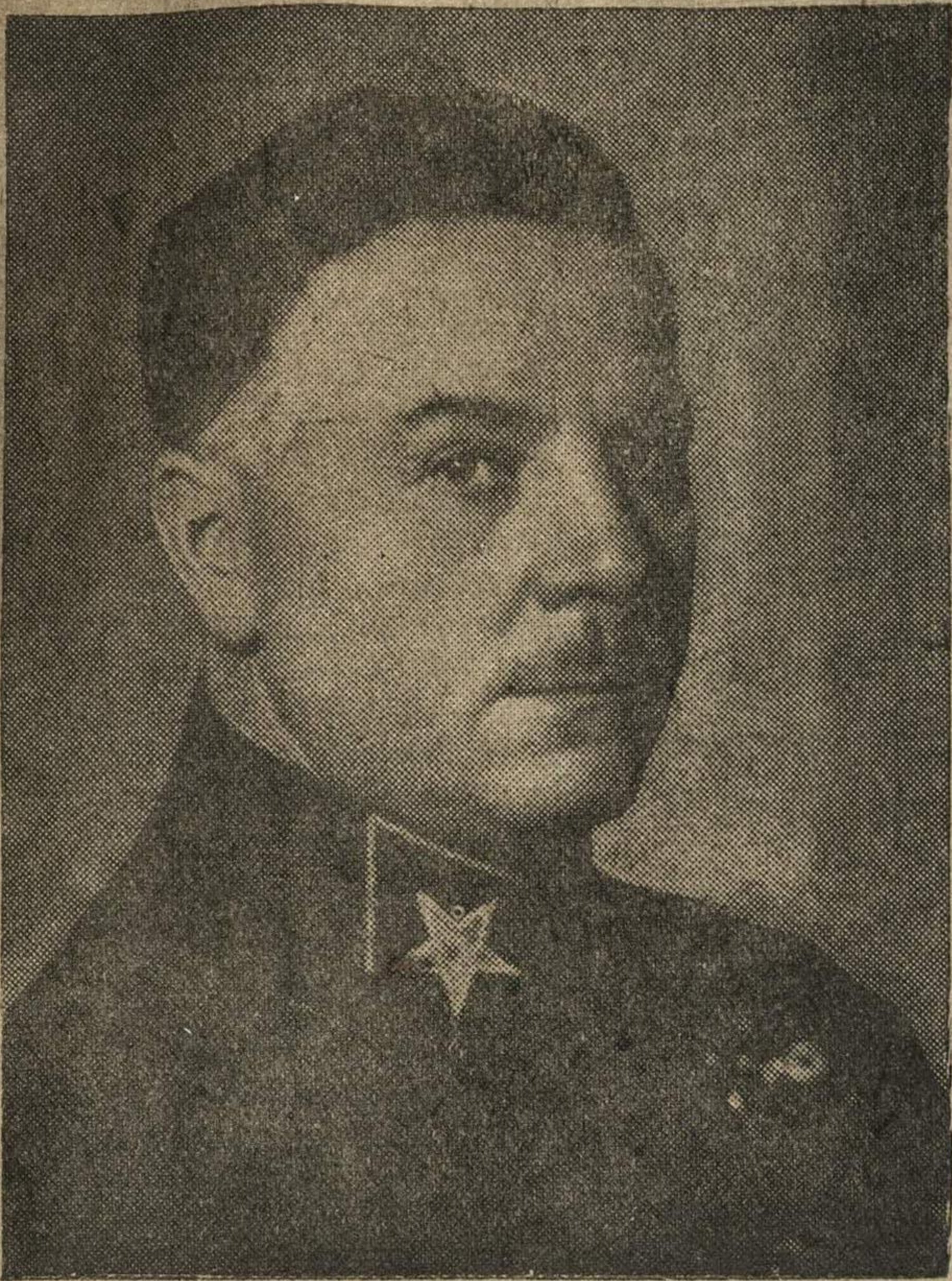
Заместитель Председателя СНК СССР и Председатель Комитета Оборона при СНК СССР Маршал Советского Союза Н. Е. Ворошилов.