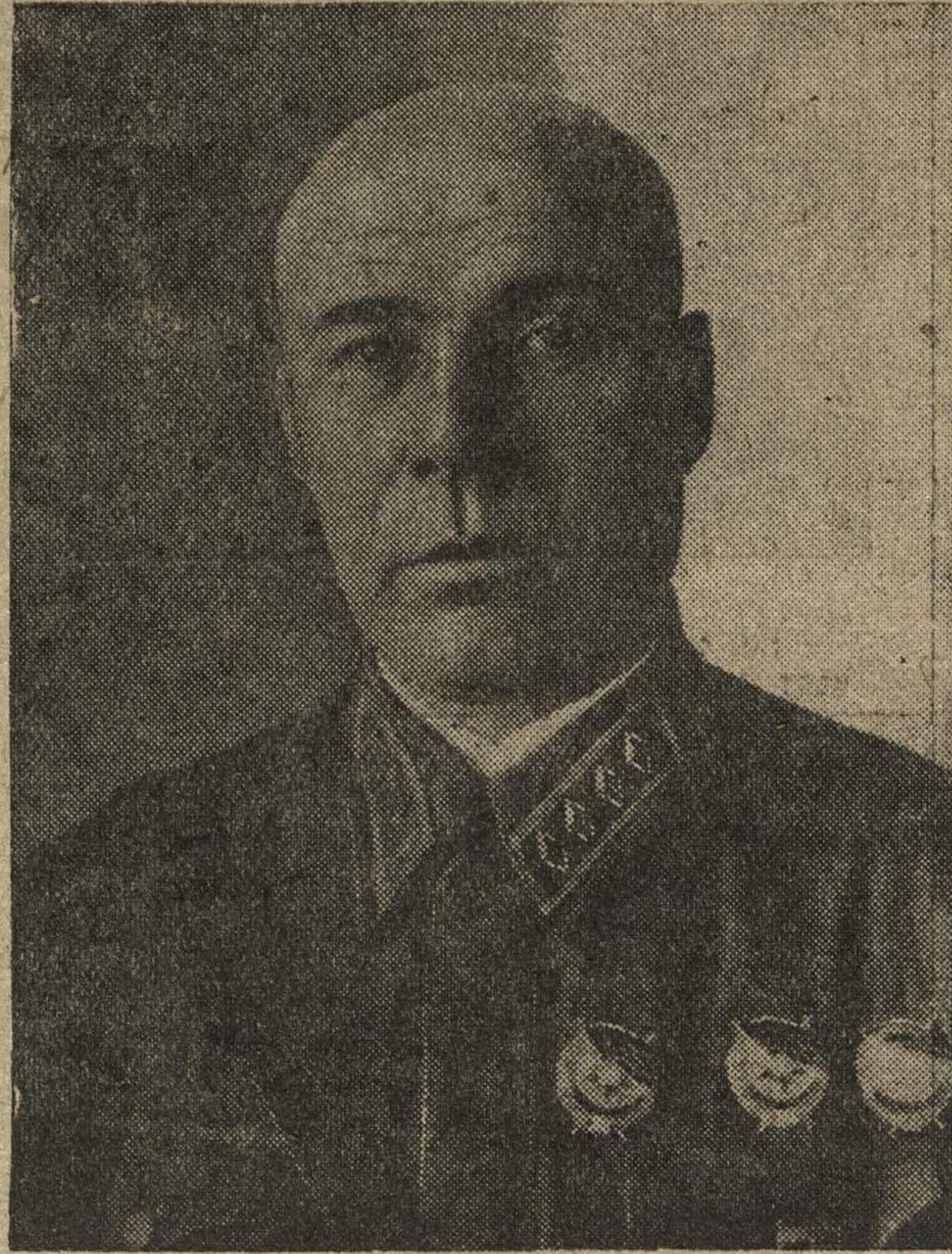
Народный Комиссар Оборона СССР Маршал Советского Союза С. К. Тимошенко.