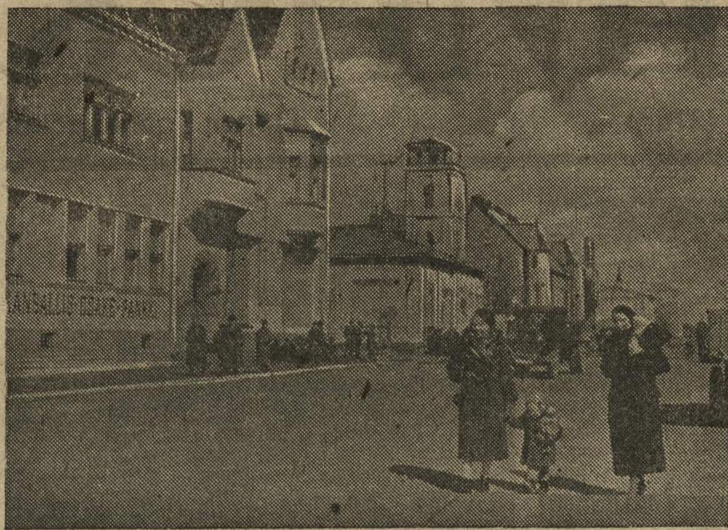
На снимке: на Карельской улице в городе Сортавала (Карело-Финская ССР).