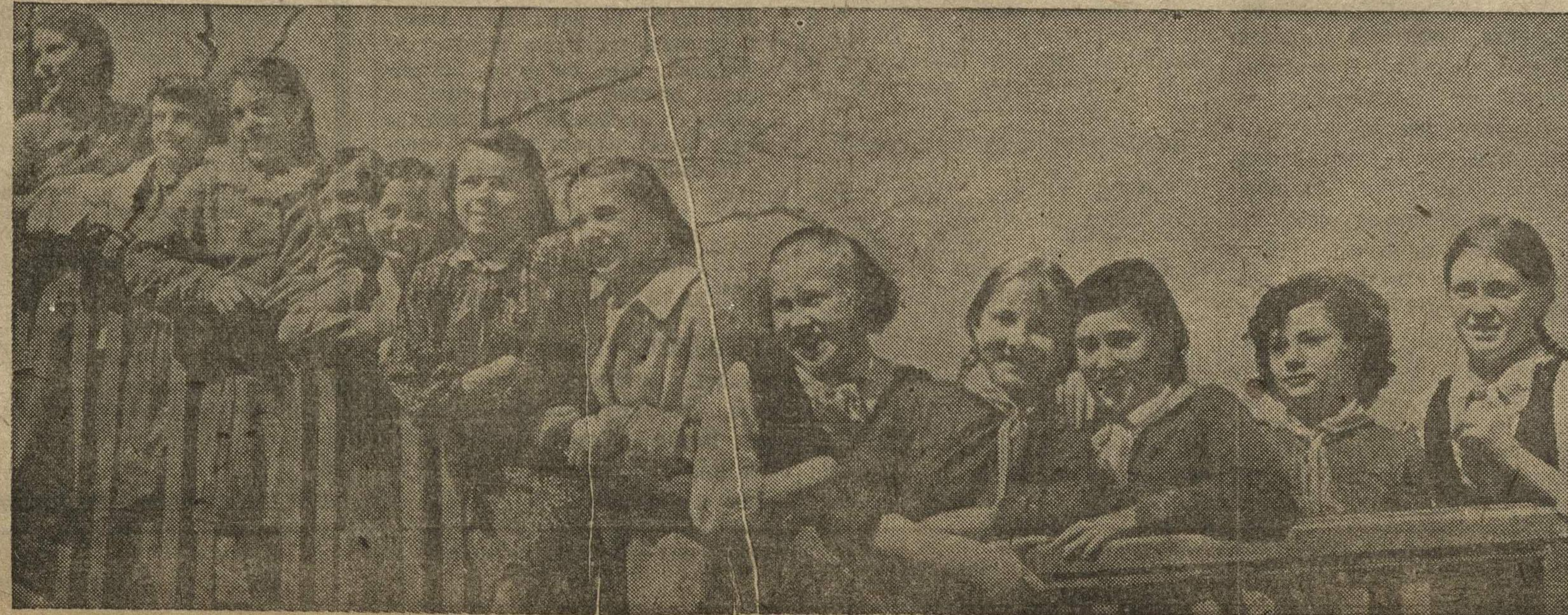
НА ВОЛЖСКОМ ОТКОСЕ.