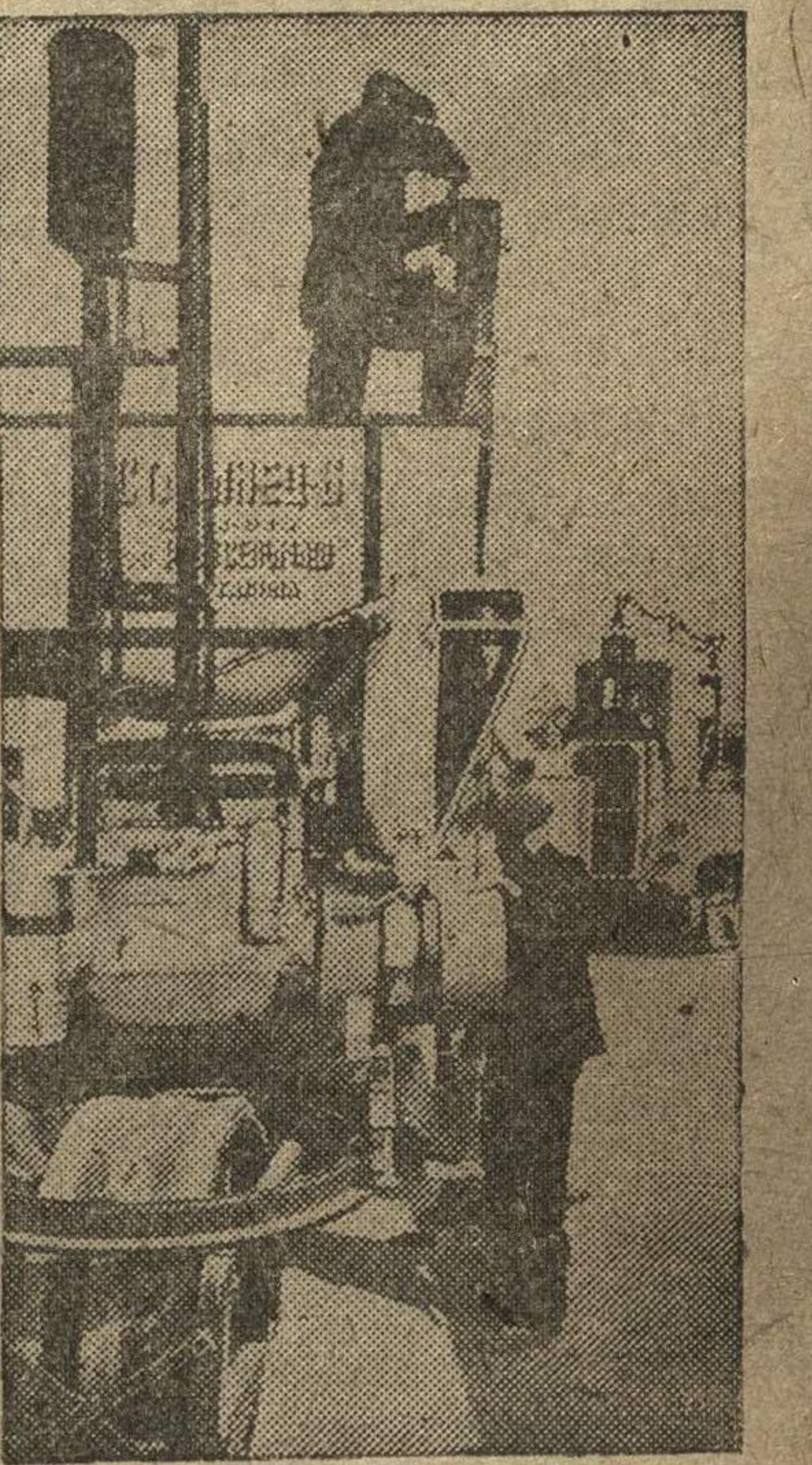
Всесоюзная сельскохозяйственная выставка. На снимке: сборка усовершенствованного комбайна «Ст-6» («Сталин-6») завода «Ростсельмаш» имени Сталина (Ростов-на-Дону).

♦ Значительно увеличился, по сравнению с прошлым годом, животный мир на выставке. В коровниках, конюшнях, свинарниках, овчарнях, в крольчатниках и птичниках, в вольерах и на выгулах демонстрируется 2.500 голов выдающихся сельскохозяйственных животных и почти столько же голов птицы.