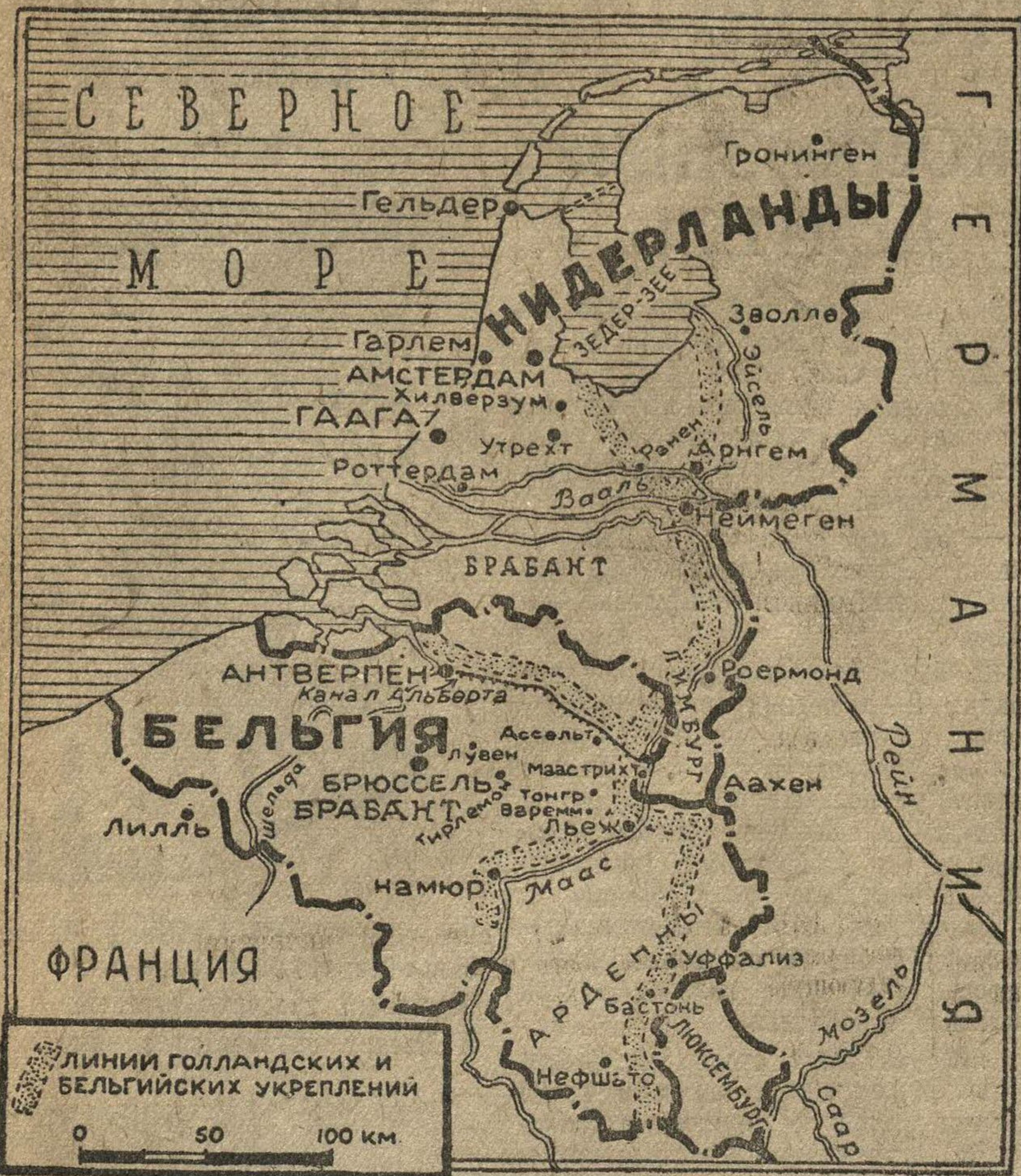
Сводка верховного командования германской армии