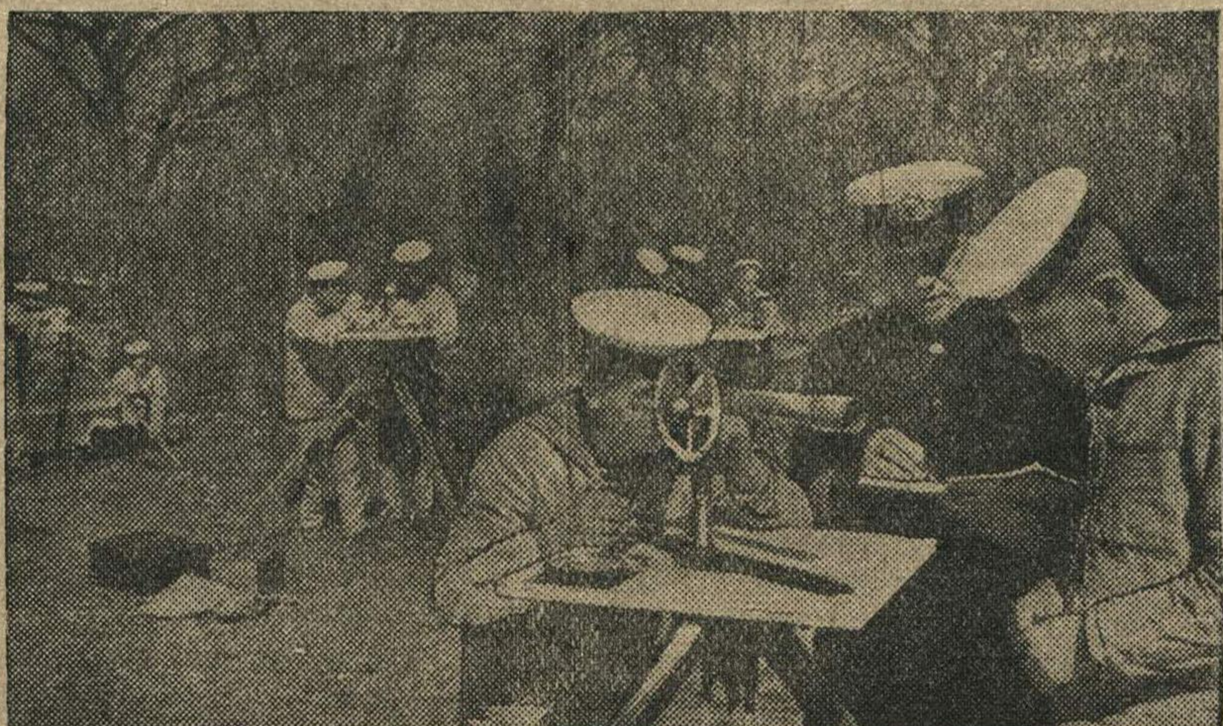
Курсанты Ленинградского высшего военно-морского гидрографического училища имени Серго Орджоникидзе на практических занятиях по телеграфии.