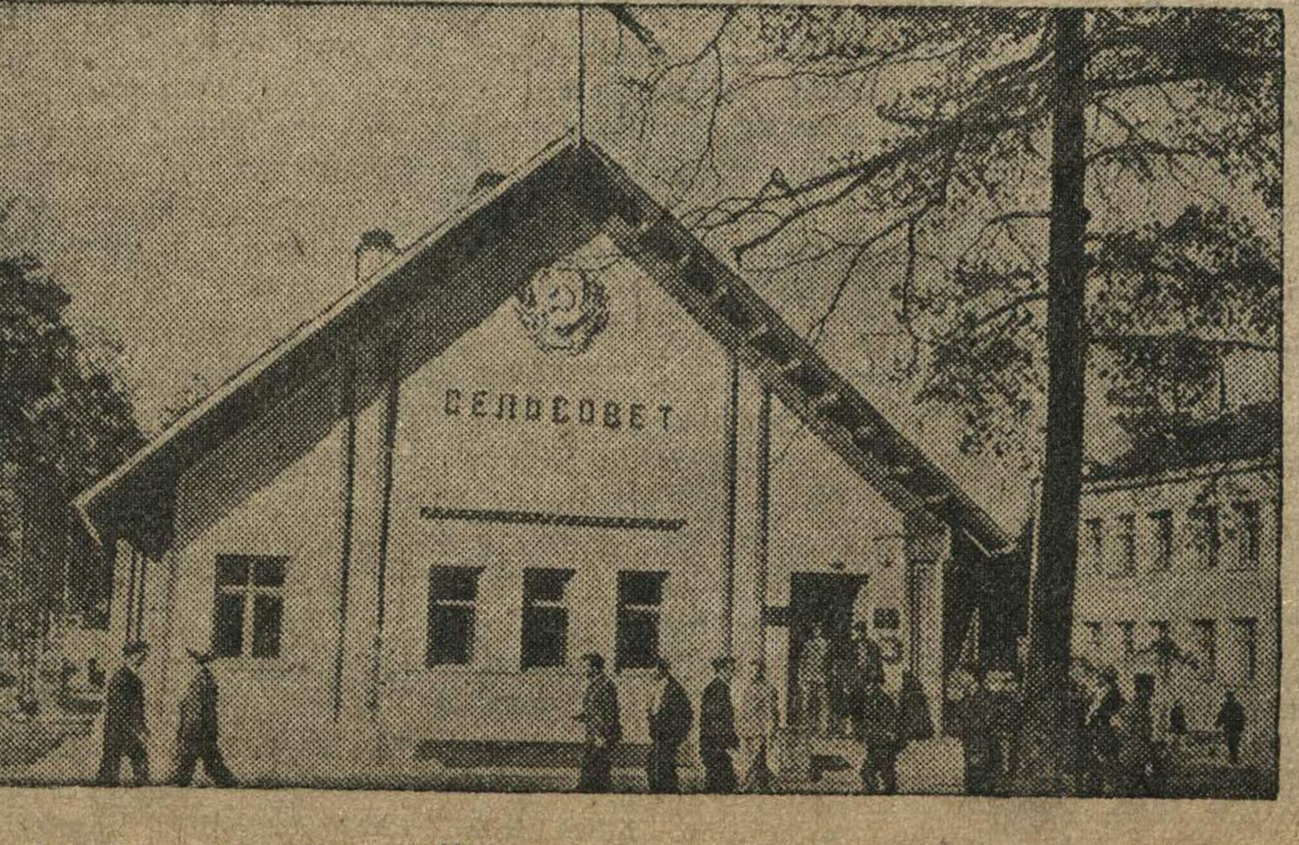
На снимках: слева — павильон «Сибирь», справа — сельсовет в разделе выставки «Новое в дарении».