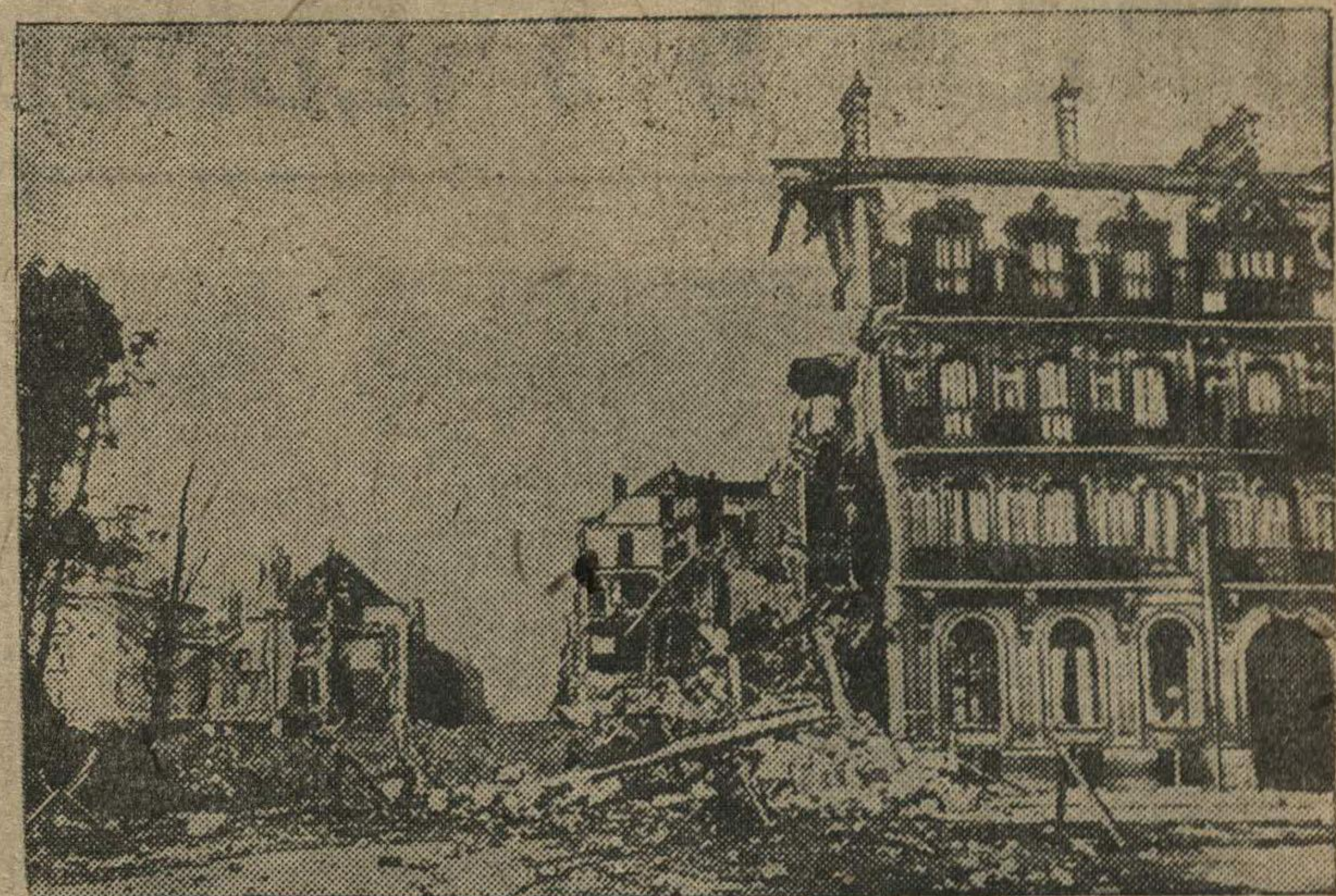
Разрушения, вызванные в Седане артиллерийским огнем.