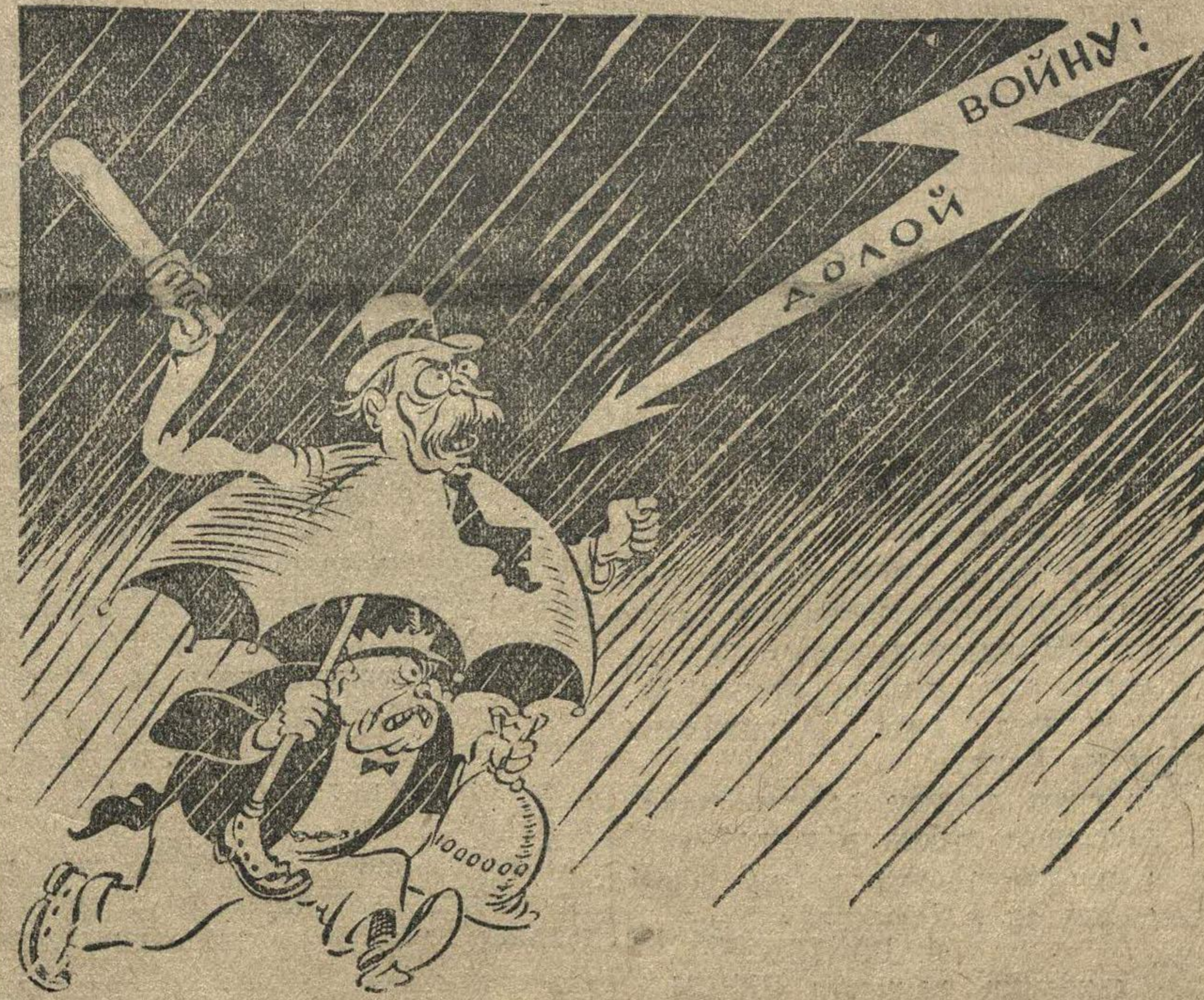
НЕ СПРЯТАТЬСЯ. Рис. П. Головина.