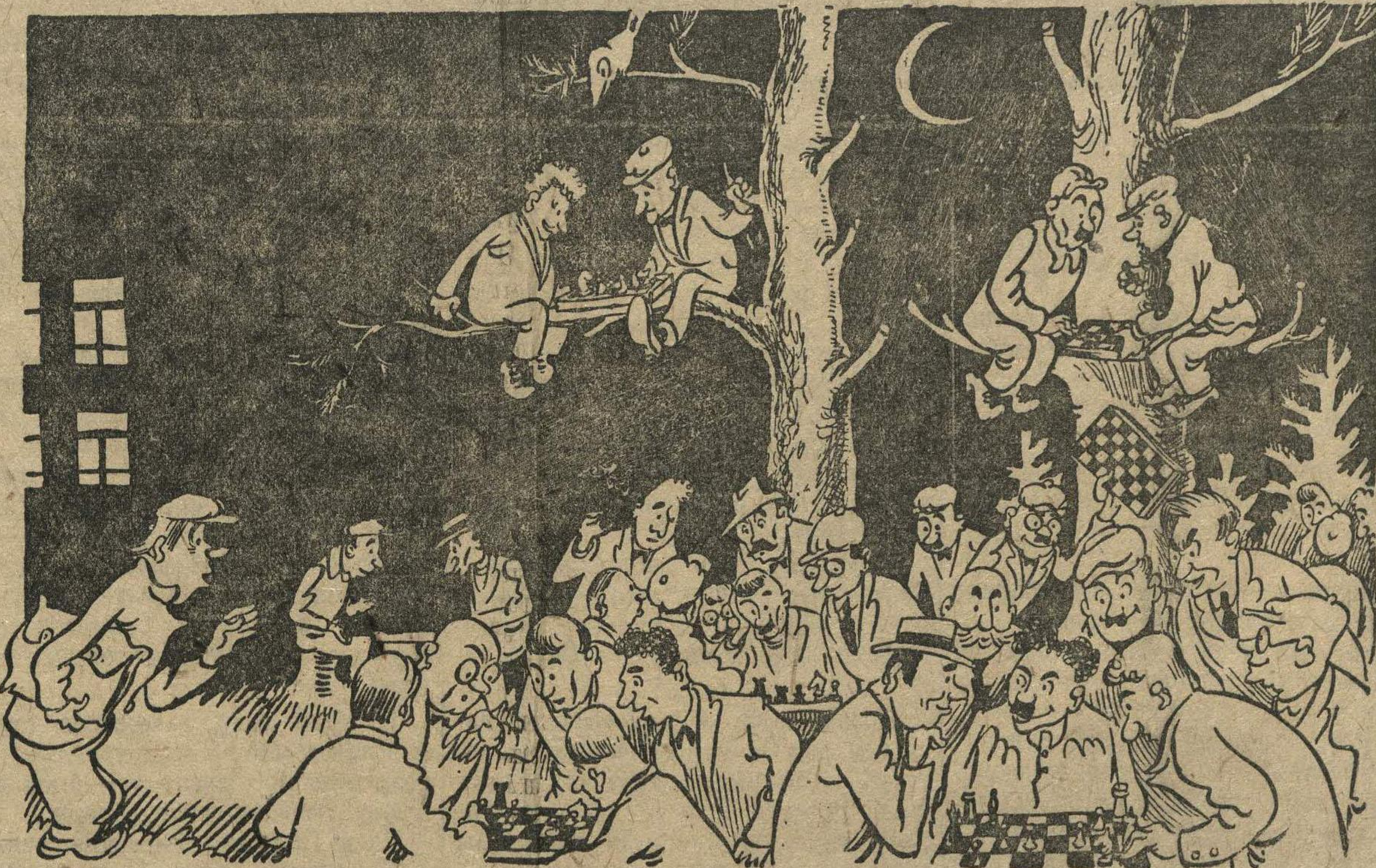
дядя из городского комитета по делам физкультуры и спорта (слева): — Что за наводнение, в жизни не видал такого количества шашкистов и шахматистов. Рис. Н. Головина.

Для участников совещания были прочитаны лекции на тему: «Марксизм-ленинизм о религии и путях ее преодоления» и о международном положении.