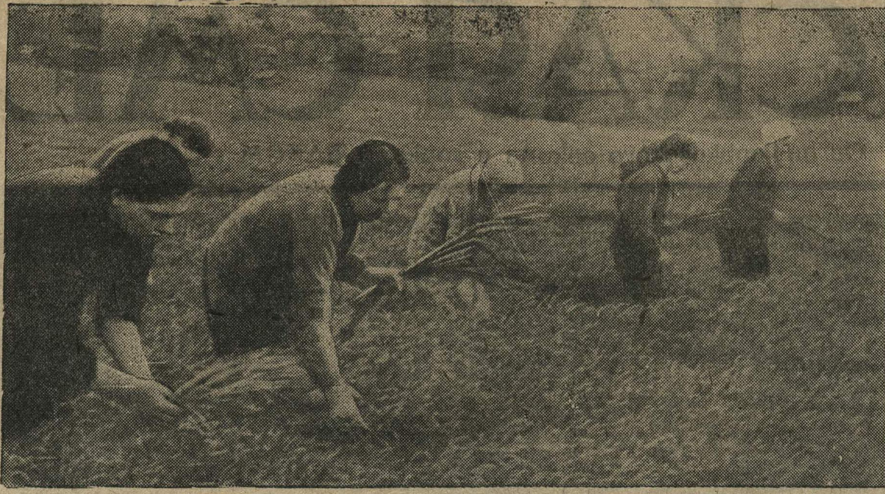
Ефремовское звено т. Вязанкиной колхоза «Заря» Работинского района на сортовой прополке яровой пшеницы.

М. БУДЕВ, заведующий молочнотоварной фермой колхоза.