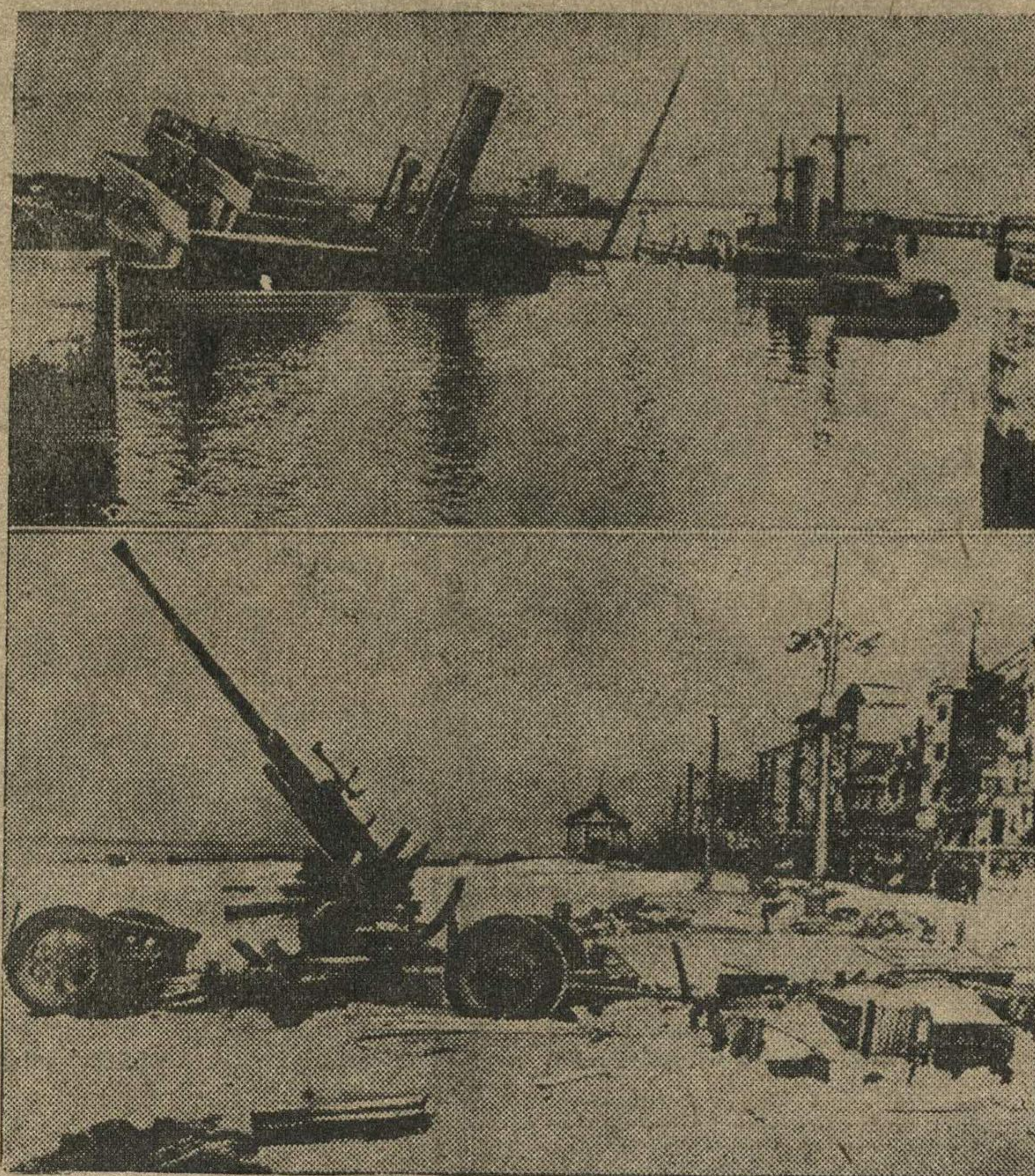
На снимках: сверху — потопленные военные суда у шлюзов в гавани Зебрюгге (Бельгия). Внизу — зенитные орудия, покинутые во время отступления союзных войск на побережье Ла-Манш.

Статья 5-я. В качестве гарантии Германия может потребовать сдачи в хорошем состоянии всей артиллерии, танков, противотанкового оружия, военных самолетов, вооружения пехоты, тракторов и боеприпасов, находящихся на территории, не подлежащей оккупации. Германия определит, в каком размере эти во-