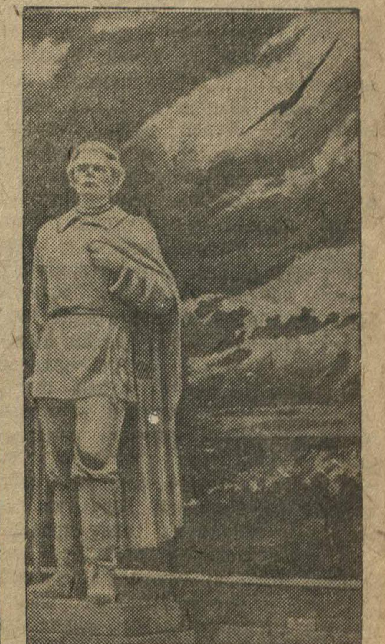
Всесоюзная сельскохозяйственная выставка. На снимке: скульптура Максима Горького в зале Горьковской об-ласти.

Комсомольская организация завода «Красная Этна» взяла шефство над строительством этой школы.