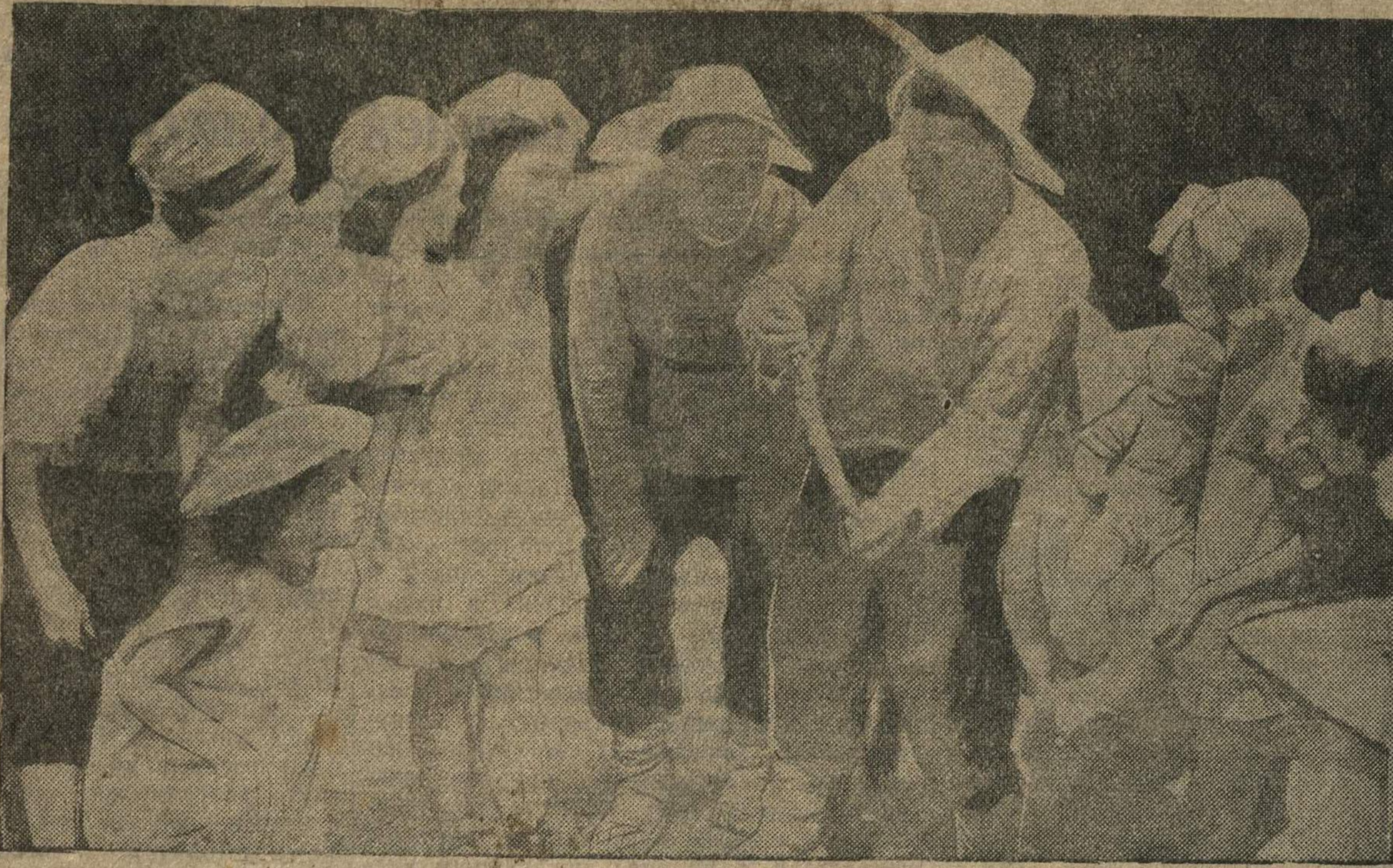
Областной смотр детской художественной самодеятельности. На снимке: сцена «В лесу» в исполнении балетного коллектива Правдинского детского дома культуры.