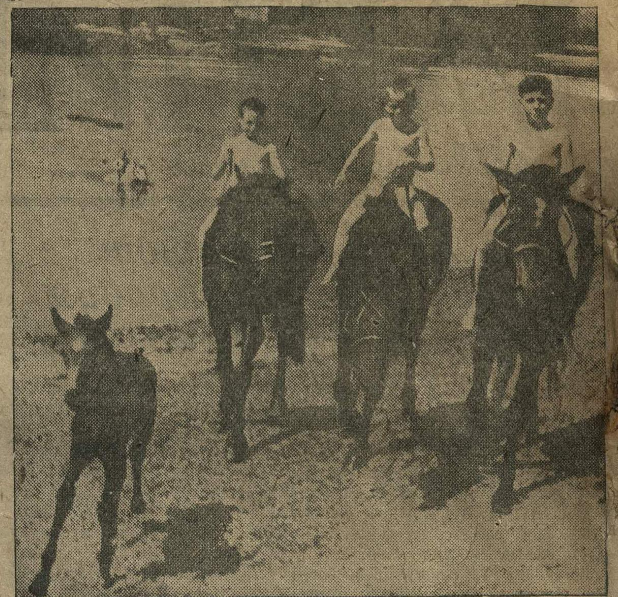
После куланья лошадей.