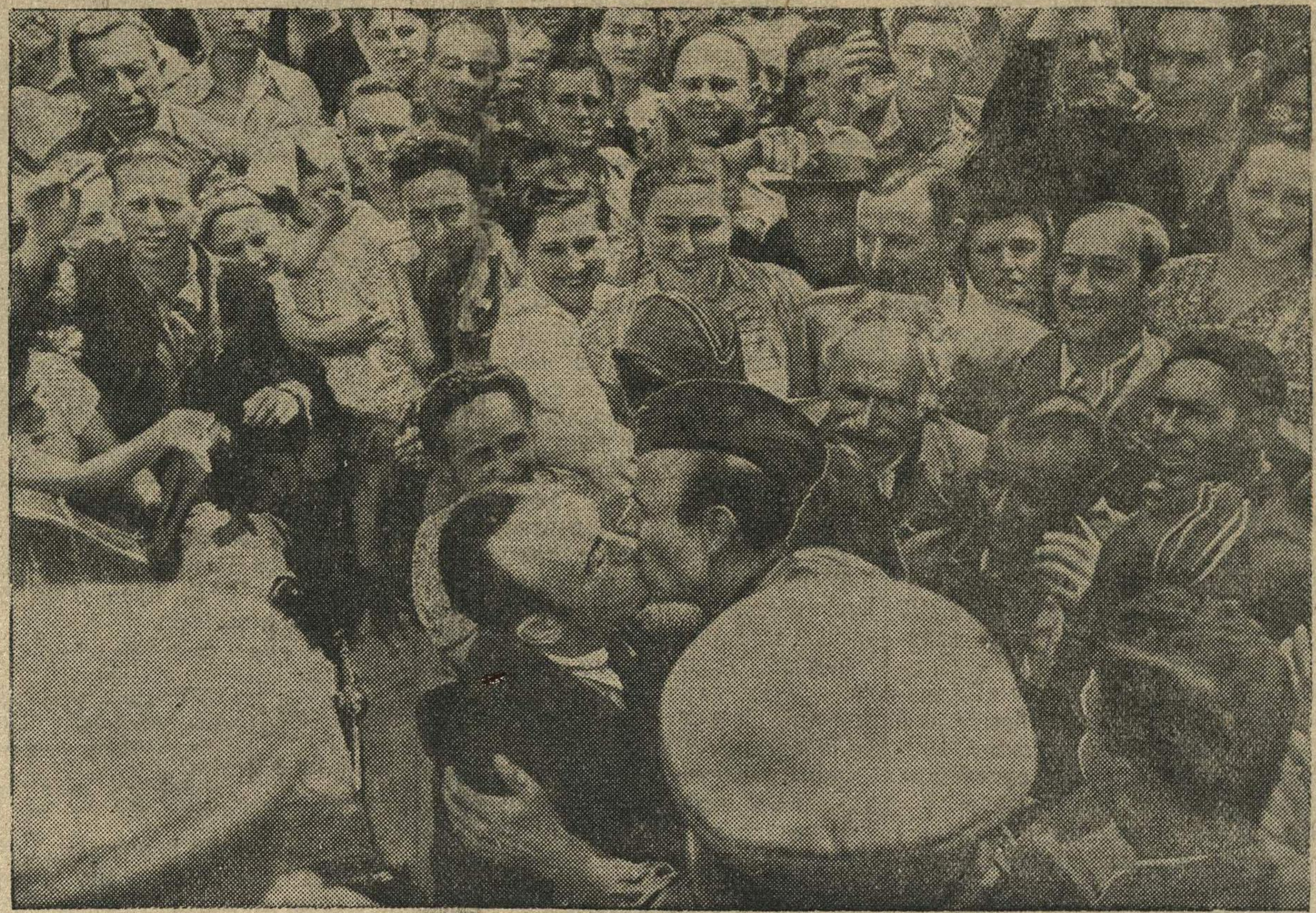
Встреча частей Красной Армии населением Кишинева (Бессарабия).