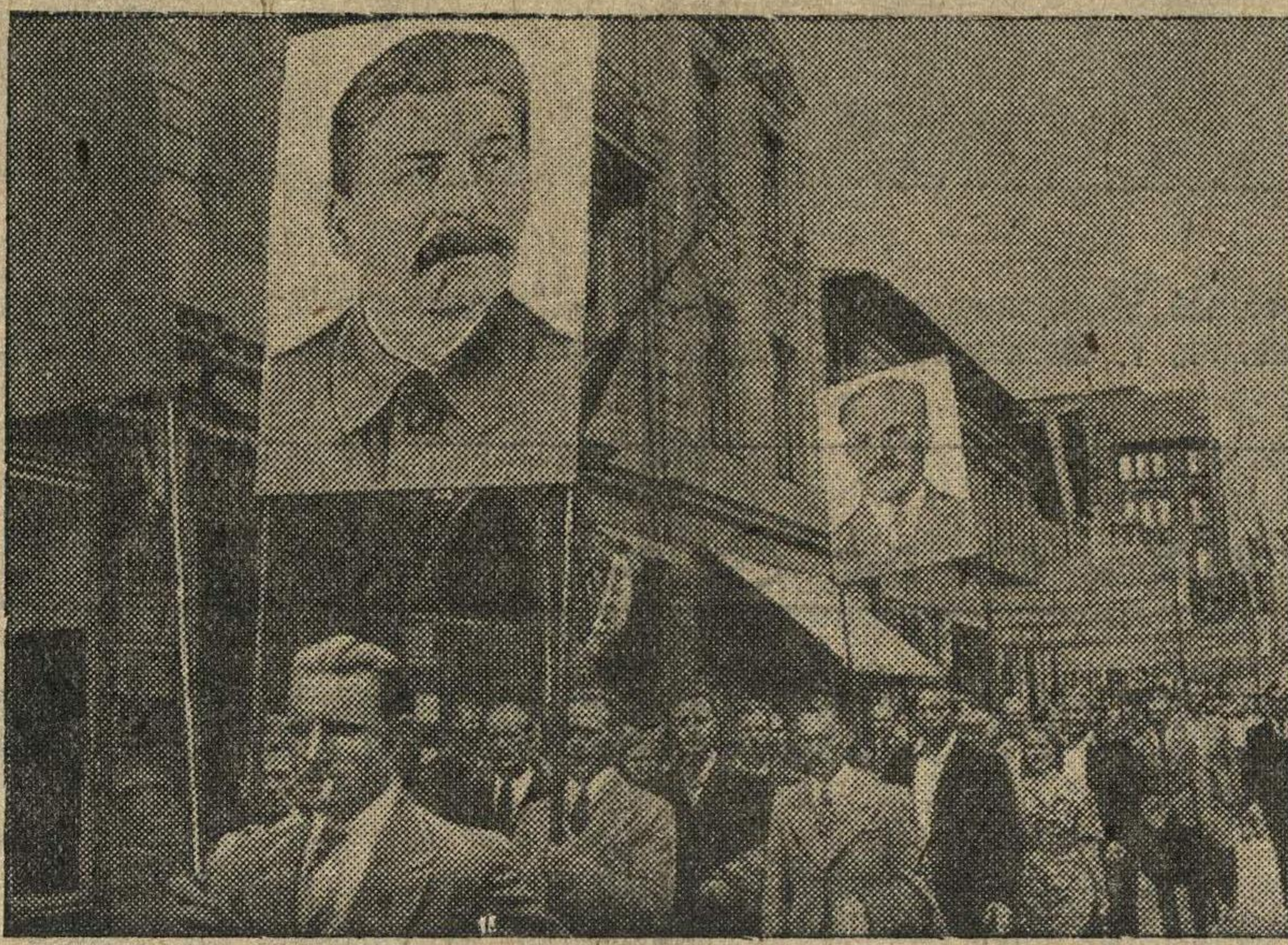
Население Риги направляется к избирательным участкам.