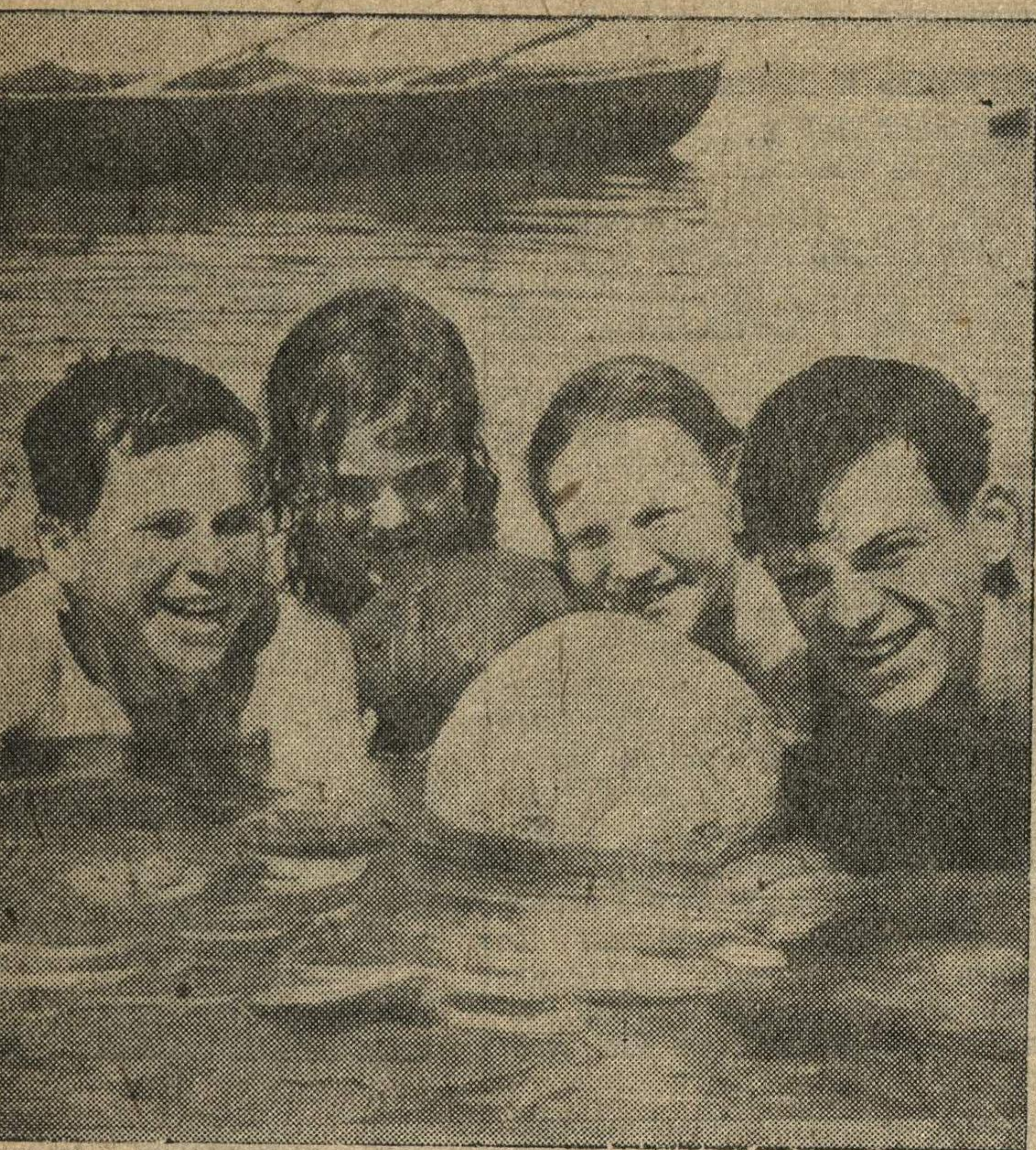
На реке.