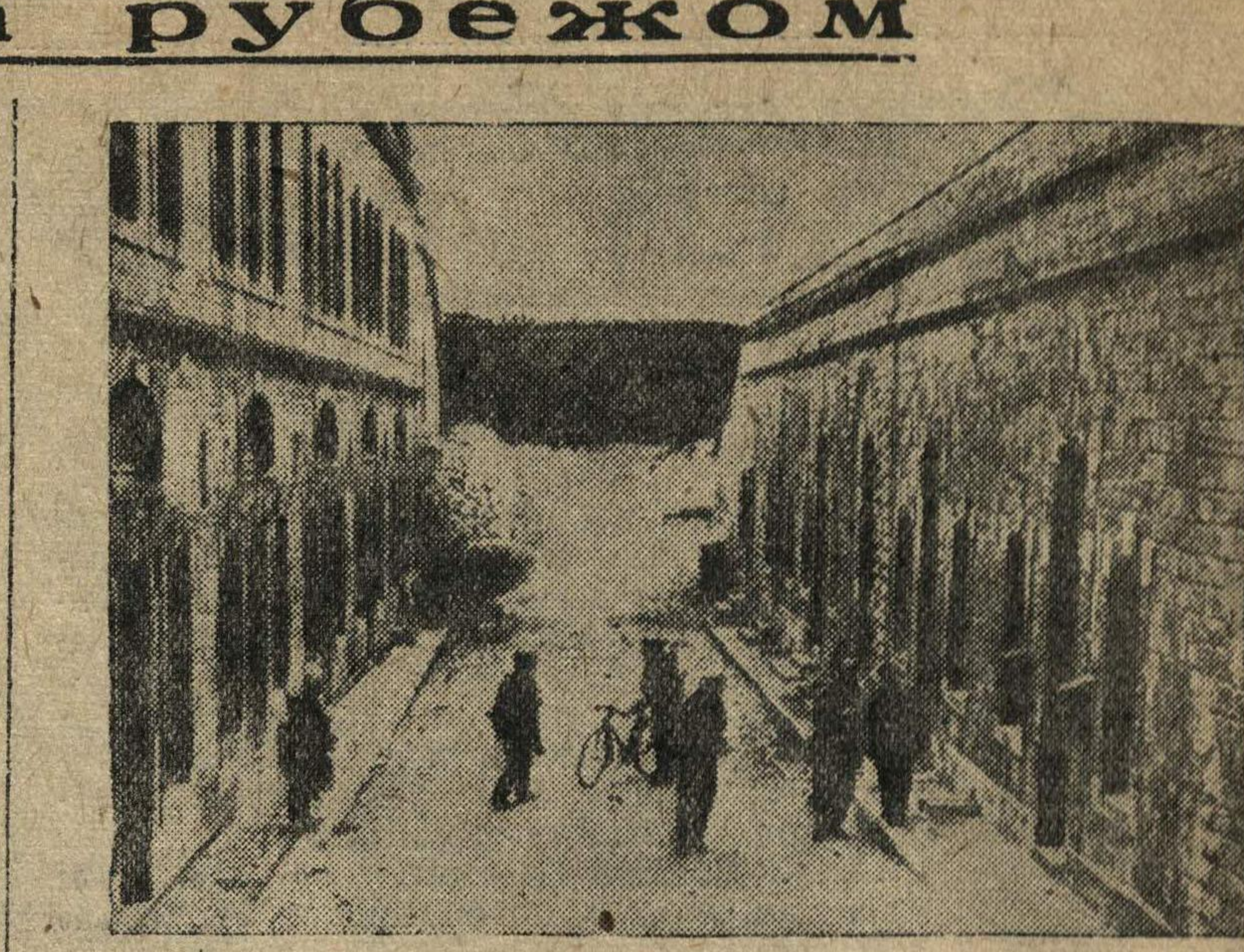
В французской крепости Верден.