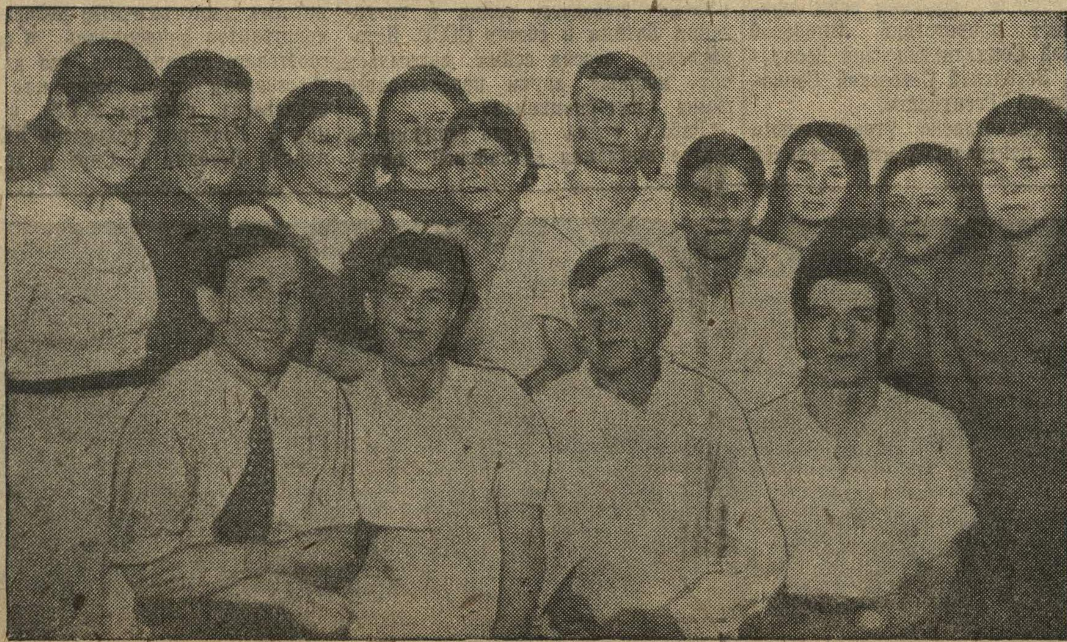
Члены постоянных комиссий Ждановского райкома ВЛКСМ, участники совещания при редакции газеты «Ленинская смена».

Комиссия занимается подготовкой общежитий студентов к новому учебному году, хотим, чтобы в общежитиях было культурно, уютно.