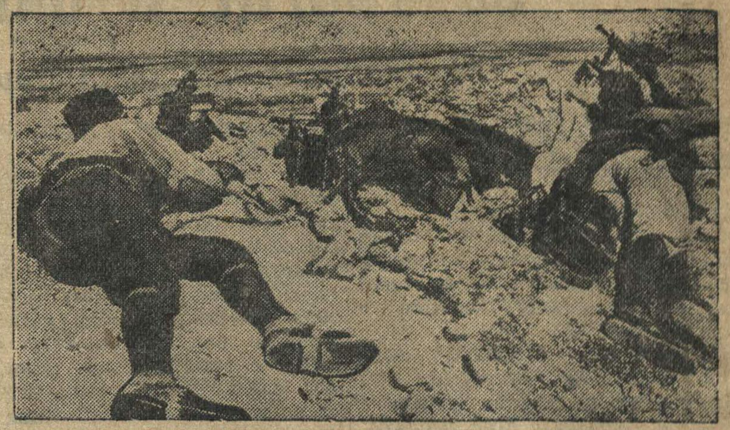
Итальянские пулеметчики на фронте в Ливии.