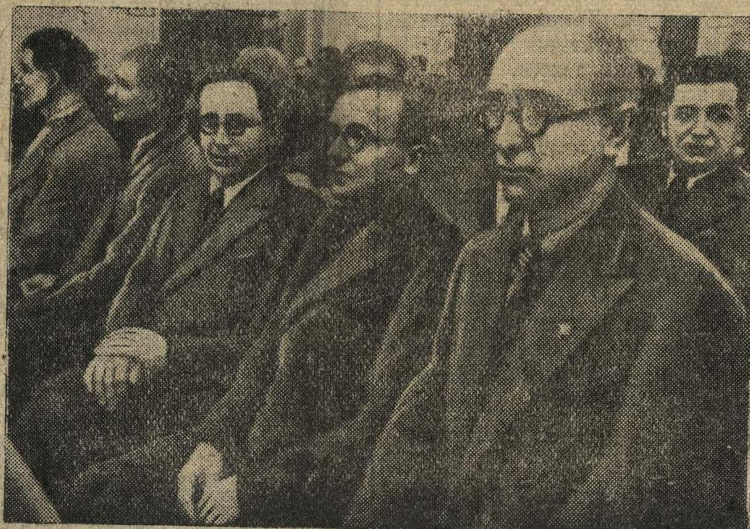
Делегация эстонского народа в зале заседаний.