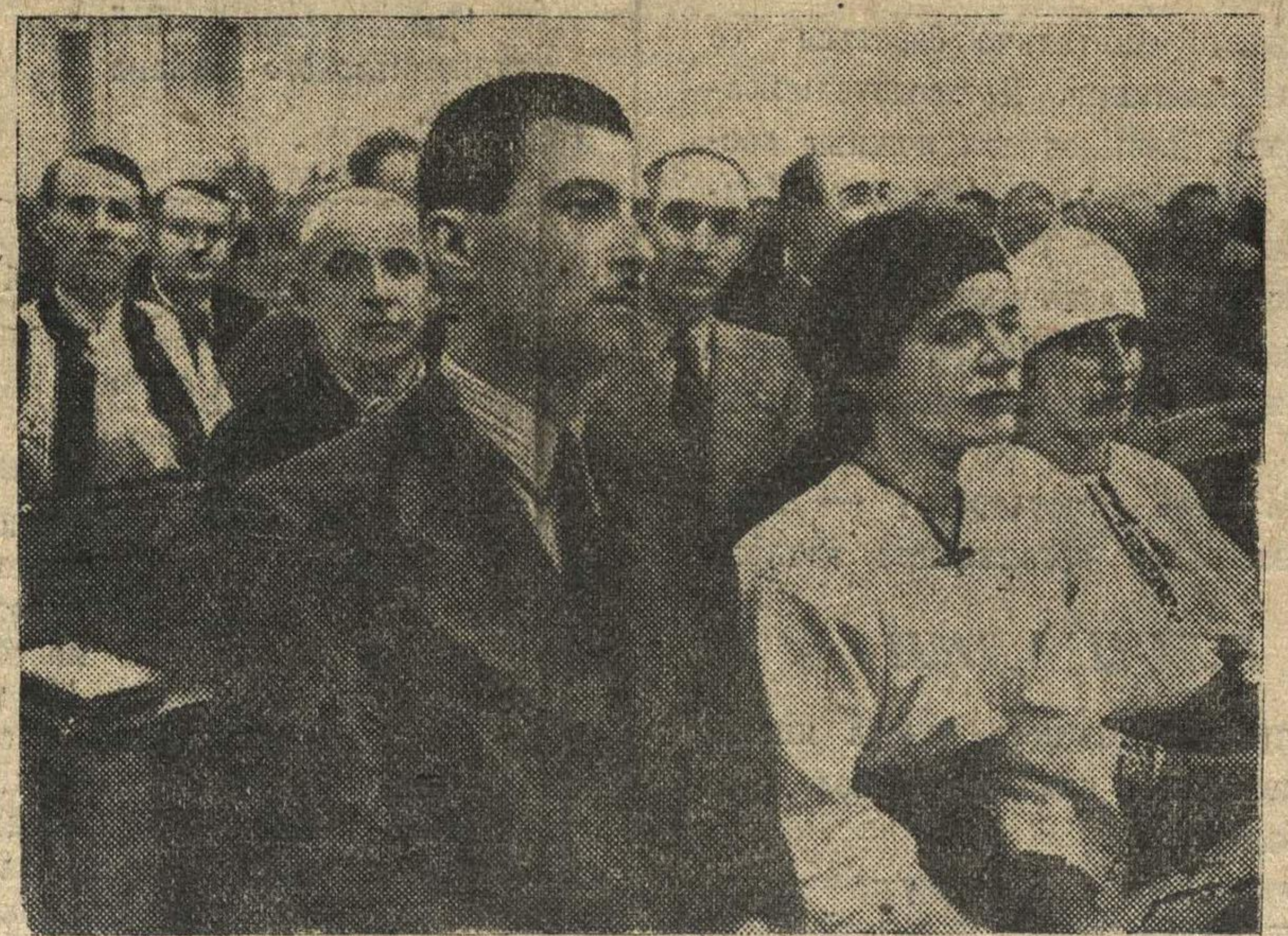
Делегация Бессарабии и Северной Буковины.