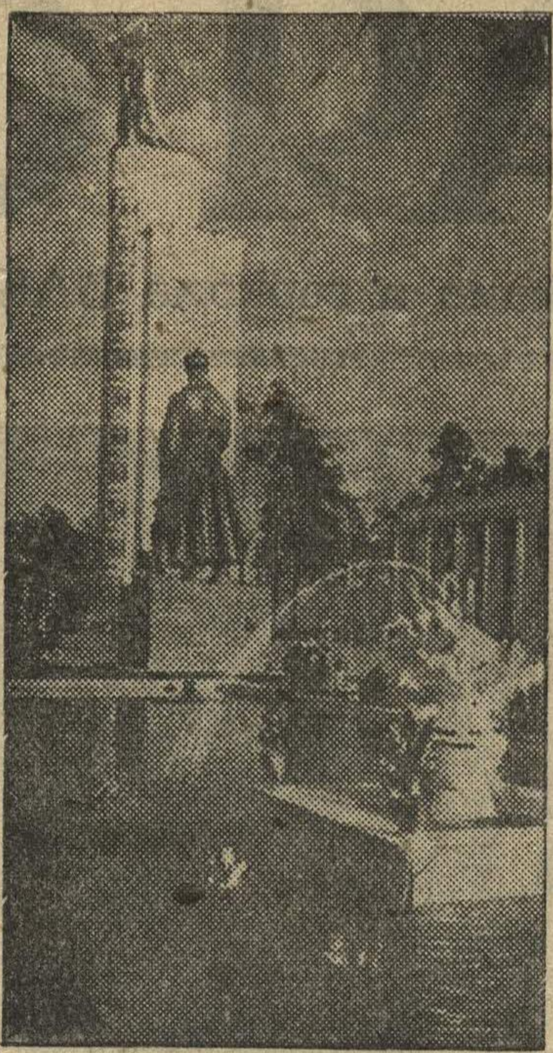
На Всесоюзной сельскохозяйственной выставке. У павильона «Дальний Восток».