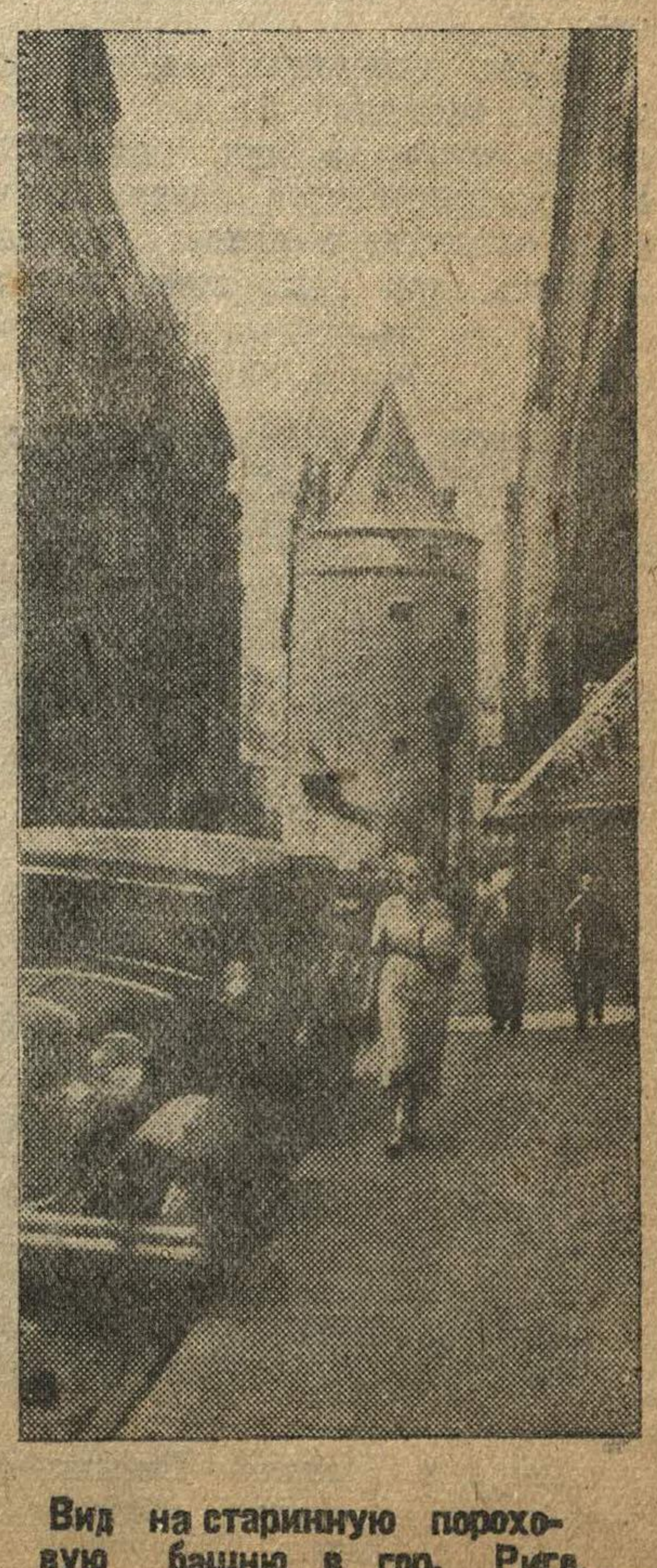
Вид на старинную пороховую башню в гор. Риге.