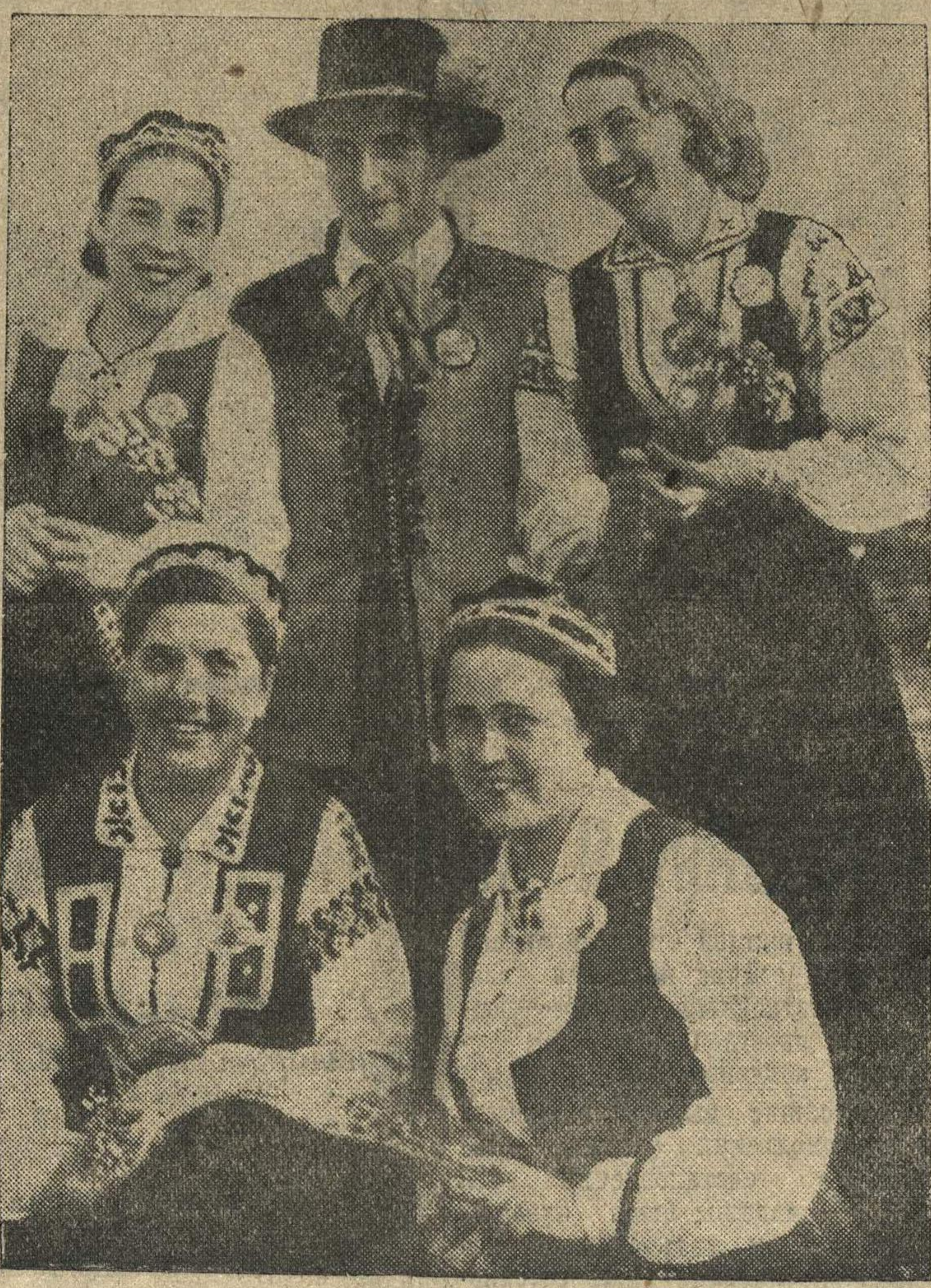
Латвийская молодежь в национальных костюмах.