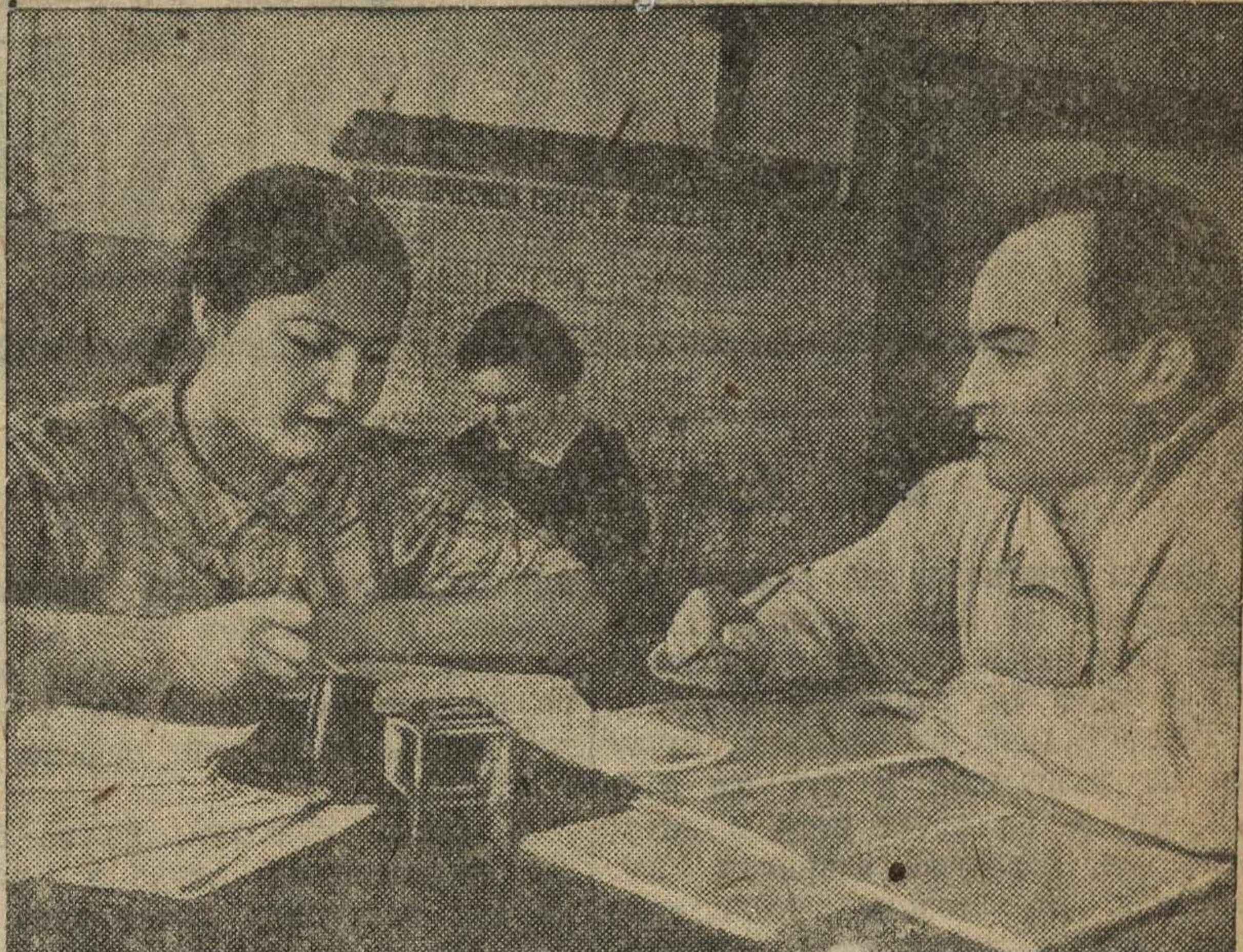
На приемных испытаниях по химии в Горьковском медицинском институте.