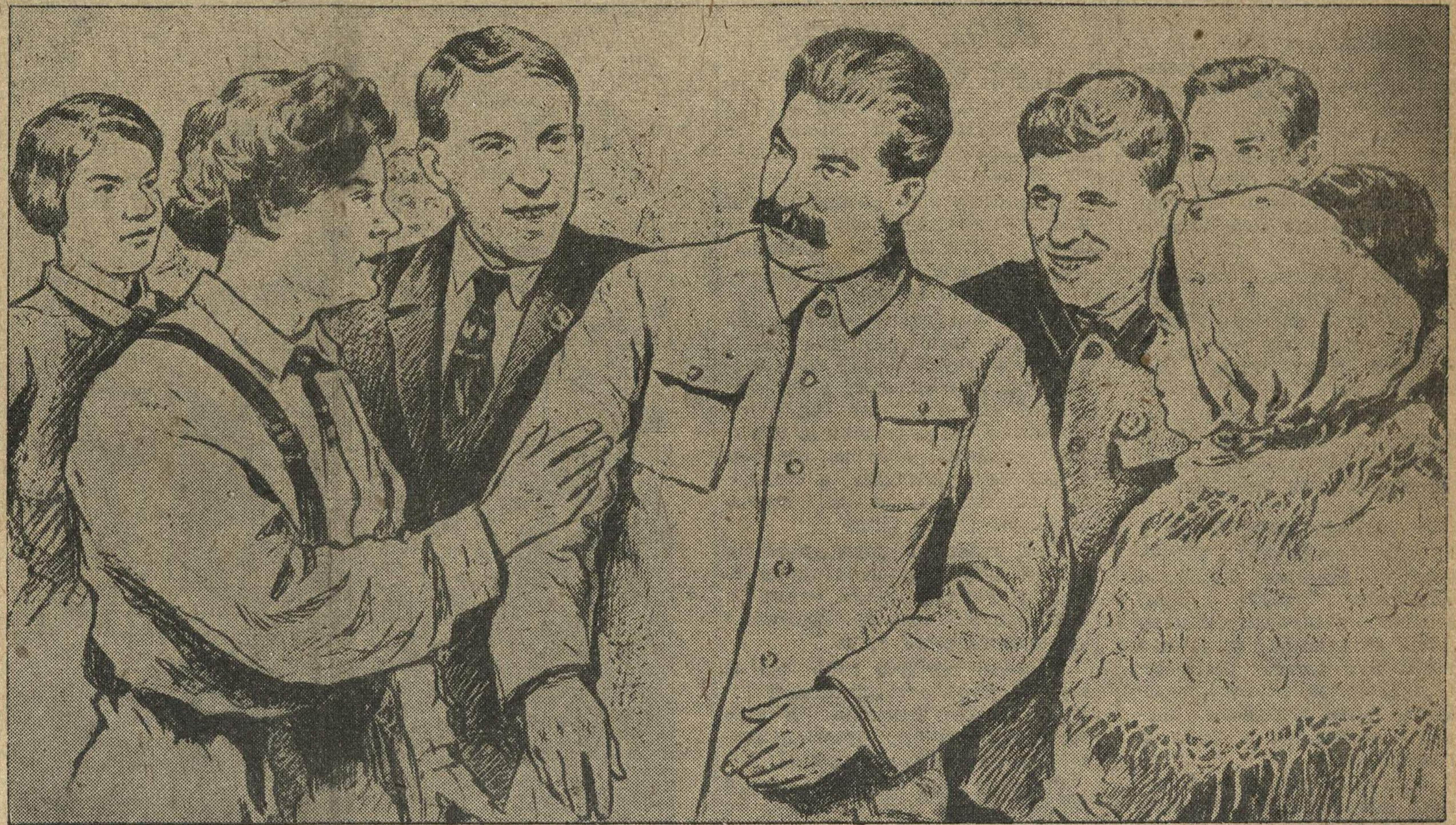
ТОВАРИЩ СТАЛИН СРЕДИ СТАХАНОВЦЕВ.