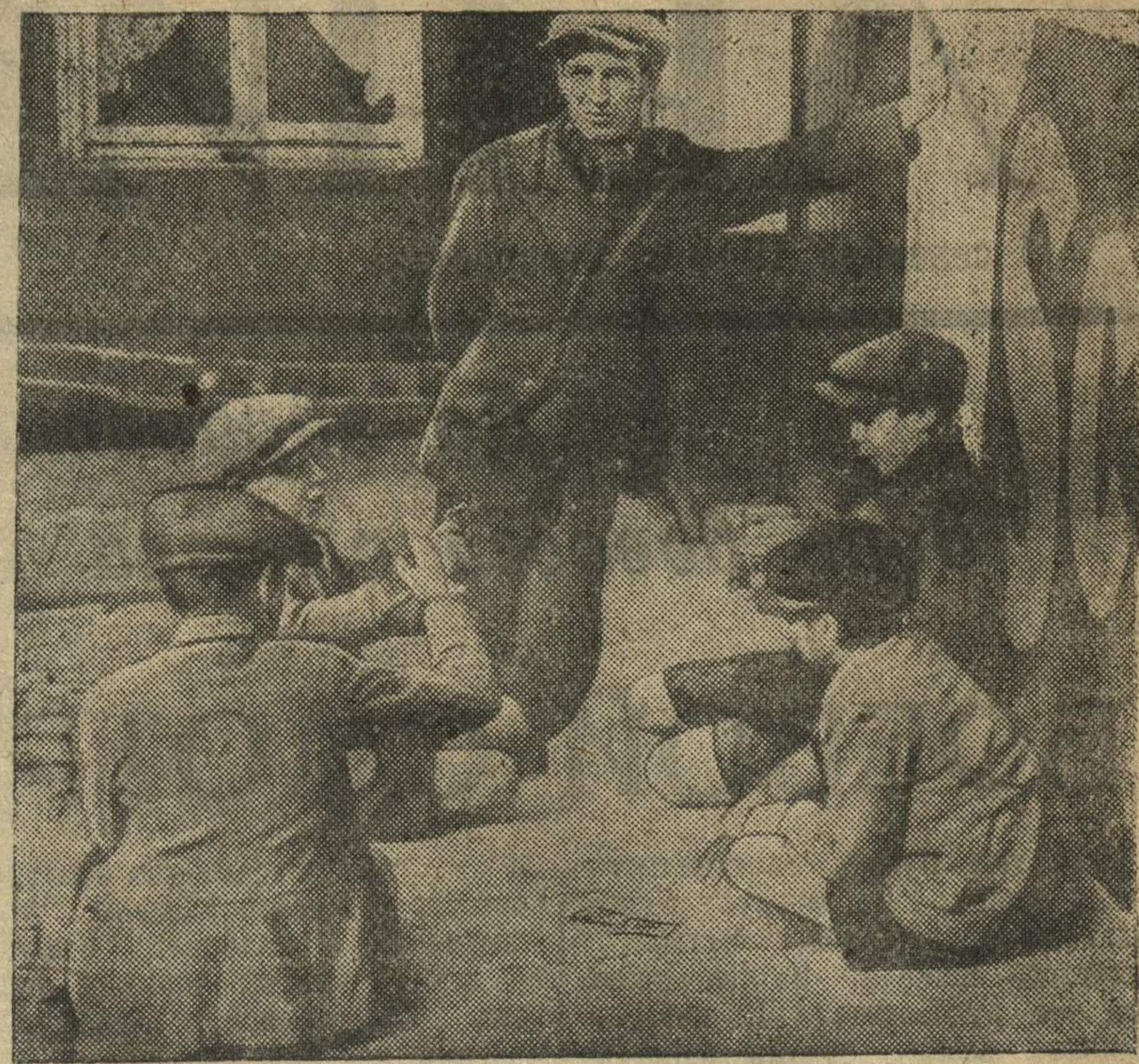
Живя в тесных и темных помещениях, не имея никакой возможности провести свои свободные часы в интересной и занимательной обстановке, дети трудящихся вынуждены проводить много часов на улице. Там они приучаются к азартным играм, попадают под власть улицы. На снимке: дети на улицах Брюсселя.

Советская молодежь, возглавляемая славным комсомолом, и впредь будет высоко держать знамя Ленина — Сталина, показывая все новые и новые образцы коммунистического труда, готовности к защите своей социалистической родины, беззаветной преданности партии большевиков и великому, любимому вождю народов — товарищу Сталину.