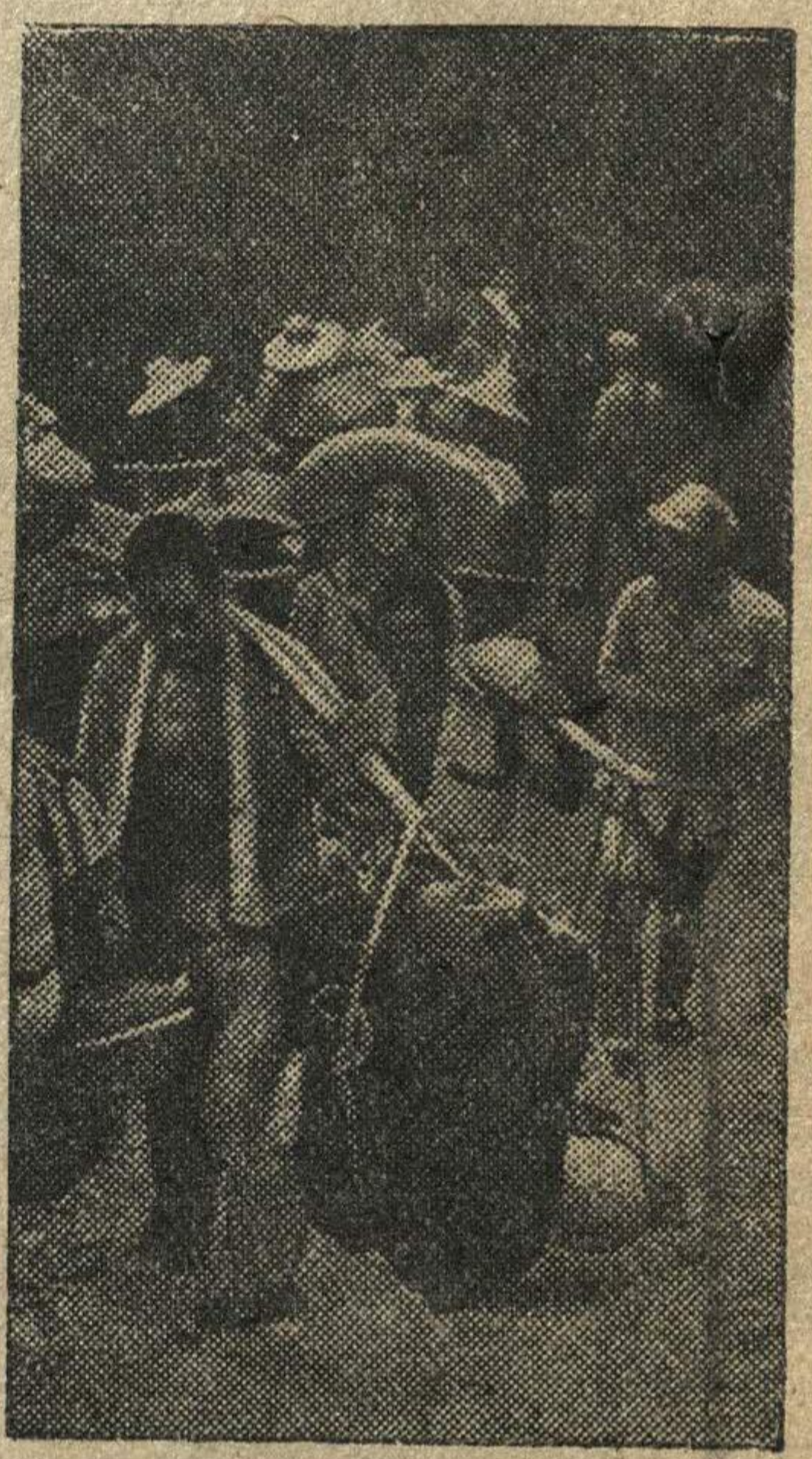
Население деревень провинции Шаньси направляется в горы при приближении японской армии.

Представитель японского министерства иностранных дел на пресс-конференции заявил, что переговоры между Японией и французскими властями по поводу Индо-Китая «протекают успешно». По его словам эти переговоры Япония ведет не только с местными французскими властями, но и с правительством Петзана.