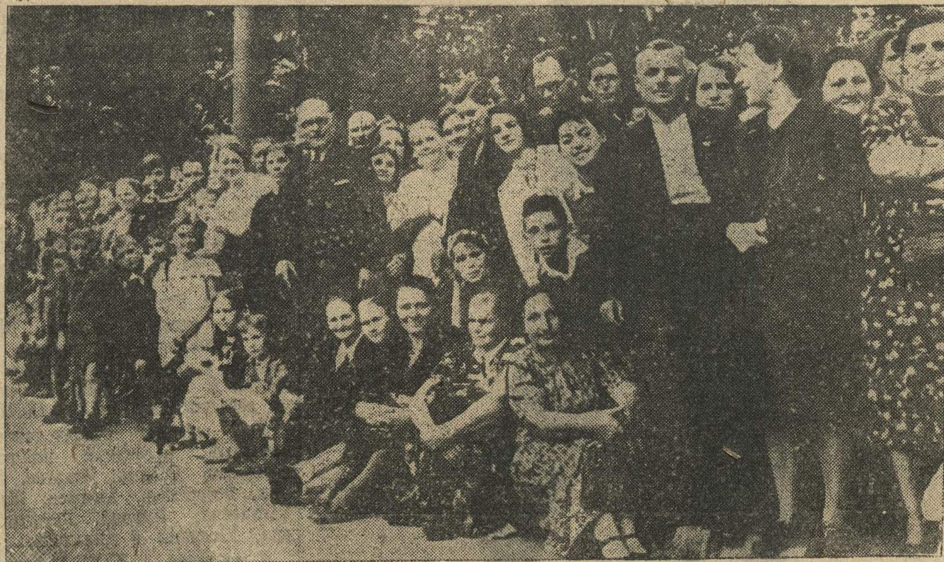
Население Риги слушает радио из Москвы.