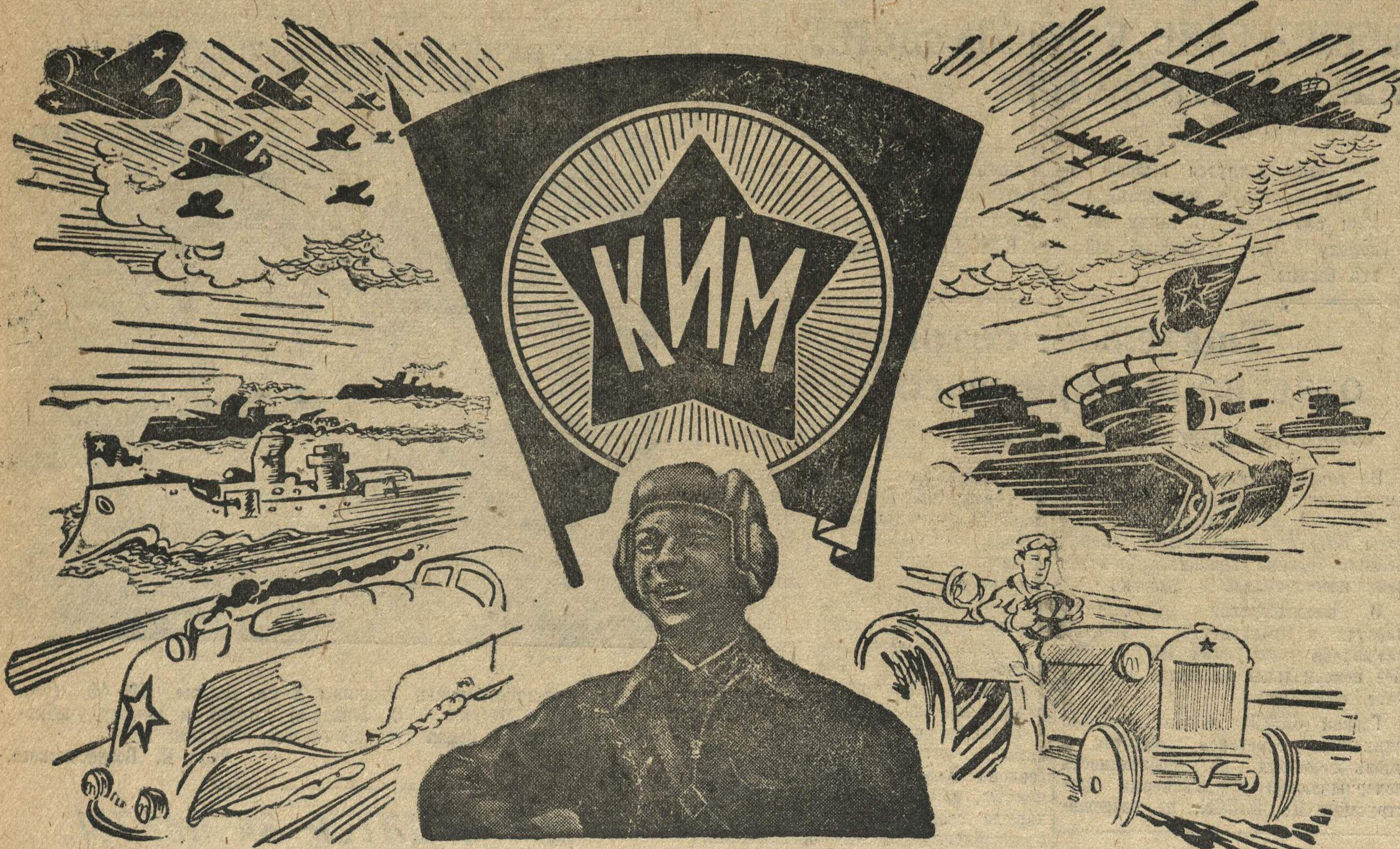
Шагай вперед, комсомольское племя, Шутя и пойд, чтоб улыбки цвели,