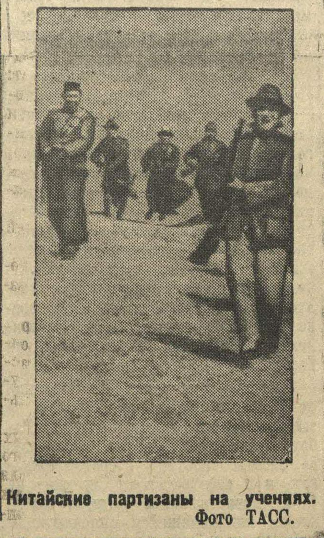
Китайские партизаны на учениях.

Одновременно сообщается, что созданная королем Каролом государственная организация молодежи «На страже страны» распущена.