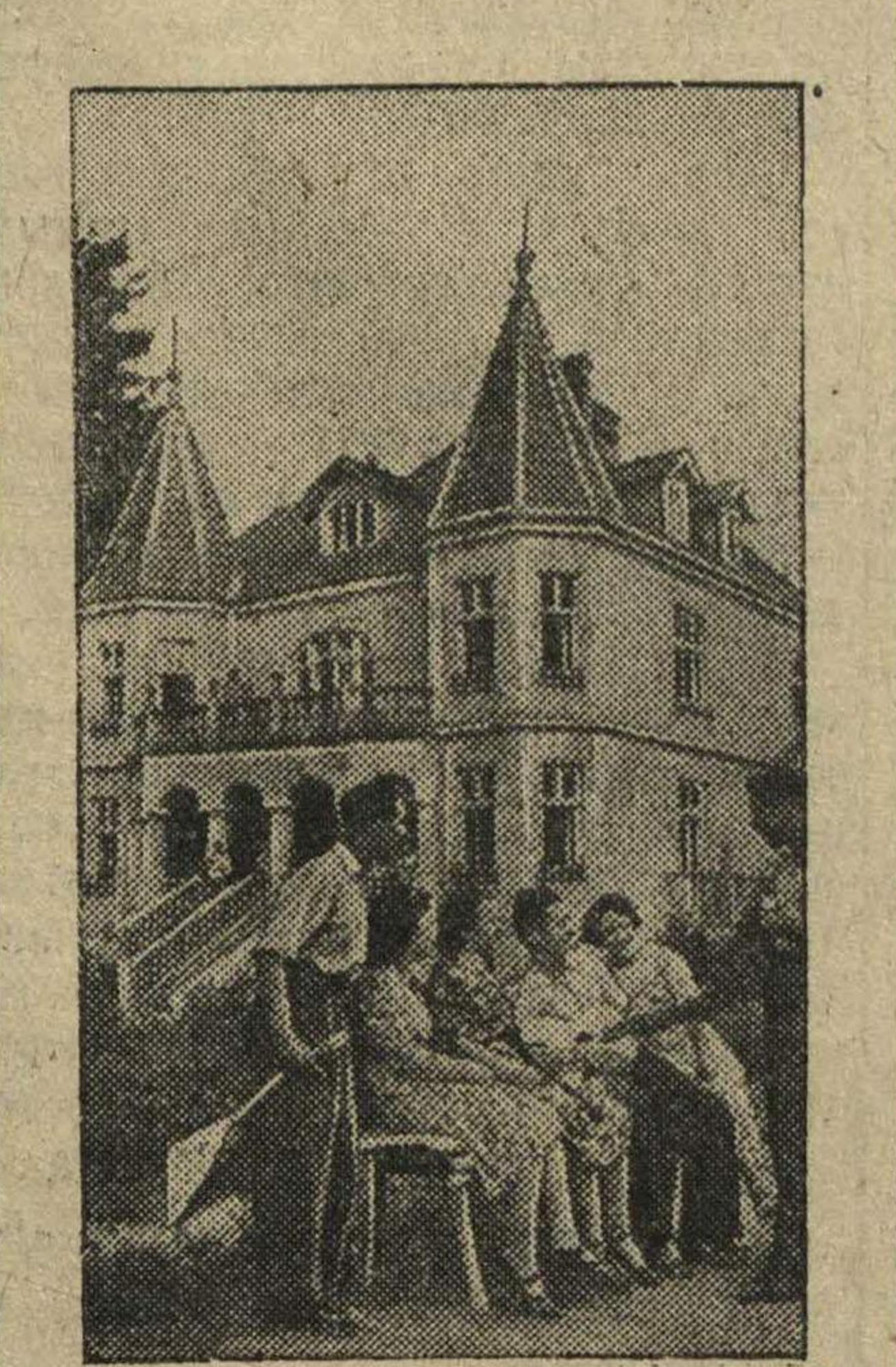
В живописной местности, недалеко от гор. Львова, расположен новый советский курорт Брюховичи. Раньше здесь были отдельные дачи польских капиталистов. На снимке: отдыхающие на курорте Брюховичи.