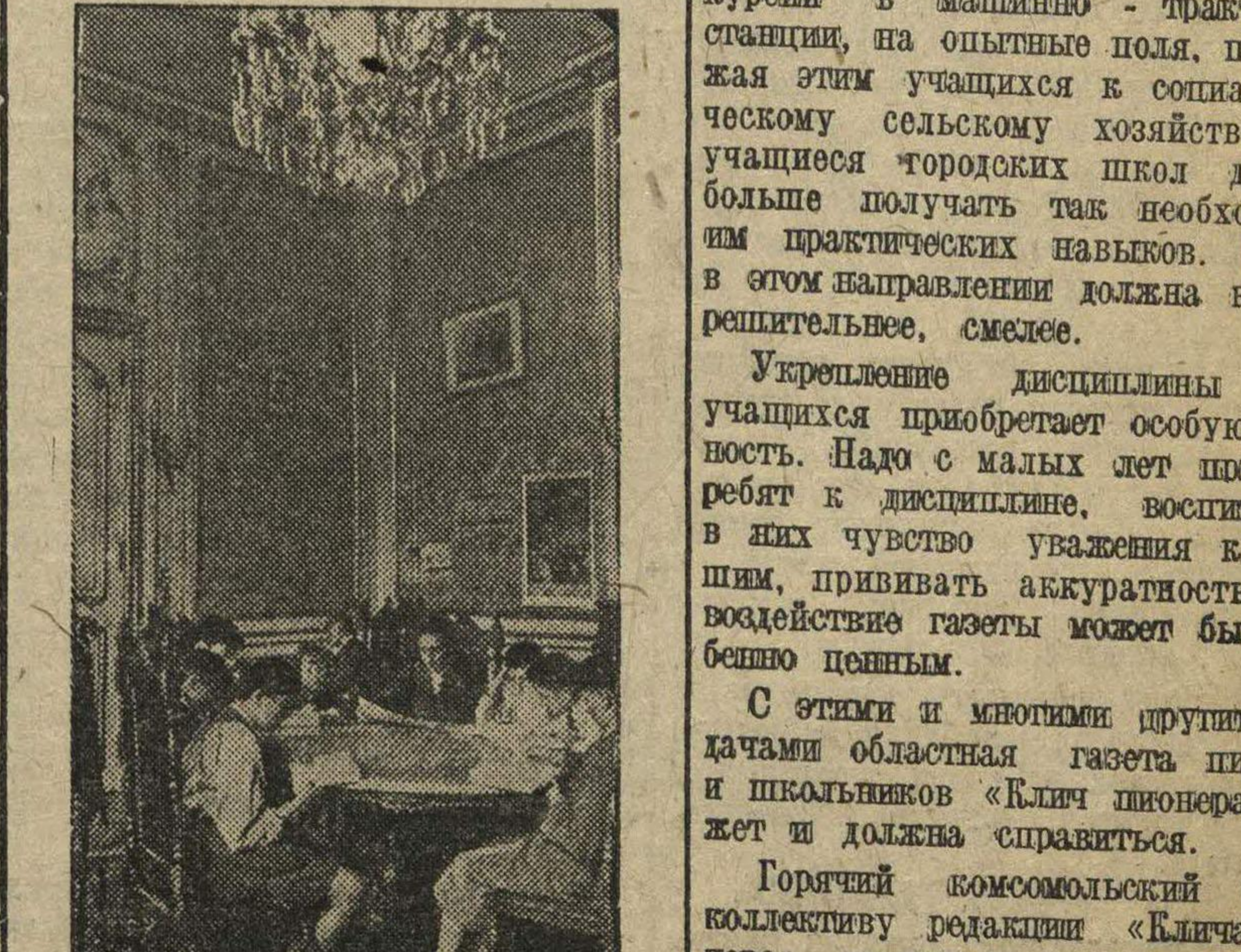
В доме бывшего польского помещика графа Поточного оборудован Дворец пионеров и школьников. В многочисленных кружках Дворца занимается свыше тысячи пионеров и школьников г. Львова. На снимке: в читальном зале Дворца пионеров.