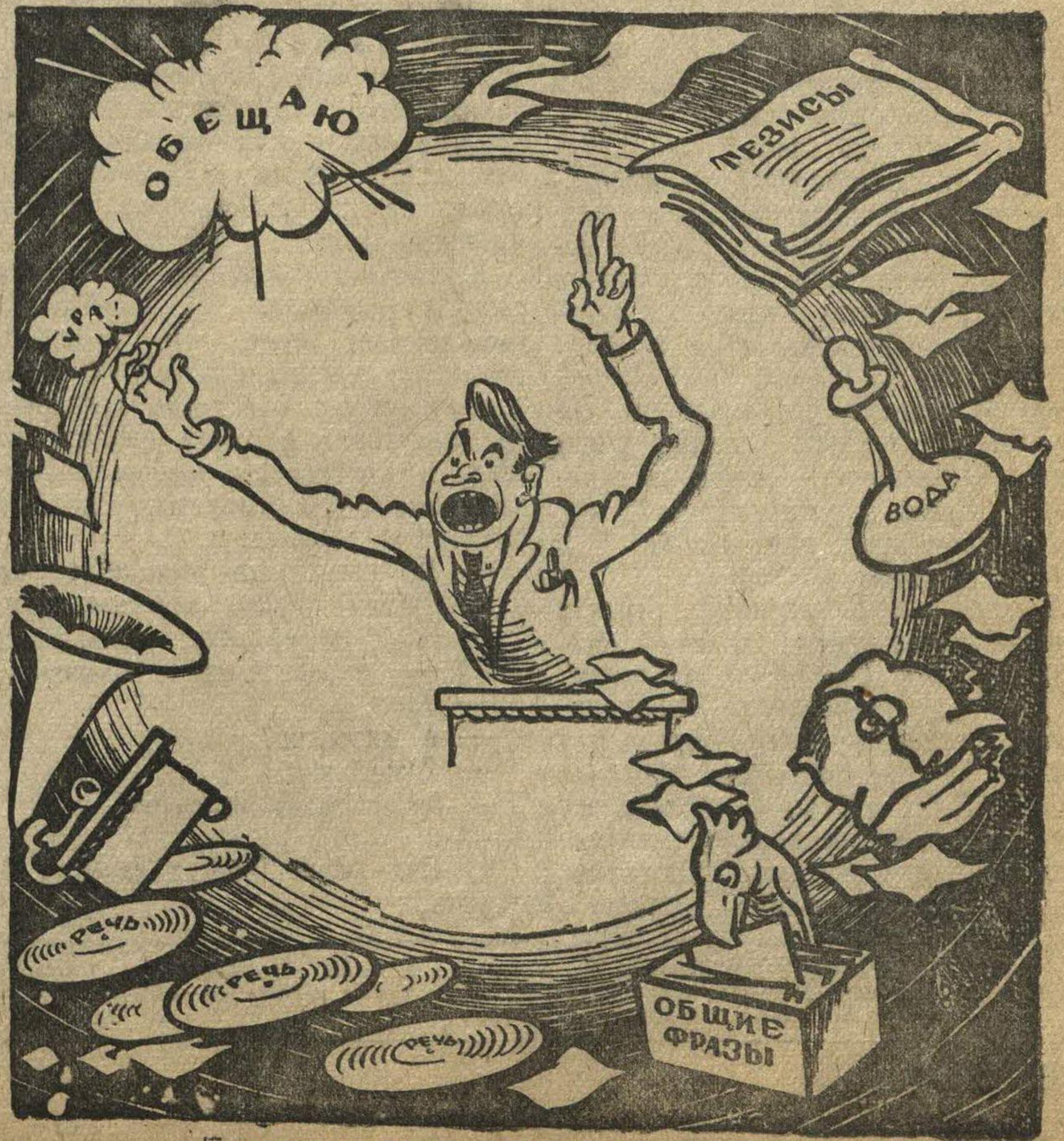
Болтун и его „вечные спутники“.