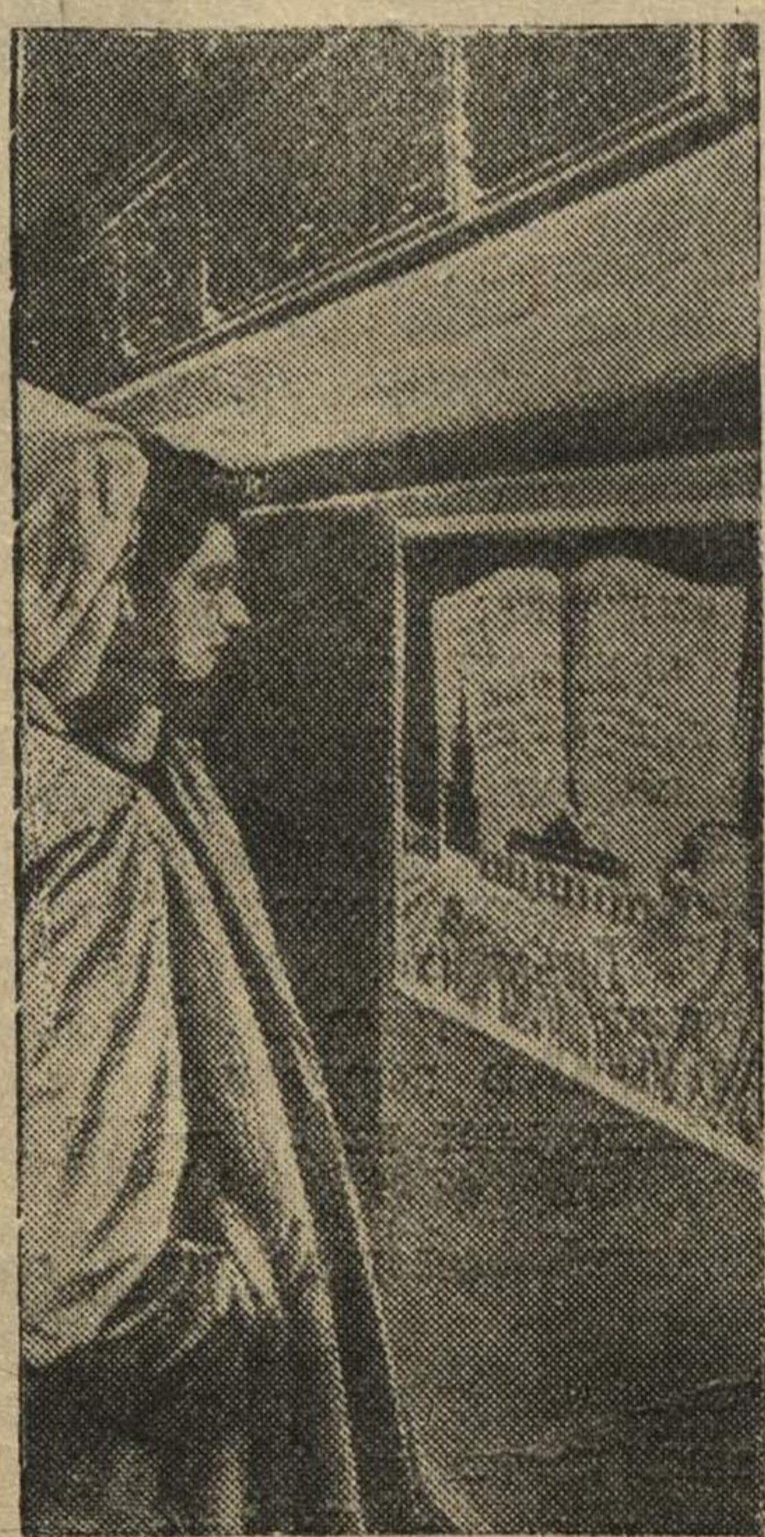
Жители Риги читают планкт в всеобщей воинской обязанности.