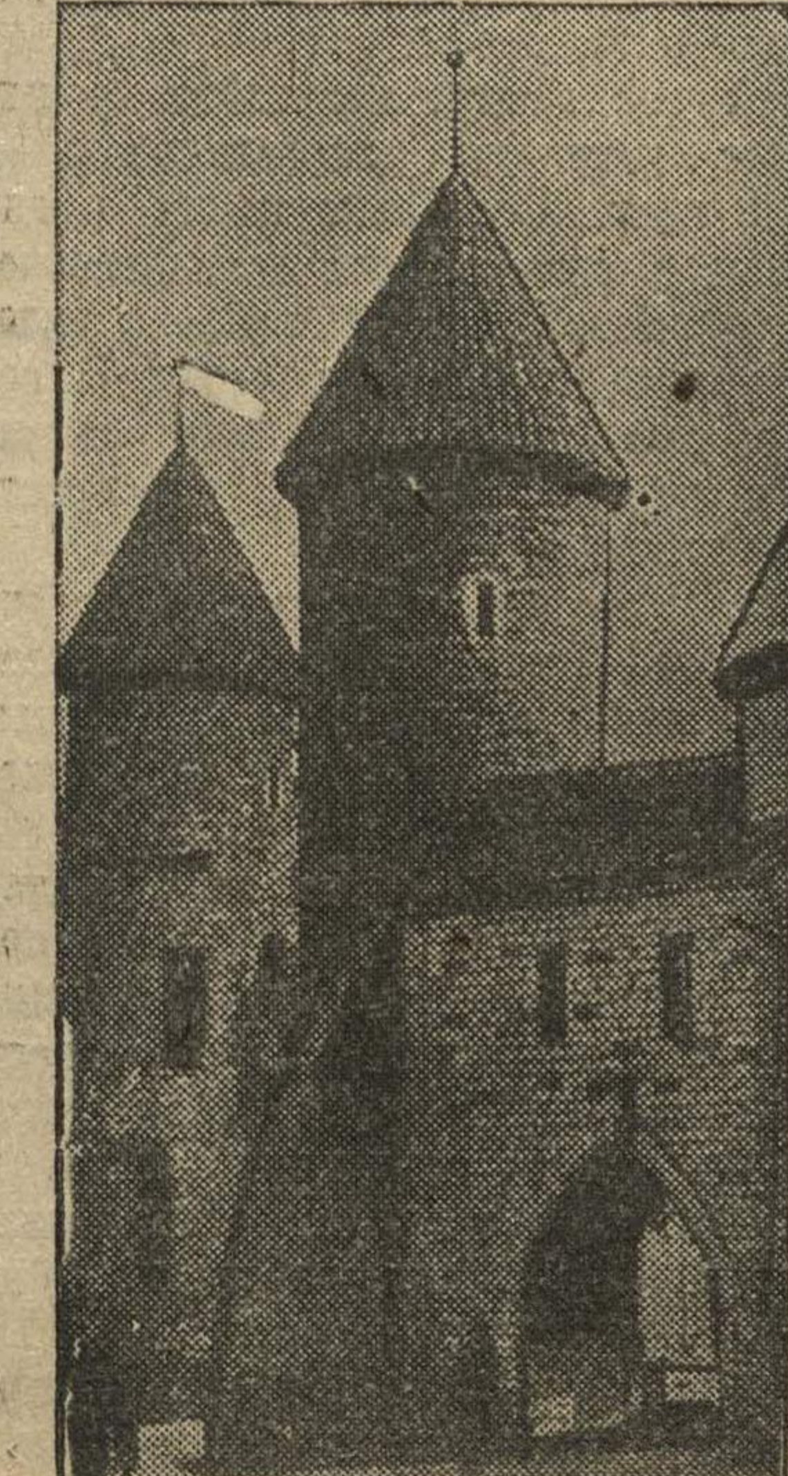
На снимке: вид башни и ворот на Виру улице (г. Таллин).