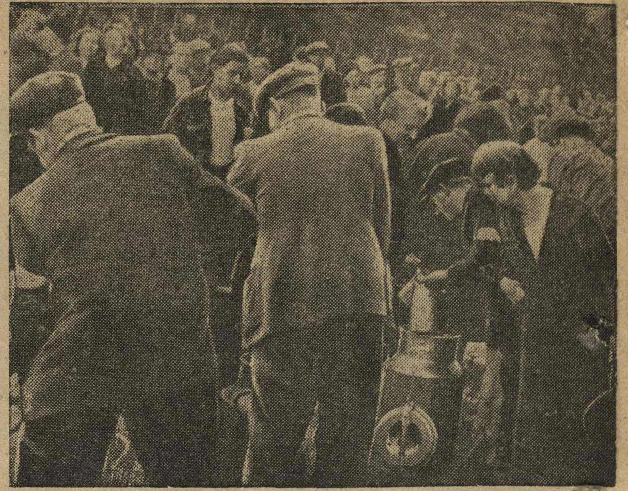
Очередь за получением пайка на одной из улиц Парижа.