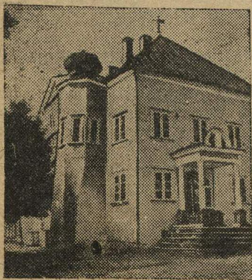
Домик Петра Первого в гор. Нарве.