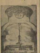
Павильон СССР на Международной выставке в Нью-Йорке.