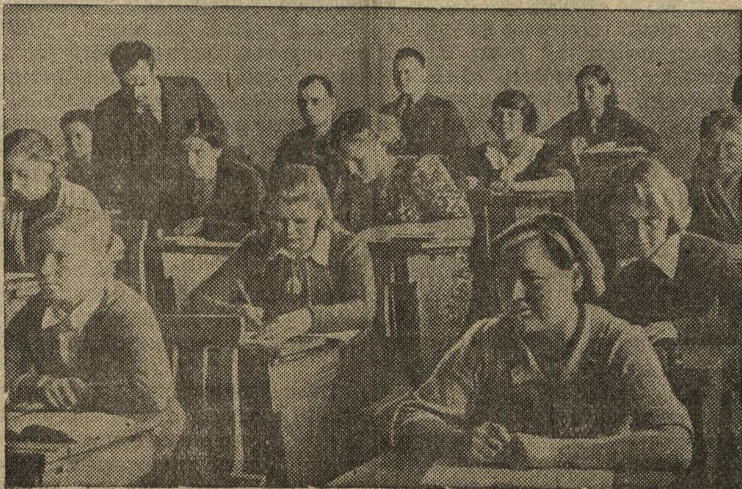
Колхозный сельскохозяйственный техникум в г. Сортавала (Нарело-Финская ССР). На снимке: урок математики на подготовительном отделении техникума.