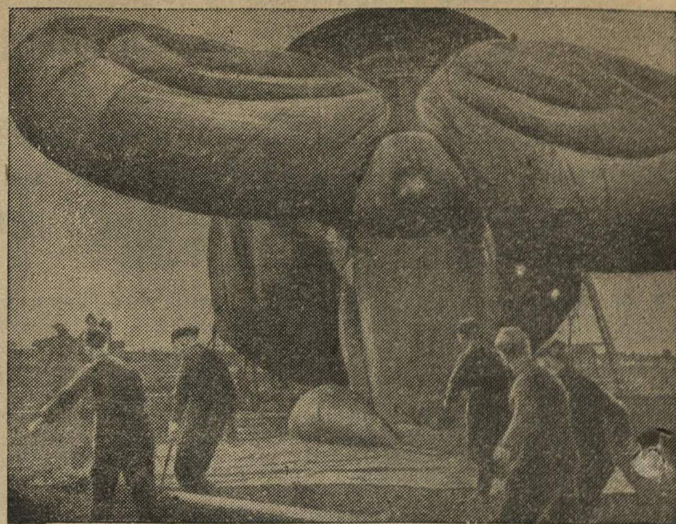
Аэростат воздушного заграждения в Англии.

В виду изложенного, советское правительство не может признать протест, заявленный британским правительством в ноте от 29 октября.