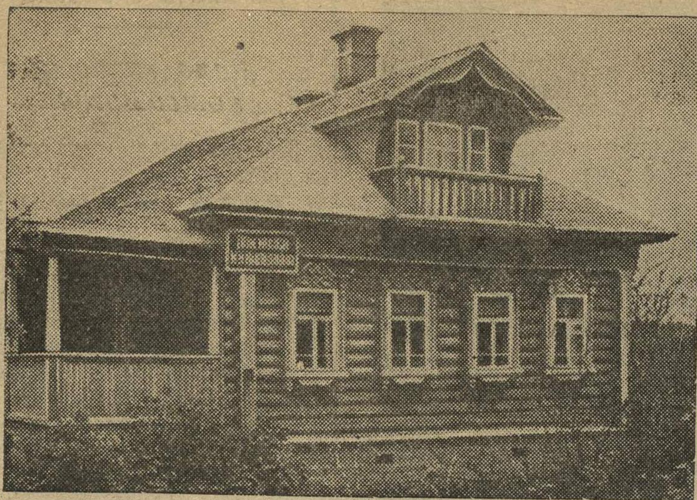
Дом-музей М. И. Калинина в селе Верхняя Троица (Кашинский район, Калининская область), в котором жил М. И. Калинин.