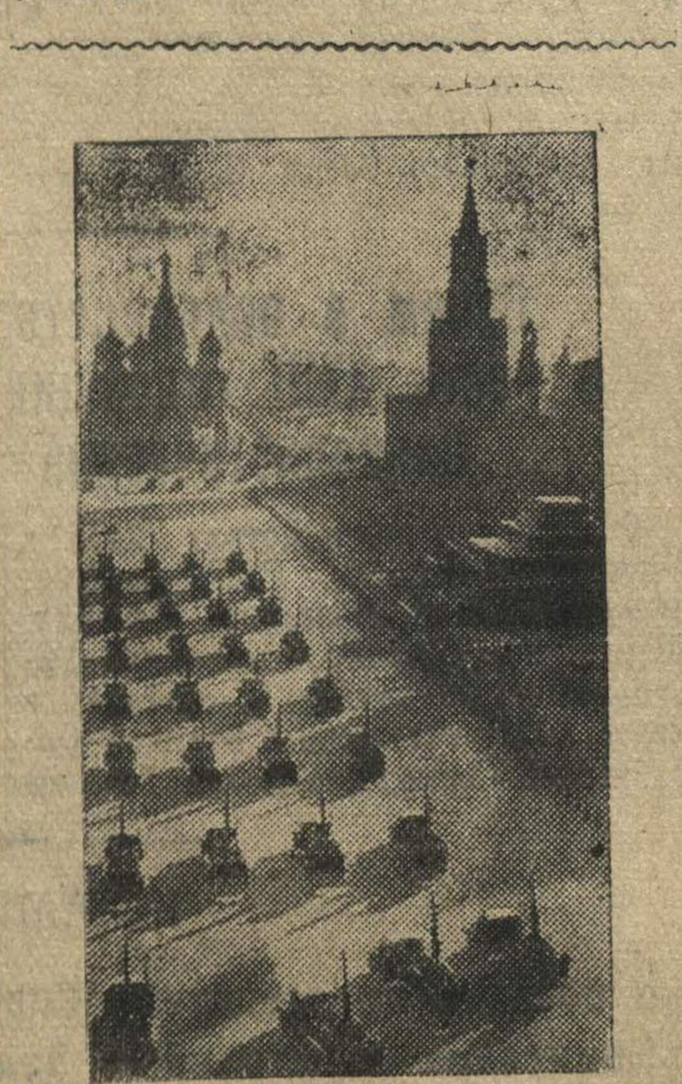
Празднование в Москве XXIII годовщины Великой Октябрьской социалистической революции. Зенитная артиллерия на параде.