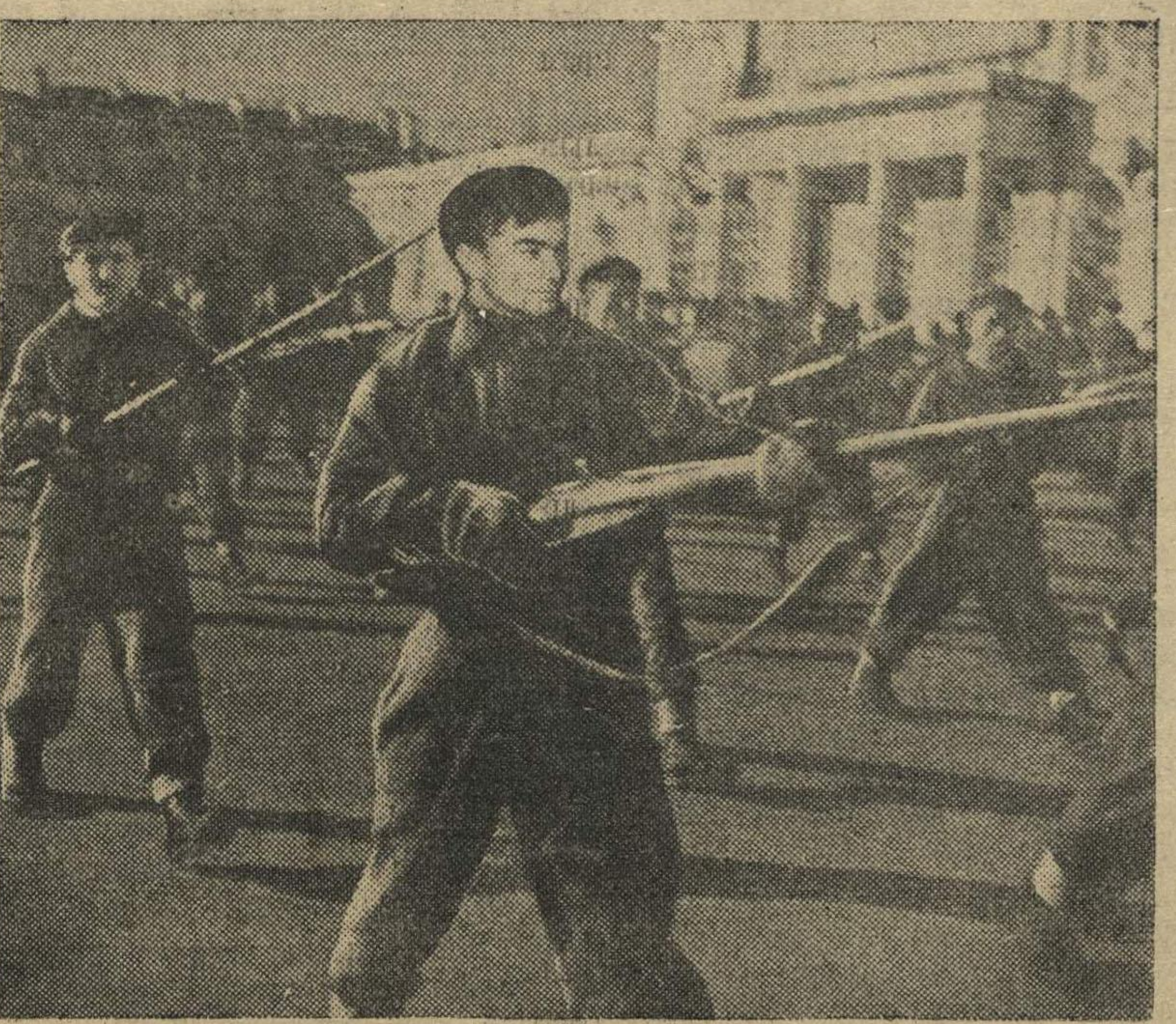
Демонстрация трудящихся гор. Горького на площади Челюскинцев. С винтовками наперевес перед трибуной прошли курсанты школы инструкторов физкультуры ВЦСПС.