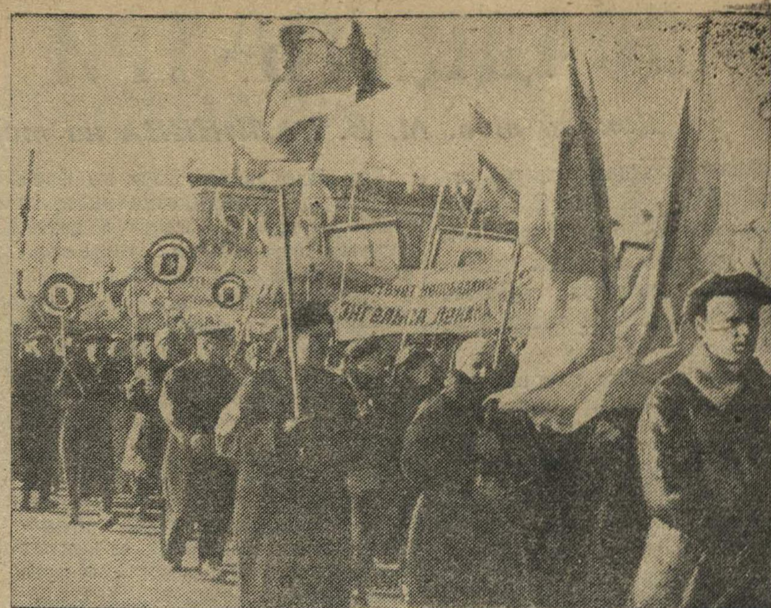
Демонстрация трудящихся гор. Горького на площади Челюскинцев. На снимках (слева): колонна сормовичей, открывшая демонстрацию трудящихся города. В центре—колонна Кагановичского района. Справа — трудящиеся Свердловского района.