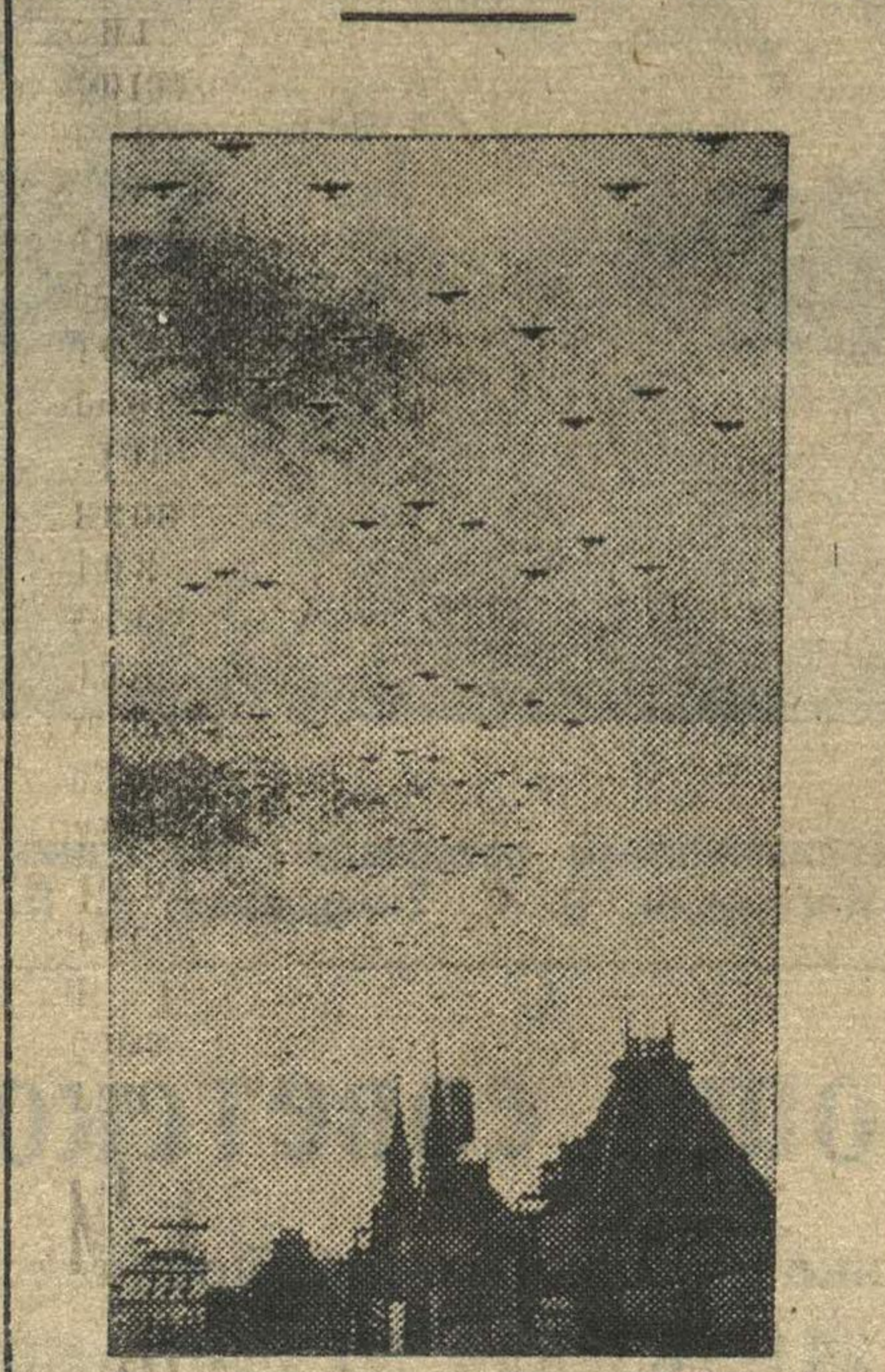
Празднование в Москве XXIII годовщины Великой Октябрьской социалистической революции. Самолеты над Красной площадью.

В демонстрации участвуют люди всех возрастов—старшки, испытанные на себе ярмо капиталистического рабства, люди, выросшие в наше советское время, ровесники Октября, подростки, только всту-