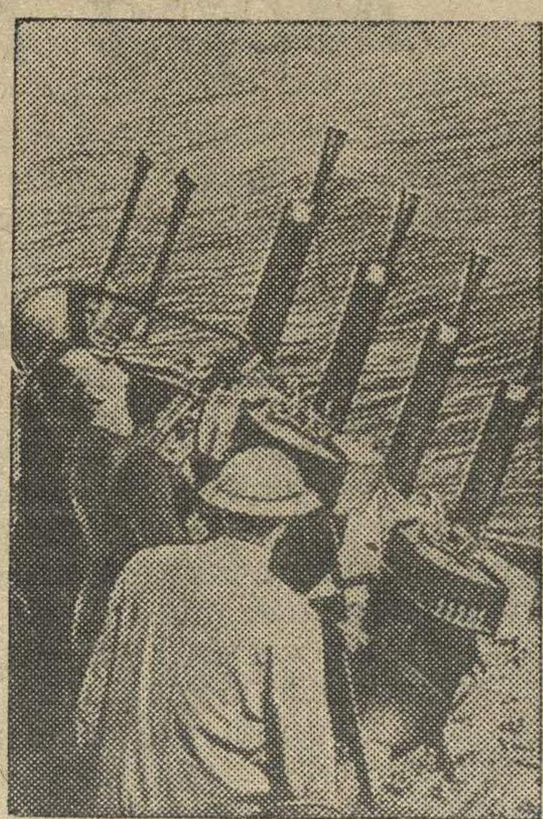
Зенитные пулеметы на английском миноносце.

Очевидцы передают, что, начиная с 2 ноября, итальянцы беспрерывно бомбардируют Корфу.