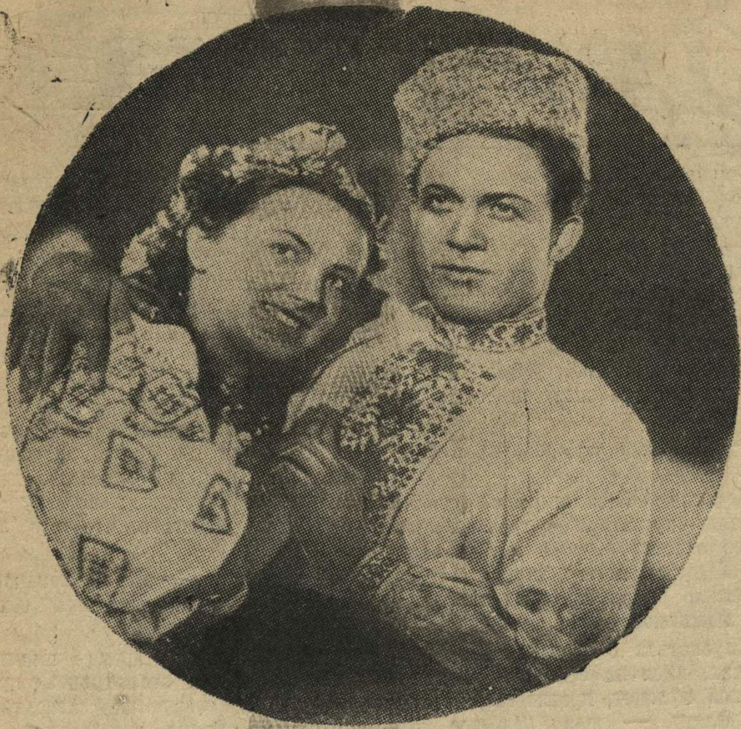
В кинотеатрах «Художественный» и «Палас» с успехом идет новый художественный фильм «Музыкальная история». На снимке: кадр из фильма — П. Говорнов — артист С. Лемешев и Катя — артистка З. Федорова.