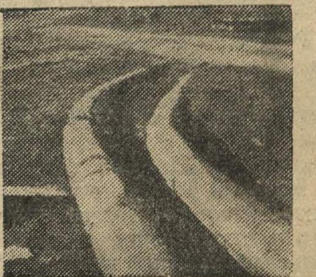
Английские нефтепроводы, проложенные из Ирана в Хайфу через Сирию.

Среди других военных кораблей, строительство которых приближается к концу, — 6 гидроавиаматов, 15 истребителей подводных лодок, 40 торпедных катеров. Морское министерство разместило заказы на сумму свыше 4.187 млн. долларов. Как известно, всего на оборону США конгресс отпустил 16 миллиардов долларов.