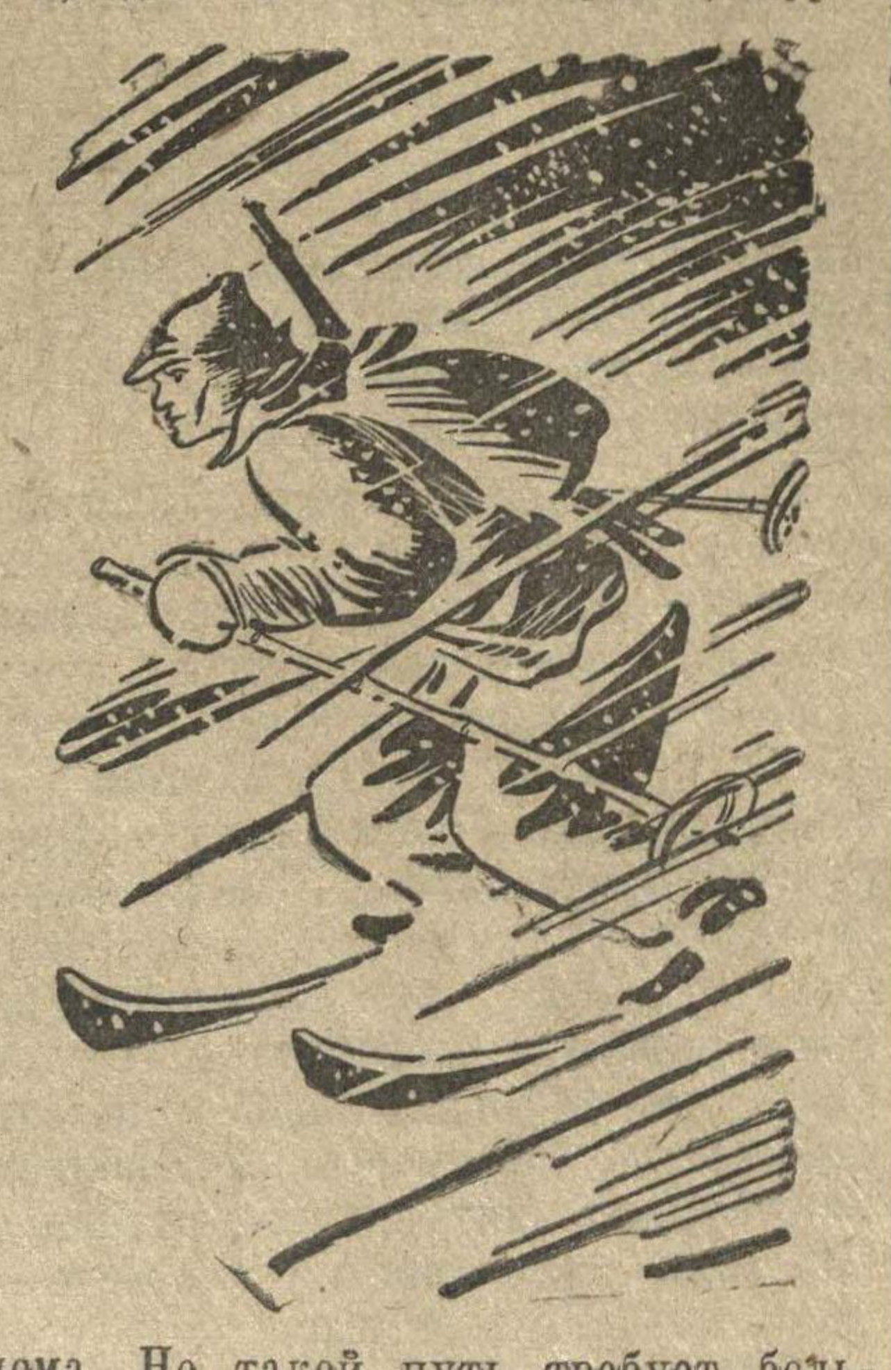
Рис. Н. Головина.

Ударом с фланга и в лоб белофинская банда была ликвидирована. Отряд вышел к хутору. Здесь он добыл целый ряд ценных сведений о противнике. Разведчики заскользили в новом направлении.