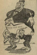
Социал-демократы: Своих дома не теряют... Рисунок Г. Вазюк.