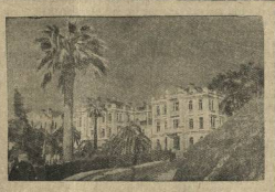
Санитарный вивес Ленина в Гуз'яринне (Абзаков АССР)

Такое положение в работе кружков оно требует пристального внимания и помощи учебным группам со стороны парткома и парторганизации.