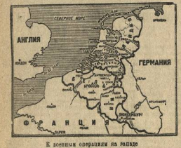
К основным операциям на западе