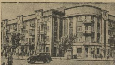
Новый жилой дом рабочих и служащих нефтяной промышленности в городе Грозном (Чечено-Ингушская АССР).