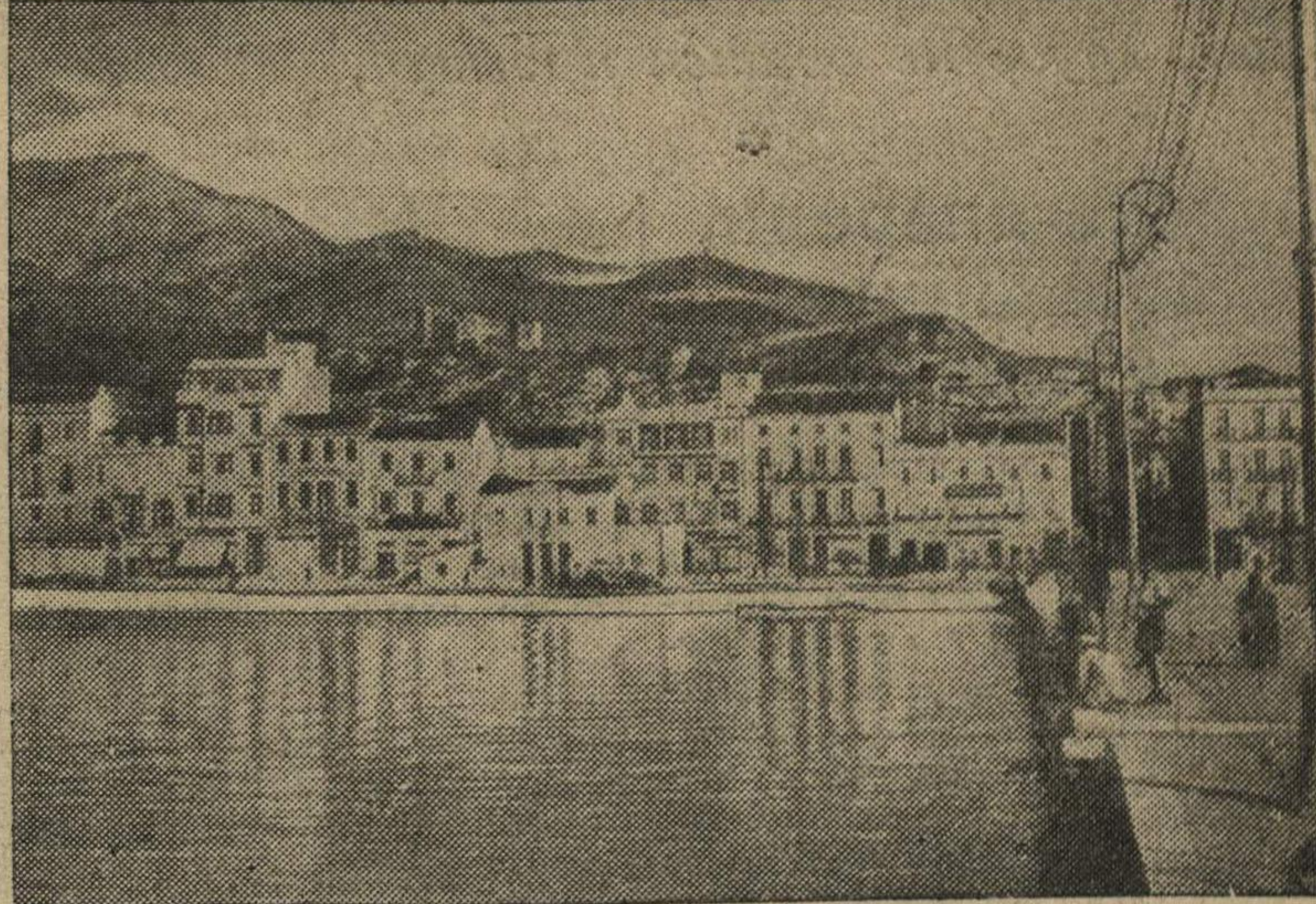
Город Патрас (Греция), недавно подвергшийся бомбардировке итальянскими самолетами.