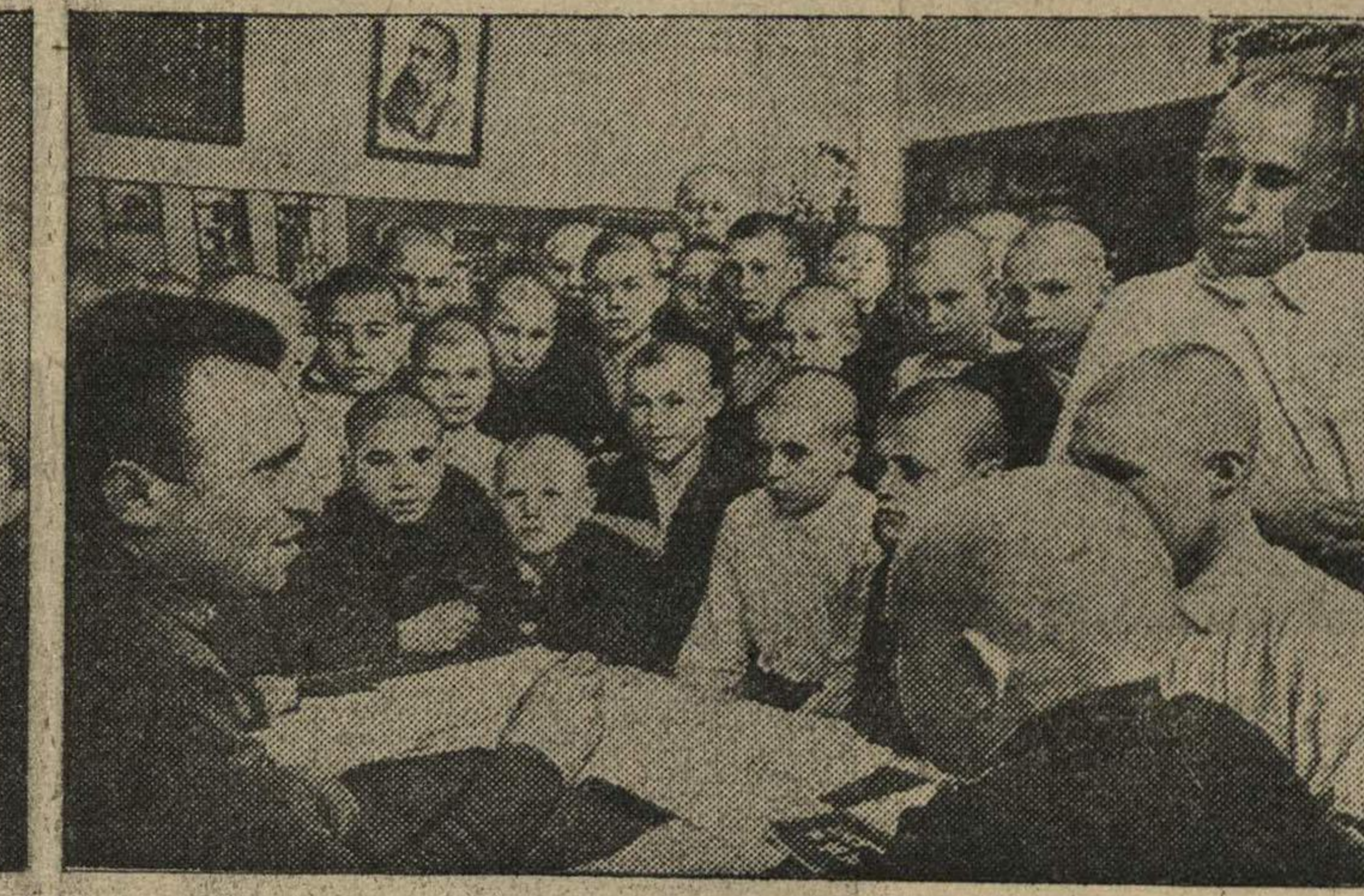
В трудовую семью горьковчан за два последних дня влились тысячи юных граждан. Для них широко распахнулись двери ремесленных училищ и школ ФЗО. Подростков приняли приветливо и радушно. Их ждет заманчивое будущее. — Добро пожаловать, дорогие товарищи!