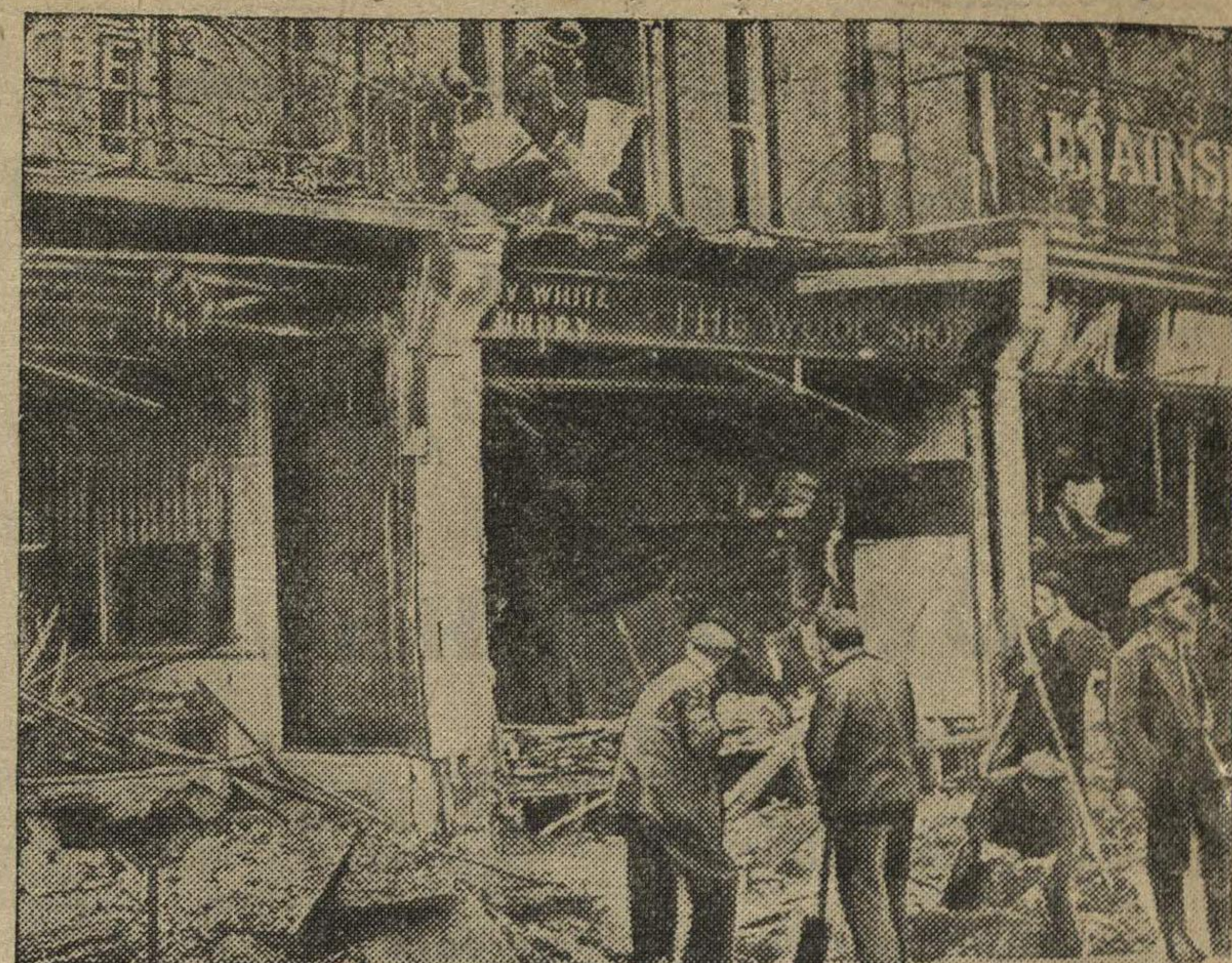
Дом в окрестностях Лондона после бомбардировки германскими самолетами.