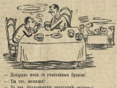
Рисунк В. Пылаева.