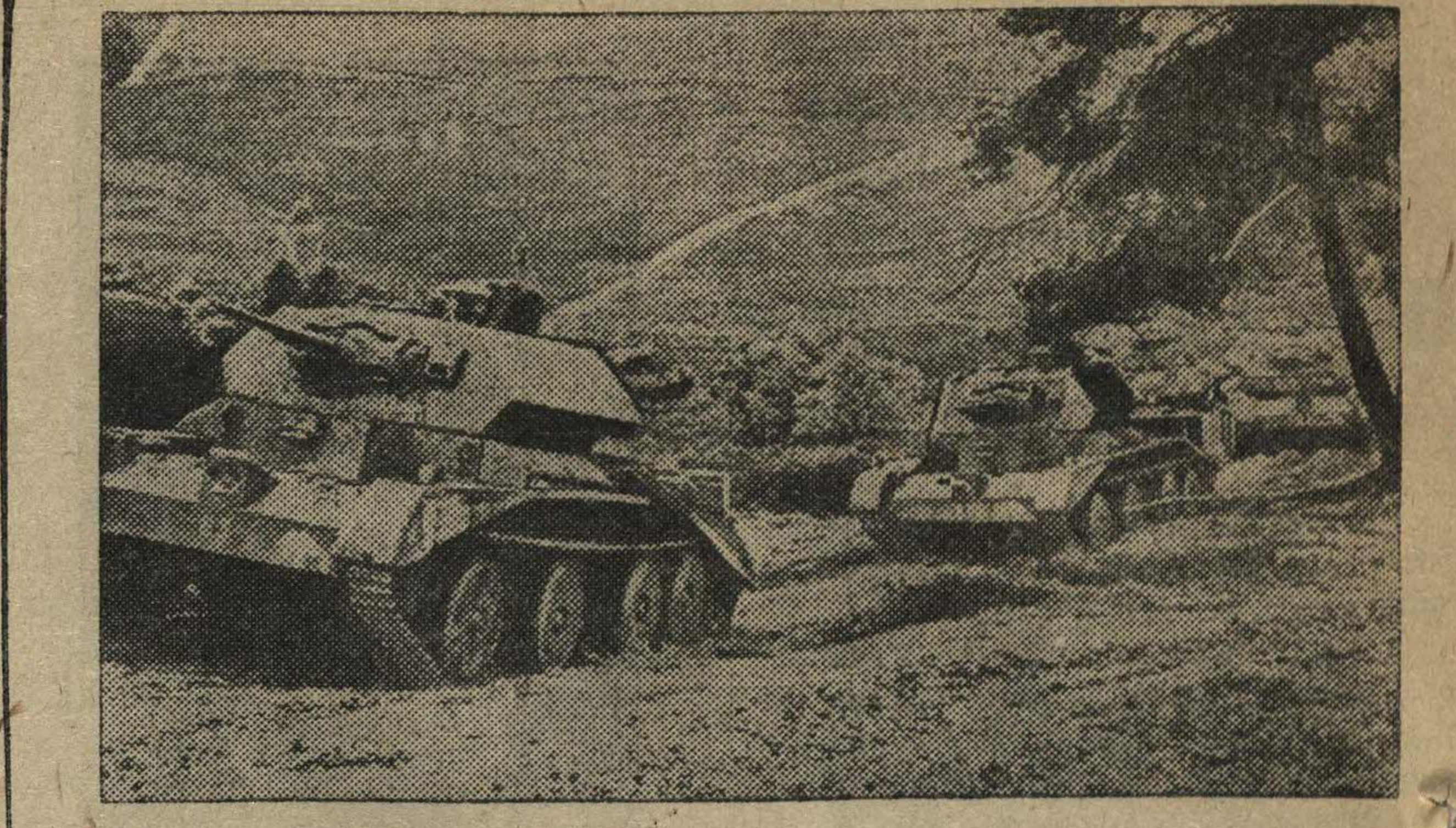
Английские тяжелые танки в походе.

4. Тренировка с применением изученных навыков — юноши 5—6 км., девушки—3—4 км.