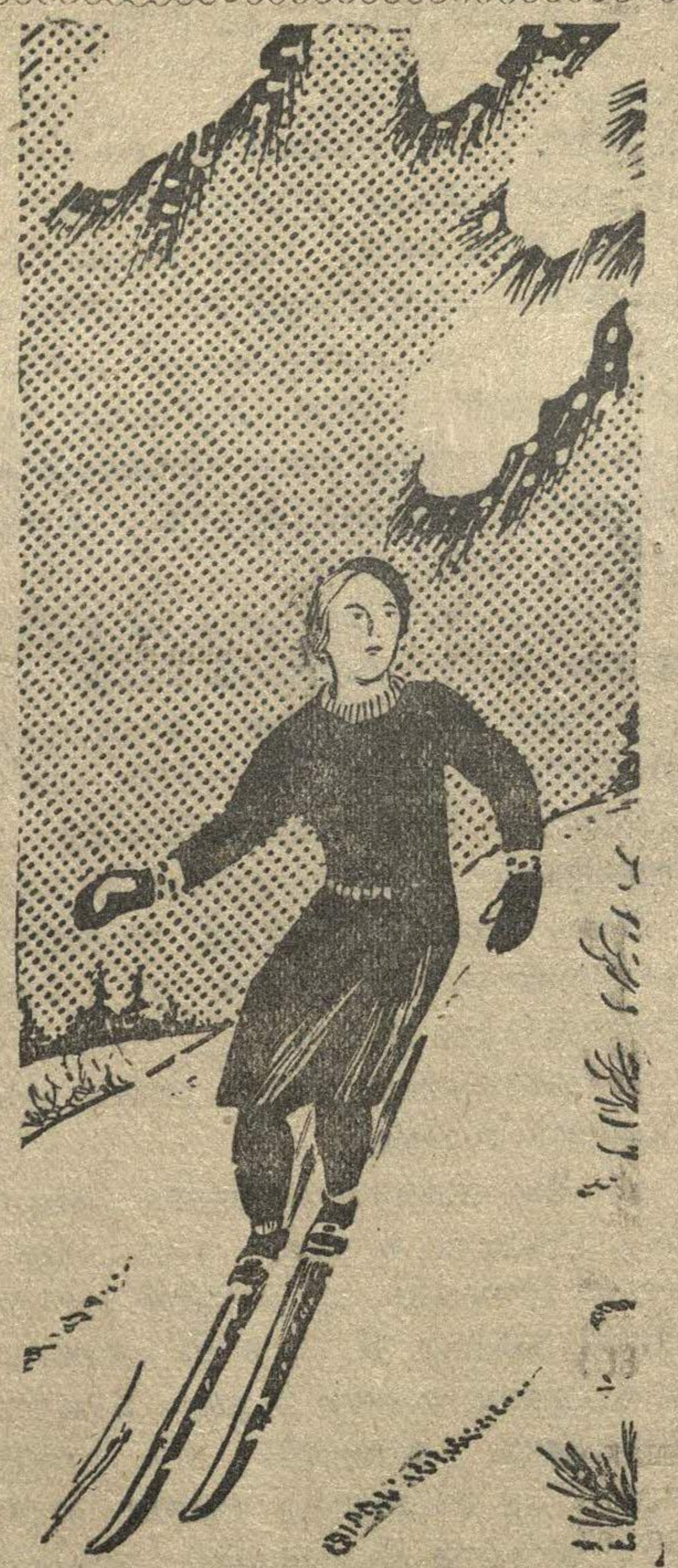
Рис. Н. Головина.

Комсомольская организация при колхозе «Волдо-Ки» Пильевского района планомерно организовала оборонно-физкультурную работу. Подготовлено 25 значков ПВХО и 17 значков ГТО. На днях молодежь колхоза устроила лыжную вылазку до реки Медяна. Комсомолки деятельно готовятся к кроссу, систематически проводят тренировку. П. ГОРОДСКОВ.