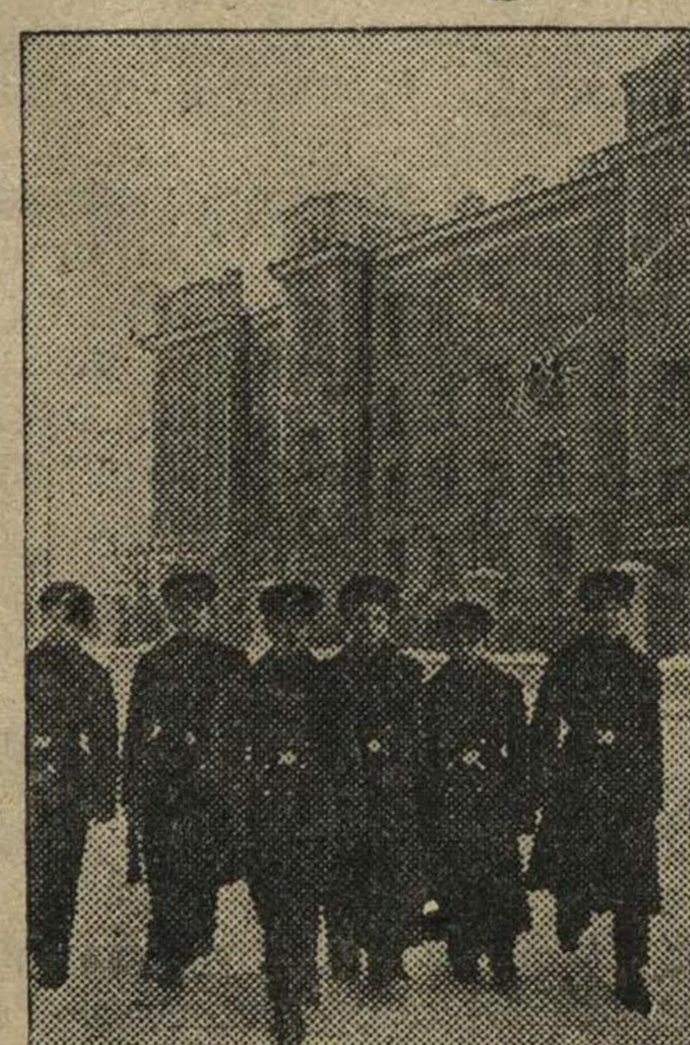
В ремесленном училище № 8 при машиностроительном заводе им. Калинина (Москва) обучается 650 детей колхозников Курской области. На снимке: ученики идут на занятия.

БЕРЛИН, 19 декабря. (ТАСС). 19 декабря в новой имперской капеллярши рейхсканцлер Германии г. Гитлер в присутствии министра иностранных дел Германии г. фон Риббентропа принял полномочного представителя СССР в Германии тов. В. Г. Деканозова, вручившего свои верительные грамоты. Тов. В. Г. Деканозов представил г. Гитлеру ответственных работников подпредства СССР в Германии. Отряд личной охраны г. Гитлера оказал тов. В. Г. Деканозову воинские почести как при его прибытии, так и при отъезде.