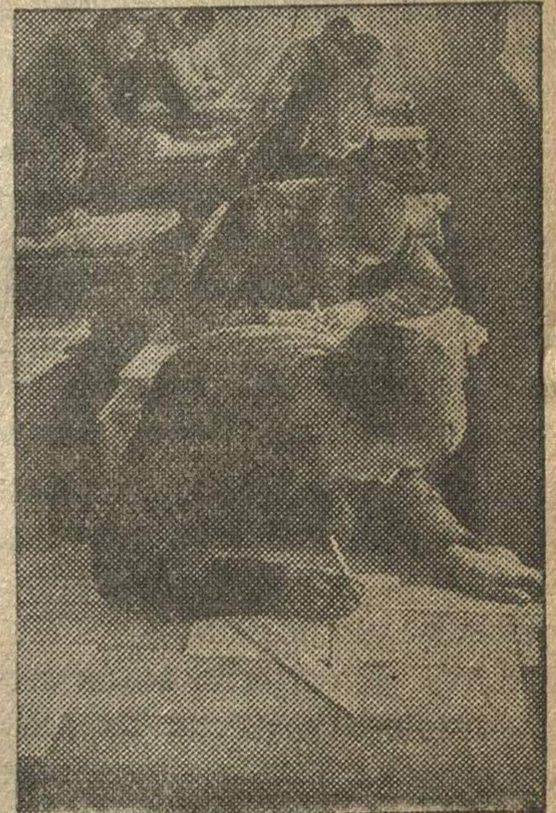
Ученики V токарной группы ремесленного училища № 2 на уроке черчения.

ствления плана электрификации России во что бы то ни стало и вопреки всем препятствиям» (См. соч. Ленина, т. XXVI, стр. 58).