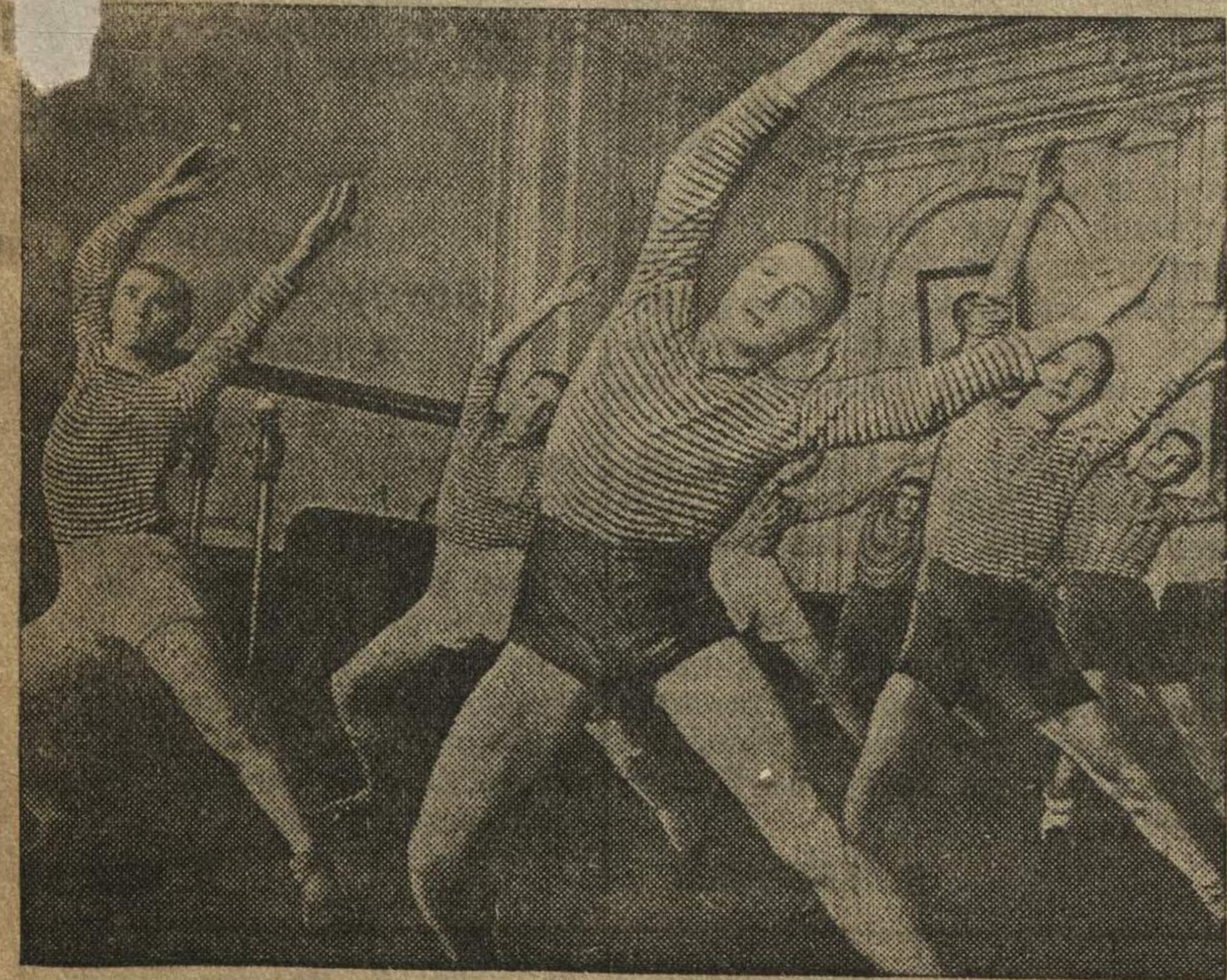
Ученики 1-й роты 3-й Горьковской специальной военно-морской средней школы на уроке гимнастики.

По примеру Бугрова сделали себе лыжи еще около десяти учащихся школы.