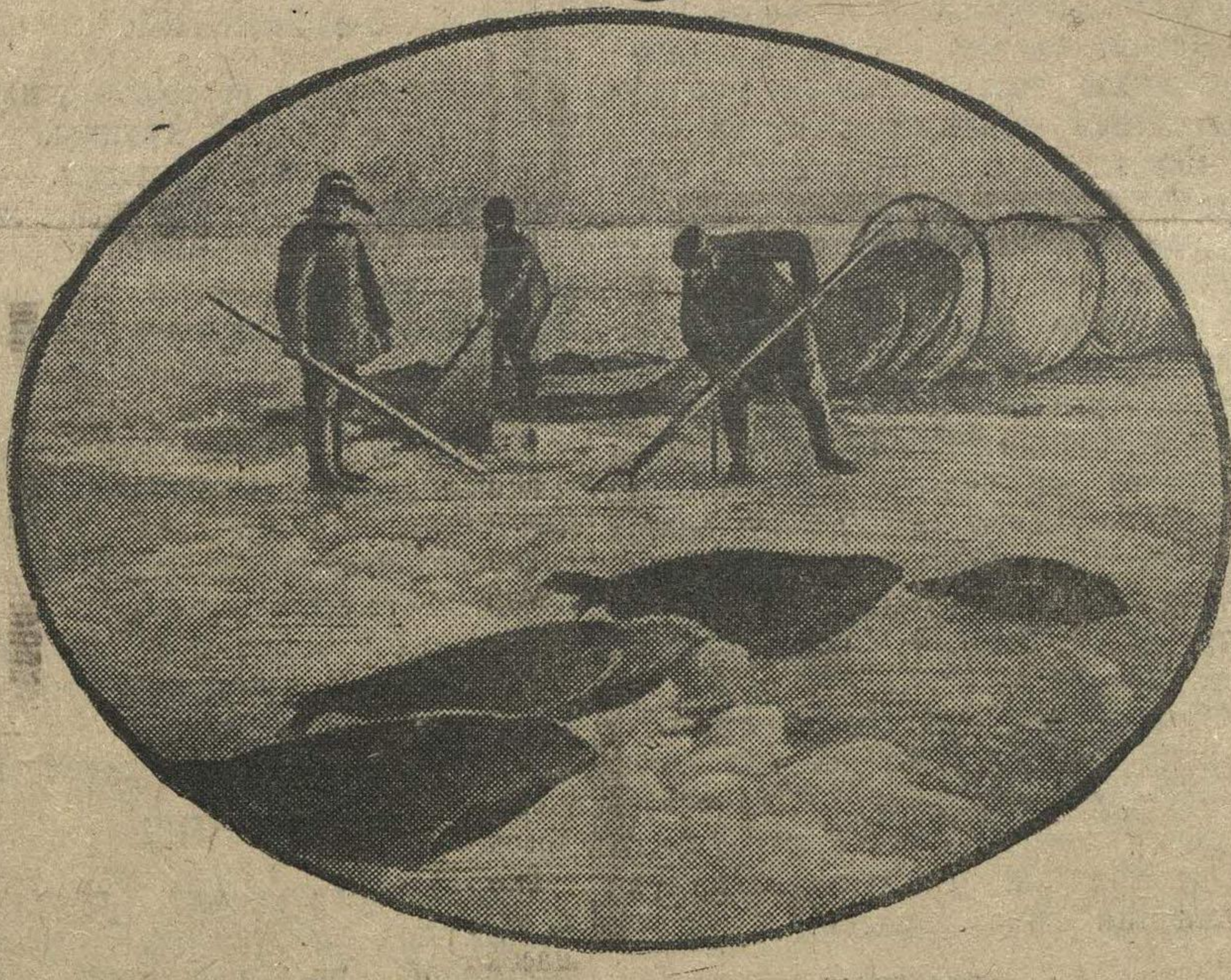
Беломорские рыбаки у выловленных сетями тюленей.