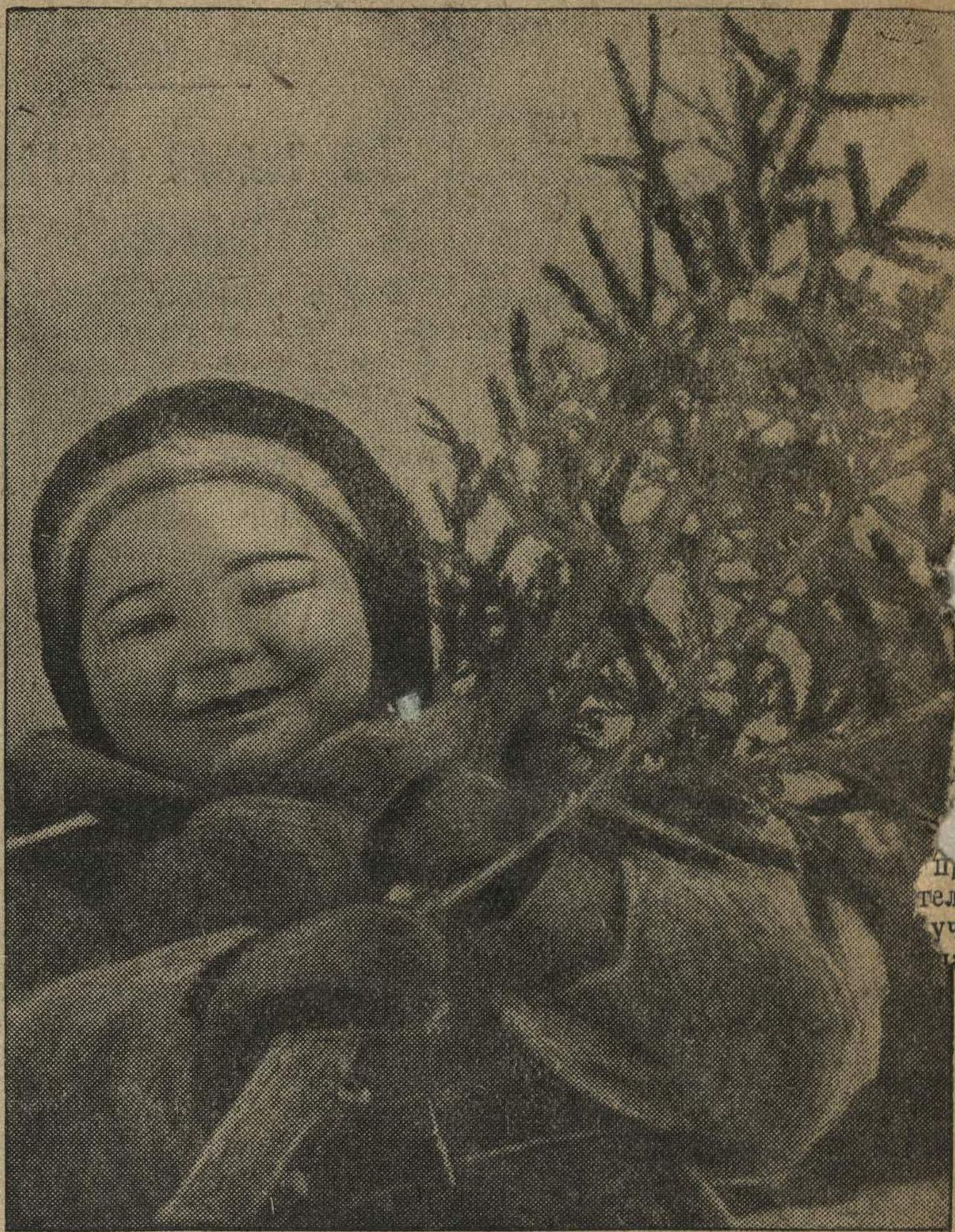
С елочного базара.