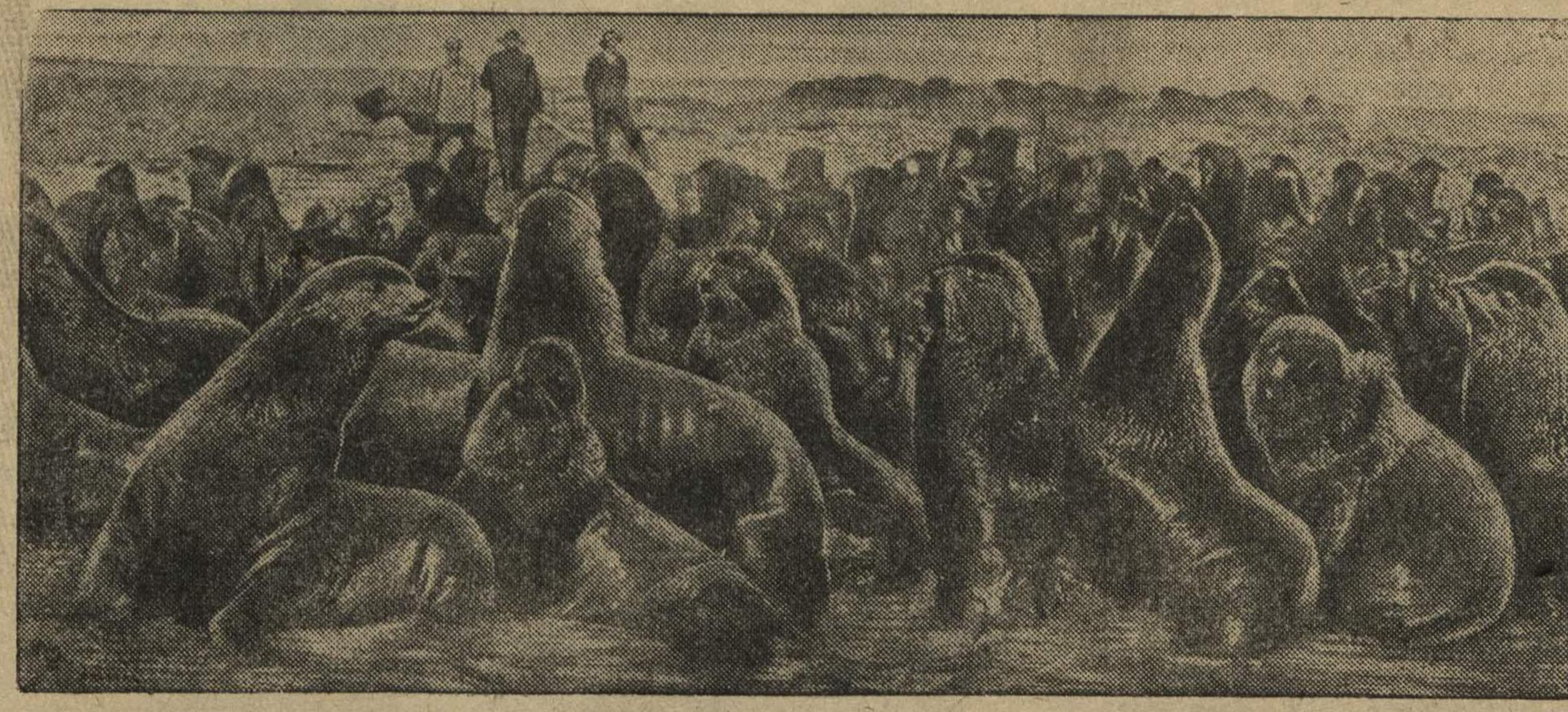
Ляжбище морских котиков на Командорских островах (Берингово море).

В номере «Ленинской сменки» за 29 декабря допущена ошибка. В заголовке на третьей странице сказано, что «до начала комсомольского лыжного кросса осталось 12 дней». Речь идет о начале заочных соревнований с комсомольцами Карело-Финской ССР.