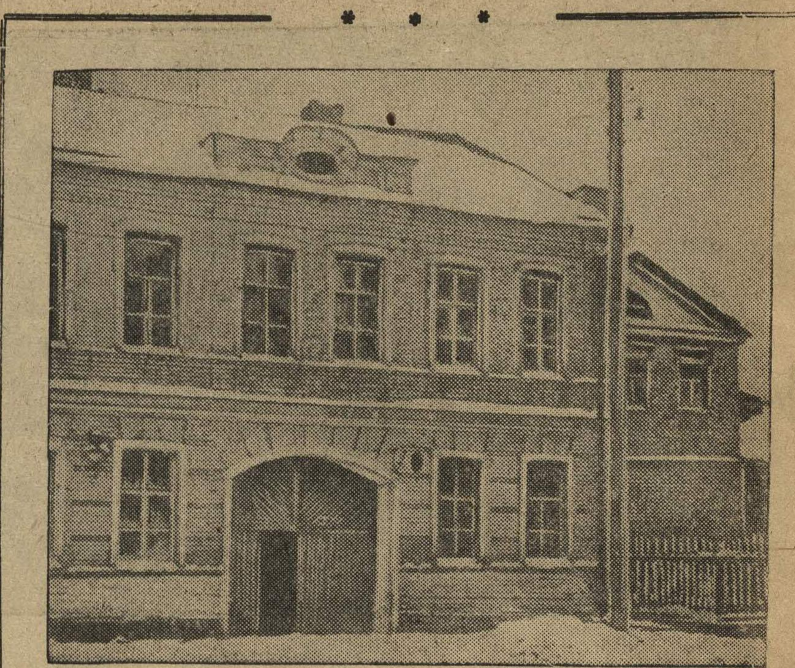
Коллектив местного музея имени Горького обнаружил несколько новых биографических подробностей из жизни А. М. Горького.

Для удобства населения расширена на 60 единиц сеть телефонов-автоматов. Теперь они имеются в магазинах, клубах, аптеках самых дальних поселков и окраин города.