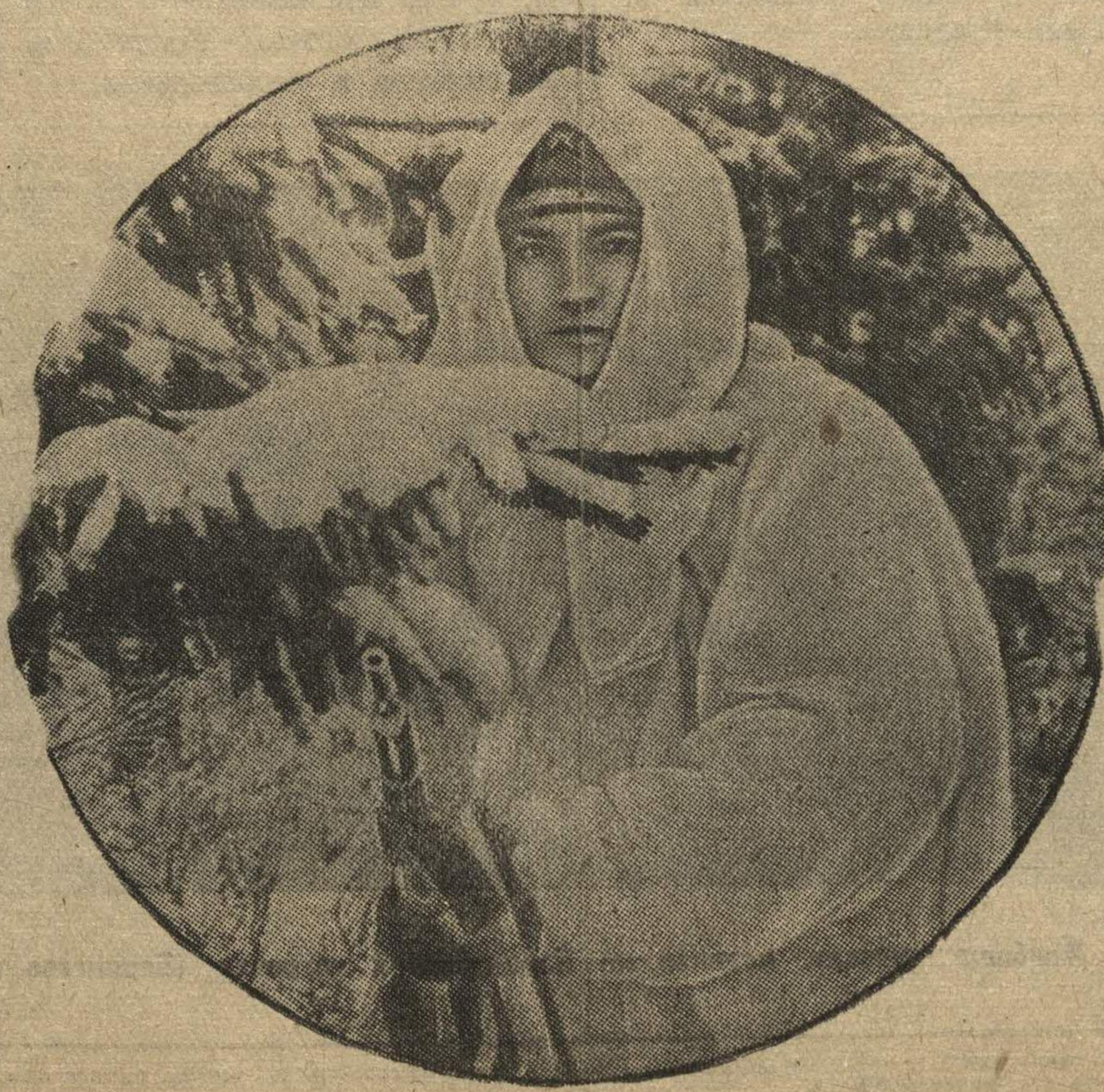
В лыжной разведке (N-ская часть Ленинградского военного округа).