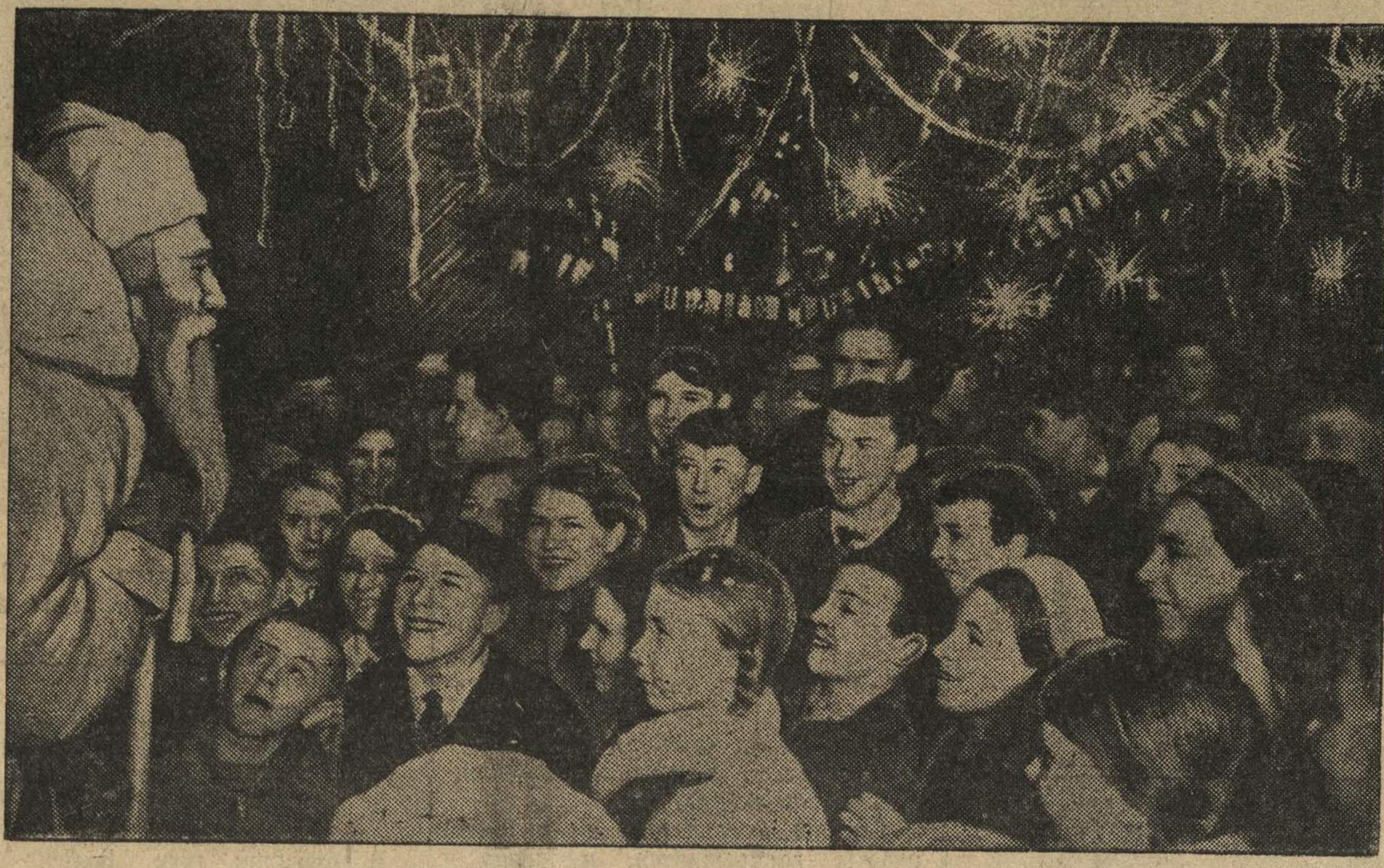
—Прощу сюда,—громно провозгласил дед-мороз. Ребята, пришедшие на елку в Дворец пионеров им. Чкалова, тесно окружили деда-мороза. Много интересного расскажет он им сейчас. Праздником елки открылись в городе школьные каникулы.

Отличники боевой и политической подготовки (слева направо): Х. Н. Карепов, А. Д. Петров, М. И. Говоров и В. С. Омельченко — в Ленинской комнате в часы досуга. (Н-ская часть, Дальневосточный фронт).