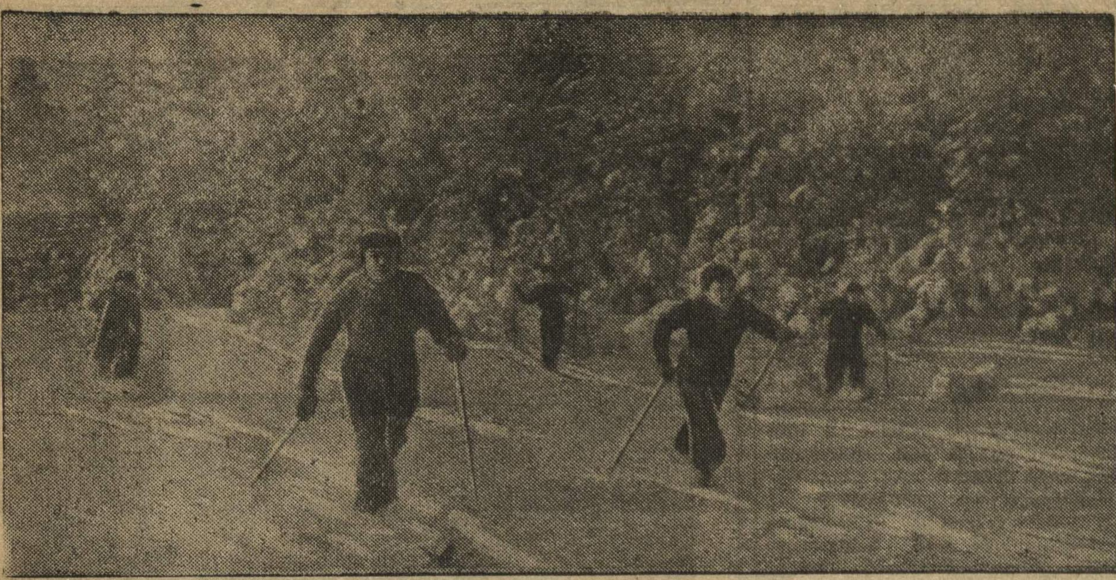
На лыжной тренировке