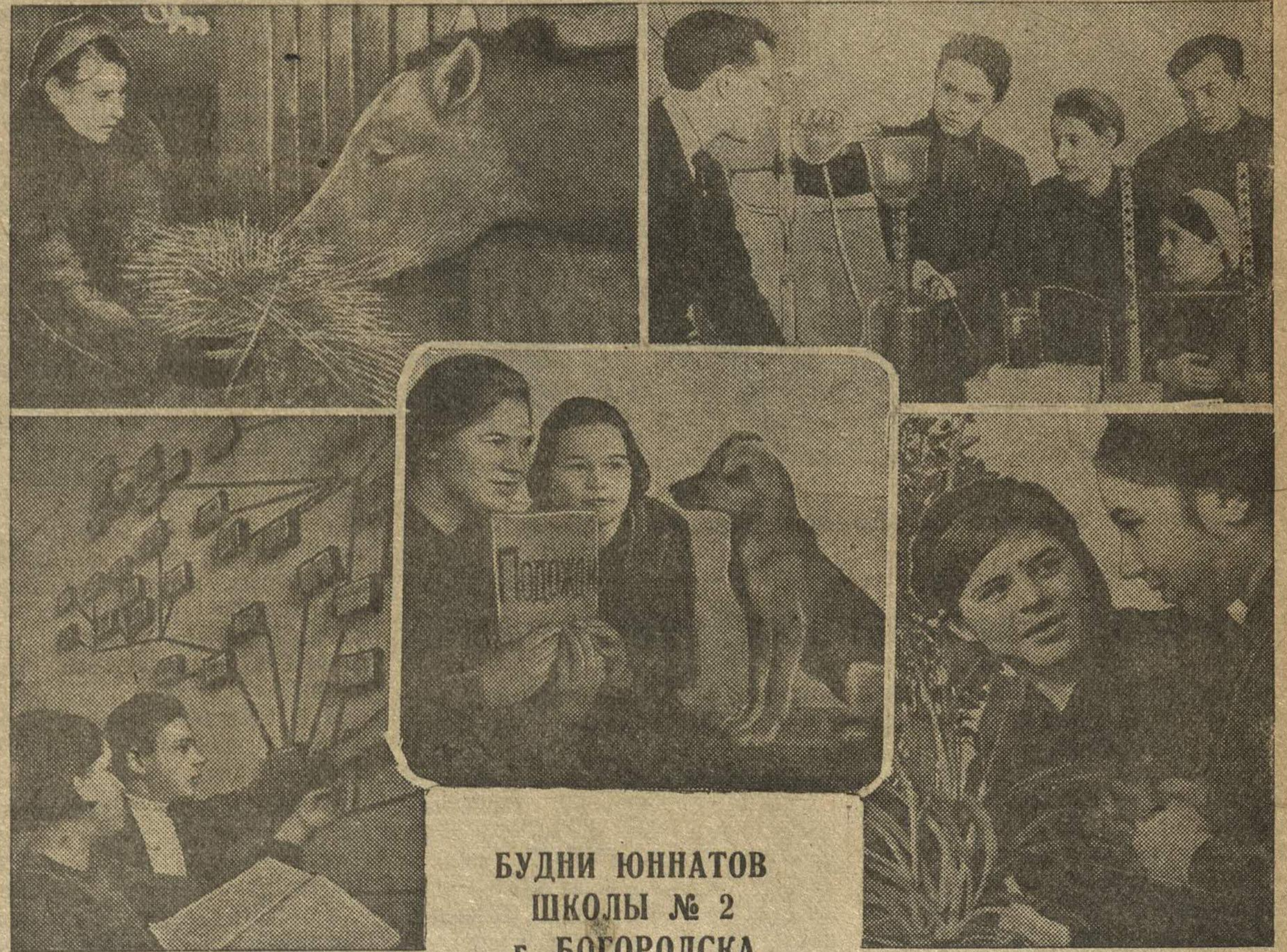
БУДНИ ЮННАТОВ ШКОЛЫ № 2 г. БОГОРОДСКА