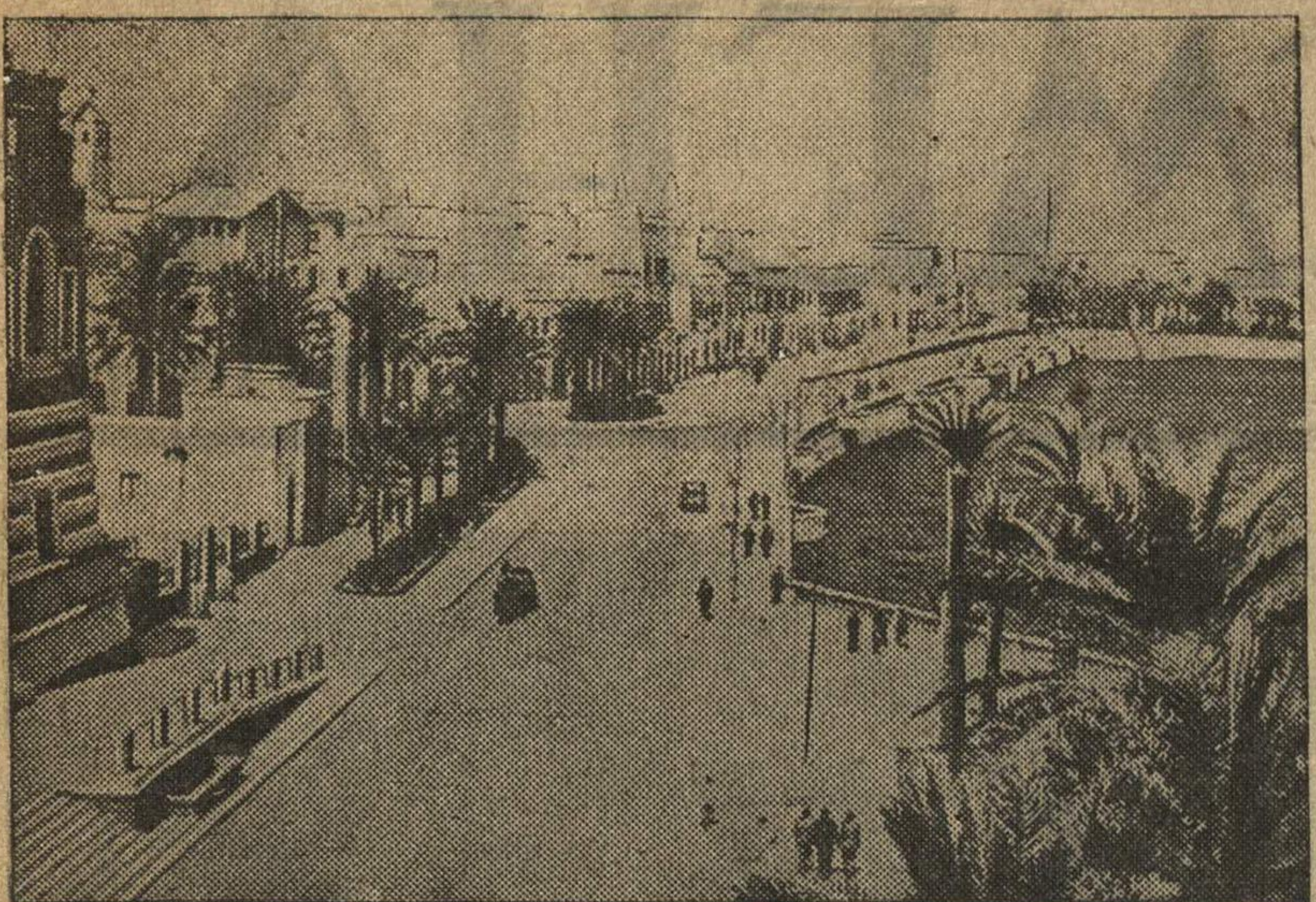
Вид на Триполи, крупный итальянский военный порт в Ливии.