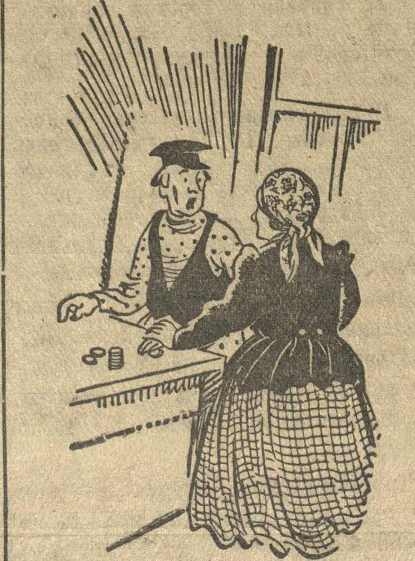
— Я тебе дам тетенька... Деньги где?...

Для публики старого нижегородского пригорода, на 90—100 верст вниз и вверх по Волге, «Абакумка» была популярна.