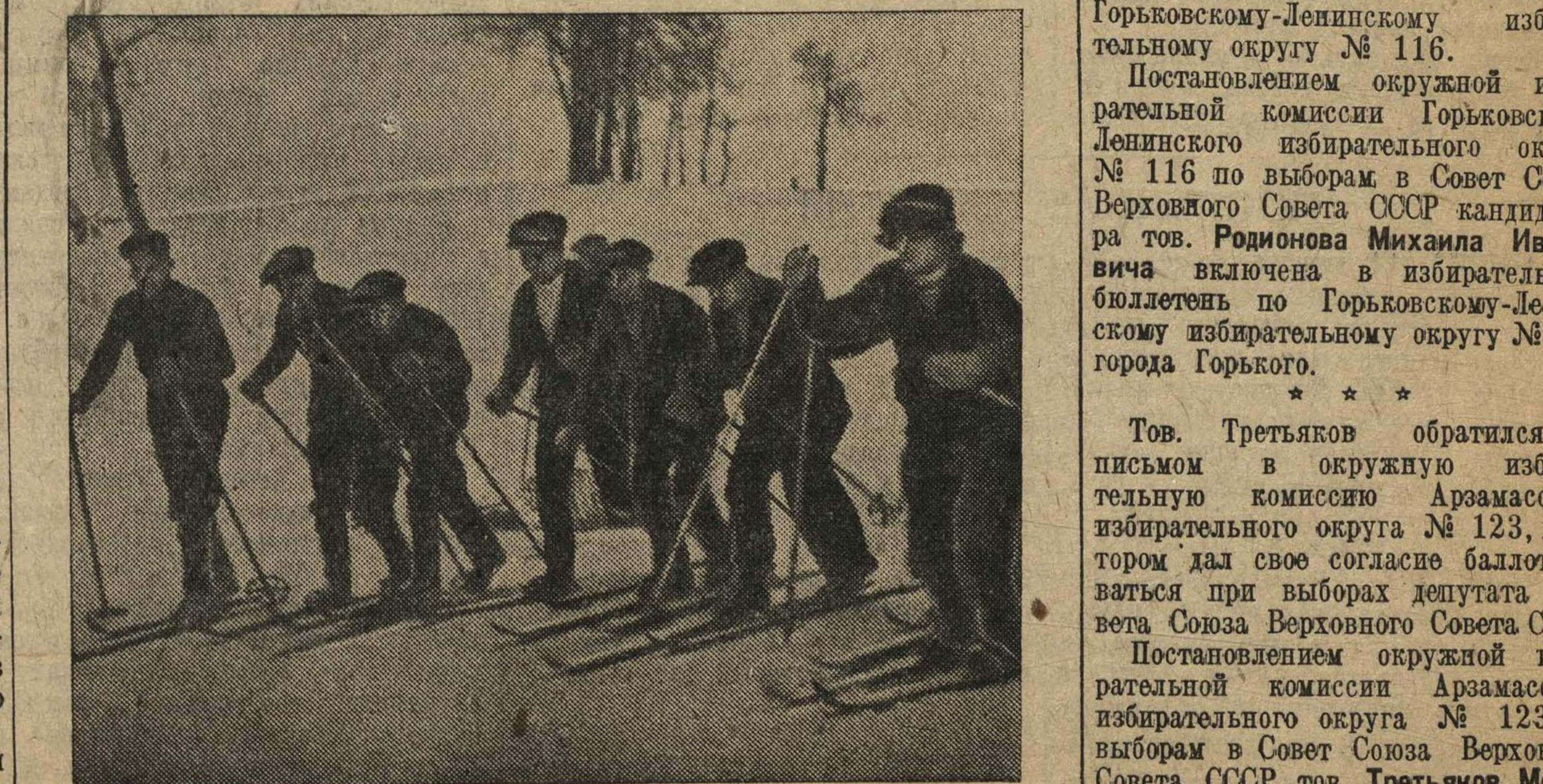
В первый день заочных лыжных соревнований с карело-финскими комсомольцами. На снимке: комсомольцы-студенты дизелестроительного техникума на 10-километровой дистанции.