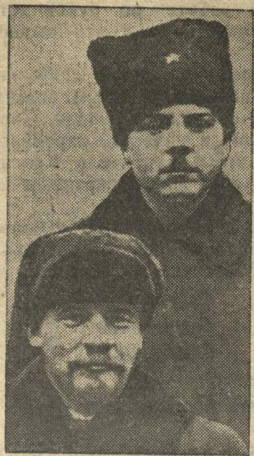
Товарищи В. И. Ленин и К. Е. Ворошилов в 1921 году.

Верный ученик Ленина и Сталина, тов. Ворошилов постоянно напоминает советскому народу мудрое сталинское указание о том, что наша страна, находясь в условиях капиталистического окружения, обязана изо дня в день крепить свою оборонную мощь, свою мобилизационную готовность, чтобы никакие «случайности» и никакие фокусы наших внешних врагов не могли застичуть нас врасплох. Многочисленные выступления тов. Ворошилова — его доклады и речи неизменно направлены к одной цели — воспитанию и укреплению советского патриотизма, повседневно