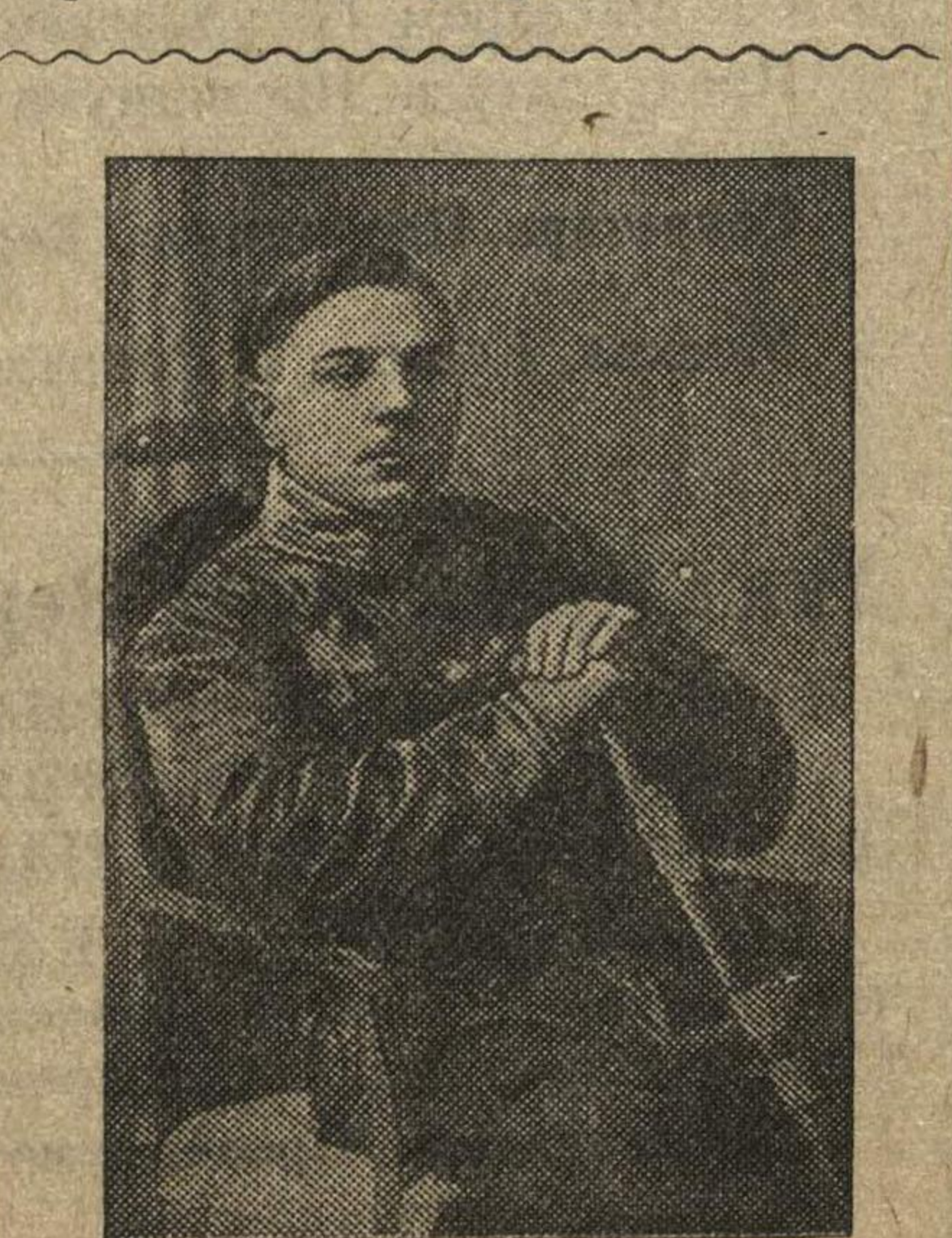
Товарищ К. Е. Ворошилов — командующий 10-й армией. Царицынский фронт. 1918 год.

— Вы что, товарищ Калинин, — сказал Буденный. — Вы думаете, что у нас в Первой конной бойцы хлеба не могут себе отбить у белых. Спрячьте свои сухари.