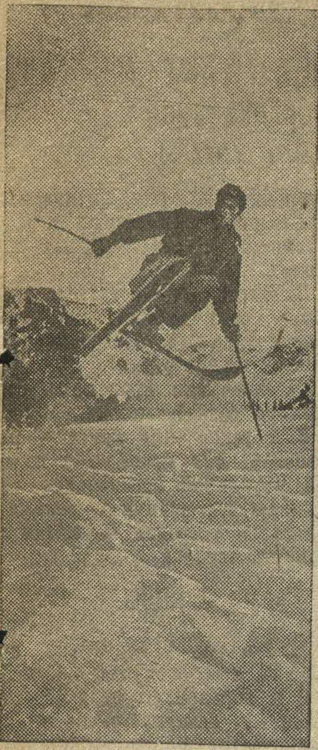
Горно-лыжная школа в окрестностях Алма-Аты (Зайлиский Алату) готовит инструкторов-общественников горно-лыжного спорта. На снимке: тренировка в прыжке на лыжах через палку.