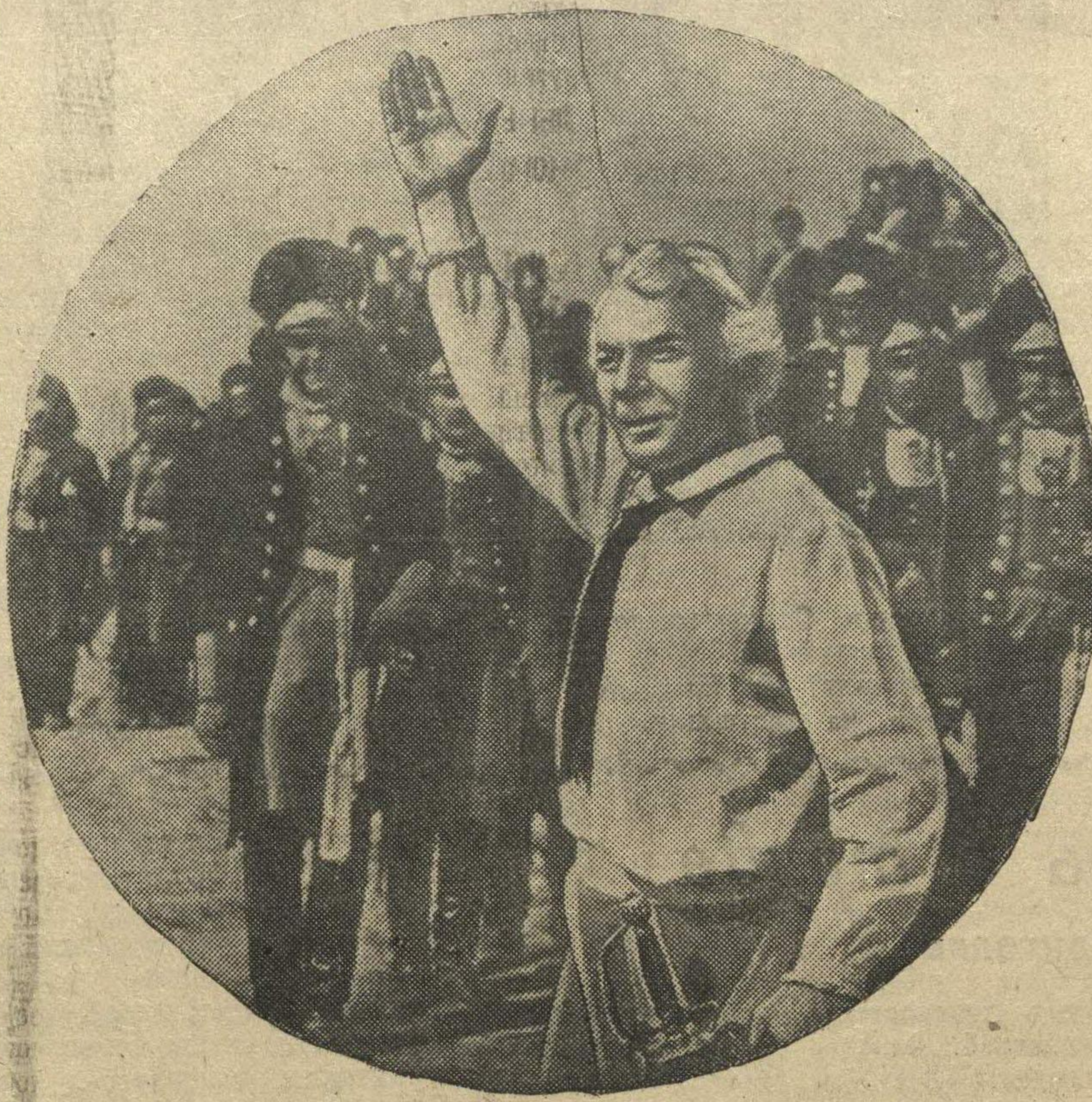
Кадр из фильма «Суворов».

телен, подвижен. Вслед за этим в его жизни наступает крутой перелом, связанный с возвращением Павла I. После многочисленных походов и сражений, оваянных славы, Суворов по приказанию самодержца «за вольнодумство и дружеское расположение к солдатам» был сослан в глухое селение Кончанское.