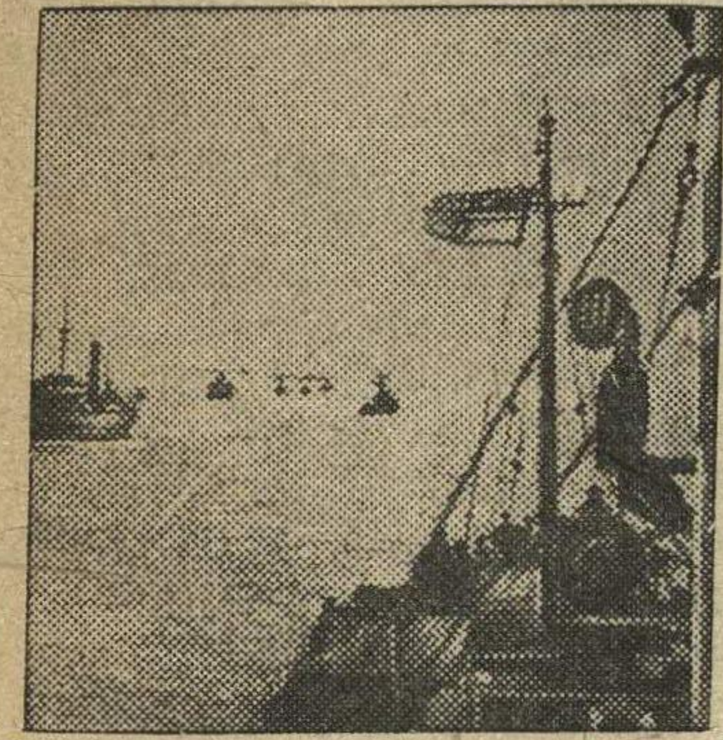
Караван английских конвоируемых кораблей.

Остановившись на перспективах военных действий против Англии, Гитлер заявил, что борьба на море может быть начата только теперь, ибо немцы хотели сначала обучить новые команды для подводных лодок, которые сейчас будут введены в действие. Сообщая об успешных действиях подводных лодок против англичан, Гитлер сказал: «С марта и апреля месяца эти господа должны будут подготовиться к совершенно другим вещам. Тогда они узнают, пропали ли мы зиму и лето лучше использовать время. Где бы англичане ни появились на континенте, мы тут же выступим им навстречу. Где бы ни появились английские корабли, против них будут действовать наши под-