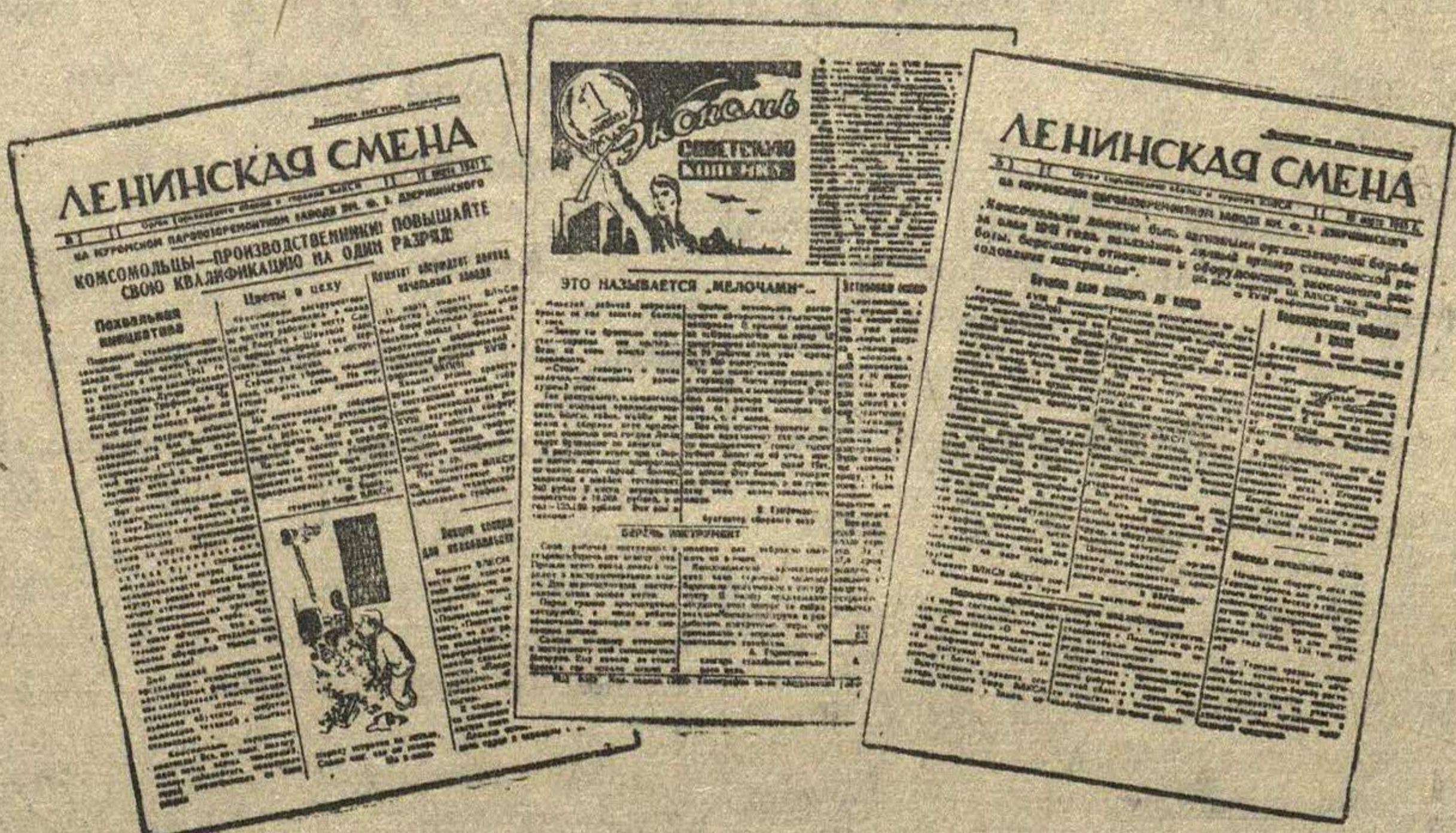
Газеты выездной редакции «Ленинской смены» на Муромском паровозоремонтном заводе.

Собрание единодушно одобрило решения XVIII Всесоюзной конференции и призвало комсомольскую организацию Мурома к большевистскому их выполнению.