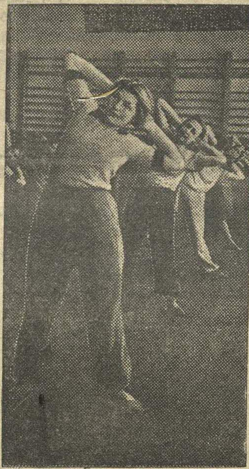
Комсомолки Молитовской фабрики «Красный Октябрь» на занятиях по гимнастике.